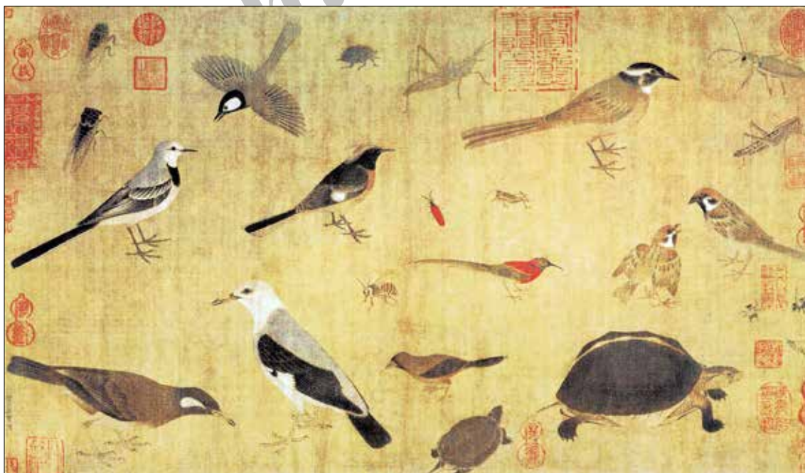
تصویر ۲. پرندگان قیمتی و لاک پشت‌ها، اثر خوانگ جوان ۱۹ ، قرن دهم میلادی (۹۰۳-۹۶۵ م.) مربوط به سلسله پنج پادشاهی، تومار، مرکب و رنگ روی ابریشم اندازه ۵۲۰×۴۱۵۰ میلی‌متر، (www.chinaonlinemuseum.com/Painting-Yuan)

ظرافت رعایت شده در طرح اندازی و القای حالت شاخه‌های درختان، به همراه شکوفه‌ها و برگ‌ها و همچنین القای حالت سبکی و چالاکی طرح پرنده‌ها، به القای لطافت و ظرافت در کل فضای تصویری مدد رسانیده است. (تصویرهای ۱س، ۱ط، ۱هـ).