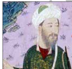
تصویر ۵ ب. بخشی از تصویر ۵

از دیگر نمونه‌های تأثیرپذیری فرهنگ تصویرنگاری تیموری از فرهنگ تصویرنگاری چین، به دو اثر تصویری دیگر پرداخته می‌شود، تصویر ۹، تصویر اسب افتاده بر زمین را به همراه مربی و ملازم خویش نشان می‌دهد. نوع طرح اندازی تصویرنگاری تیموری از حالت بر زمین افتاده