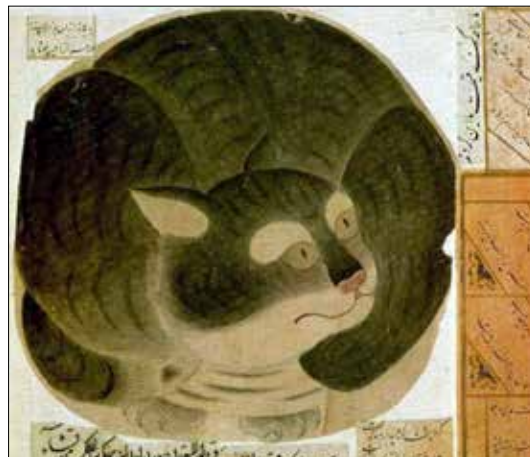
تصویر ۱۱. گربه نشسته در کمین، مکتب تیموری، هرات، موزه ی توفیایی، استانبول، خزانه 66b.fol 2160 (Sugimura 1986: 194).

یک تک رنگ (زرد، نارنجی) به سبک و روش چینی استفاده شده است. عناصر مزبور در فرهنگ تصویری چین از دوران سونگ معمول بوده است.