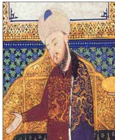
تصویر ۱ الف. بخشی از تصویر ۱، (ماخذ: نگارندگان)

آنها شکل گرفته است. در سطح یک دوم بالای تصویر- بر زمینه‌ای روشن- عناصر القاءگر معماری و تزیینات وابسته به آن مانند، پنجره‌ها، دیوارکوب، لچکی و نقوش تزیینی روی دیوار، نقش بسته‌اند. عناصر نقوش تزیینی به کاررفته در تصویر در دو مورد حائز اهمیت بوده و قابلیت ارجاع به منابع تصویری چینی را دارا هستند. الف- عناصر و نقوش تزیینی بکاررفته در البسه حضار در جلسه ب- عناصر تصویری به کاررفته شده در داخل قاب‌های عمودی در ازاره‌ها به عنوان موضوعی تصویری- تزیینی از درخت و پرنده.