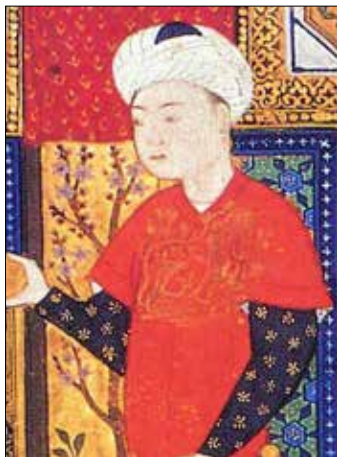
تصویر ۱ ب. بخشی از تصویر ۱، (ماخذ: نگارندگان)

تزیینات تصویر نگارانه با عناصری چون؛ آهو، درخت پرپیچ و خم حالت دار با برگ‌های پراکنده و همچنین نقوش تزیینی با تکرار خطوط موج موازی، مانند خطوط ابرهای پیچان چینی، نقش بسته‌اند. در سایر شخصیت‌های به نمایش آمده در فضای تصویری، تصویرنگار تیموری از تصویر سه موجود زنده- مرغابی، سیمرغ، آهو- به همراه ترکیبی روان و موزون با درخت یا گیاهان آبی، استفاده نموده است. (تصاویر ۱ الف، ۱ ب، ۱ ج، ۱ د، ۱ ر، ۱ و). «استفاده از عناصر تصویری مانند مرغابی، سیمرغ و آهو از دوره تانگ در چین معمول بوده است» (Kadoi, 2009: 131).