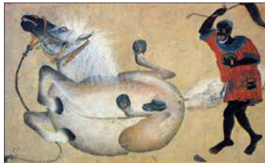
تصویر ۹. رام کردن اسب، محمد سیاه قلم، دوره تیموری، هرات ۱۴۶۹ م. / ۷۸۴ ه.ق، اندازه ۵۰×۲۲۴ میلی‌متر (http://tourcaptivedemous.wordpress.com)

تصویر ۱۱، گربه نشسته بر کمین را نشان می‌دهد. گربه در وضعیت و ترکیبی کاملاً مدور، رو به بیننده تصویر در حالتی جمع نشسته است. تصویر مربوط به اوایل قرن شانزدهم (اواخر دوره تیموری)، با خاکستری‌های ملایم و خطوط منحنی و زنده‌نما و با دقتی قابل ملاحظه در نمایش حالت جاندار گربه به نمایش درآمده است. تصویر مذکور قابل تطبیق و مقایسه - در حالت و نحوه نمایش گربه - با