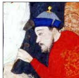
تصویر ۵ د. بخشی از تصویر ۵