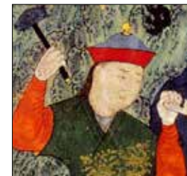
تصویر ۵ ج. بخشی از تصویر ۵