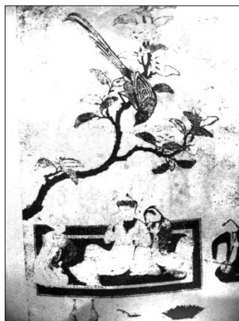
تصویر ۷. خسرو و شیرین (دولداده)، دوره تیموری، موزه توپقاپی، استانبول، خزانه 65a-fol. 215

اسب، وضعیت گردن و سر، پاها و نوع افقی شدن اندام، قابل تطبیق و مقایسه با تصویر ۱۰ از دوره یوان می‌باشد. شباهت فوق‌العاده در طراحی وضعیت هردو اسب در دو تصویر متفاوت و لحاظ نمودن تقدم تاریخی نوع چینی - تقریباً سده سیزدهم میلادی / هفتم هجری قمری، و در نظر داشتن تاریخ آفرینش تصویر ۹ تقریباً سده پانزدهم میلادی / نهم هجری قمری، تأثیر پذیری تصویر تیموری از نمونه چینی، را آشکار می‌نماید.