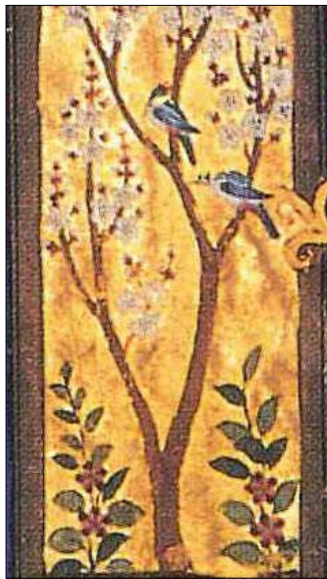
تصویر ۱ط. بخشی از تصویر ۱.