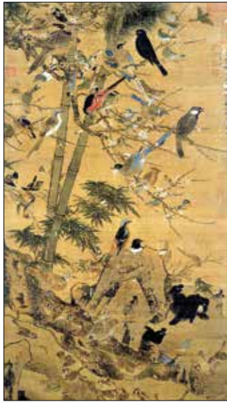
تصویر ۴. سه دوست و یکصد پرنده، بی‌ین، جینگ زائو ۱ ، حدود-۱۴۲۸ ۱۳۵۶م، ۷۵۷-۸۳۲ه.ق، دوره مینگ، طومار آویختنی مرکب و رنگ روی ابریشم، ۱/۷۸×۱۵۱/۳ میلی‌متر. کاخ موزه ملی، تایپه (www.chinaonlinemuseum.com/Painting-birds-bian-jingzhao. php)

ظریف‌تر و دارای عناصر منسجم‌تری در استفاده از صخره سازی و درختچه‌ها و پرنده‌ها به تأثیر از فرهنگ تصویرنگاری چین است. در تصویر ۶ عناصر تصویری درشت‌تر و بیان موضوع با صراحت بیشتری، به تصویر درآمده و ابرها و لباس‌ها از نوع چینی زمان خود- حدود ۱۳۰۰ میلادی/۷۰۰ هجری