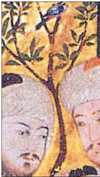
تصویر ۱هـ. بخشی از تصویر ۱.