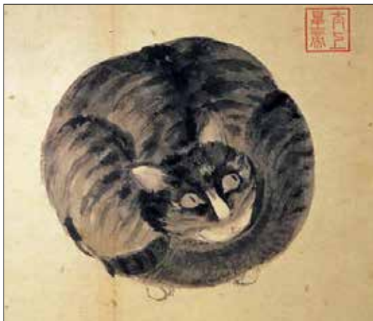
تصویر ۱۲. یک گربه، اثر شن جو (۲۲)، مینگ، ۱۴۲۷-۱۵۰۹ م. / ۸۳۱-۹۱۵ ه. ق.، ( https://news.artnet.com/art-word/taiwans-national-place-museum-digitizes-7000000-images )