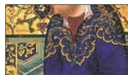
تصویر ۱ ر. بخشی از تصویر ۱، (ماخذ: نگارندگان)