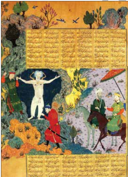
تصویر ۵. به بند کشیده شدن ضحاک در غار، برگی از شاهنامه بایسنقری، احتمالاً ۱۴۳۰م، ۸۳۳ه.ق، کاخ گلستان (حسینی‌راد، ۱۳۸۴: ۵۲).

ظریف‌تر و دارای عناصر منسجم‌تری در استفاده از صخره سازی و درختچه‌ها و پرنده‌ها به تأثیر از فرهنگ تصویرنگاری چین است. در تصویر ۶ عناصر تصویری درشت‌تر و بیان موضوع با صراحت بیشتری، به تصویر درآمده و ابرها و لباس‌ها از نوع چینی زمان خود- حدود ۱۳۰۰ میلادی/۷۰۰ هجری