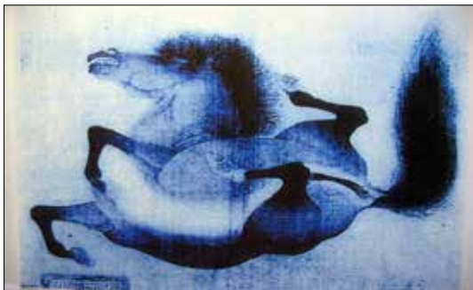
تصویر ۱۰. اسب افتاده بر زمین، هنرمند نامعلوم، مرکب روی ابریشم، دوره تانگ (www.chinaonlinemuseum.com/Painting-Yuan)

بنابر آنچه گذشت، ارتباط تیموریان و مینگ، از چهار نوع ارتباط تعریف شده در دربار چین، محدود بر دو نوع بوده است: سیاسی و تجاری. ارتباطات رسمی از طریق سفرای دو امپراتوری و همچنین در مناطق و سرحدات، امکان‌پذیر بود. هردو امپراتوری در دوران امپراتوران نسل اول - تیمور (۱۴۰۵ م. - ۱۳۷۰ م.) / ۸۰۸ - ۷۷۲ ه.ق) و هونگ وو (۱۳۹۸ م. - ۱۳۶۸ م.) / ۸۰۱ - ۷۷۰ ه.ق) به نحوی مشابه،