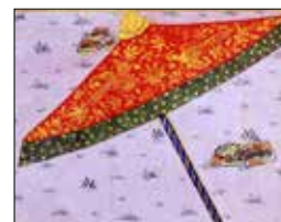
تصویر ۵ ز. بخشی از تصویر ۵ (ماخذ: نگارندگان)