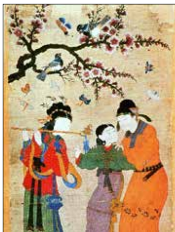
تصویر ۸: همناواری در زیر شاخه‌ی درخت دوره تیموری، موزه توپقاپی، استانبول، خزانه 2152-36a (Kilyios.ee.bilknet.edu.tr/history/Pictures2/77.jpg)

تصویر ۱۲ است. با توجه به تاریخ هردو اثر و تقدم تاریخی تصویر چینی، احتمال تأثیر پذیری تصویرنگار تیموری از تصویر مشابه چینی (تصویر ۱۱) تقویت می‌شود اما در بررسی روش اجرای تصویر ۱۱ خاکستری‌های ملایم و خطوط زنده‌نمای لطیف، دارای انسجام و لطافت بیانی چشمگیری است.