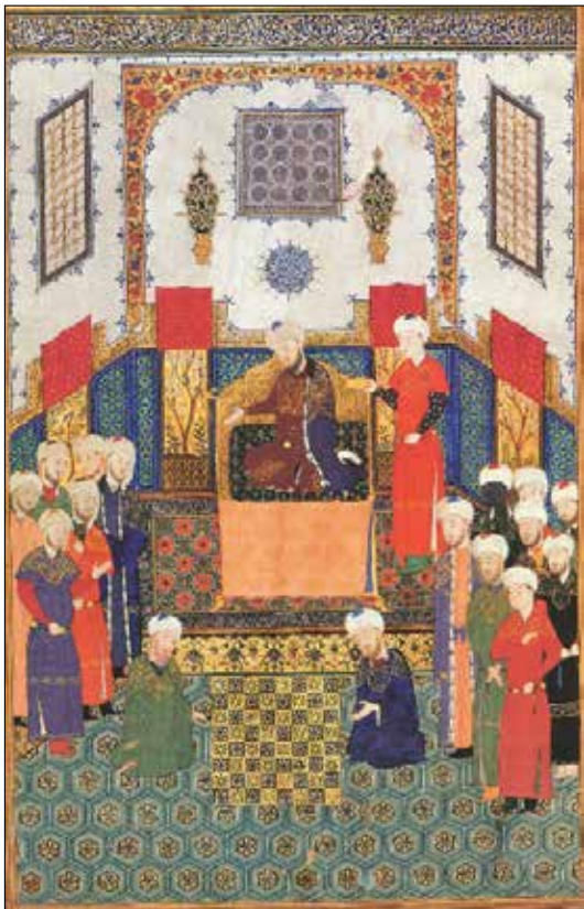
تصویر ۱. شاهنامه بایسنقری، مکتب تیموری، هرات، ۱۴۳۰ م / ۸۳۳ ه.ق. کتابخانه موزه کاخ گلستان، (حسینی‌راد ۱۳۸۴: ۶۵).

تصویر ۱ نمایشگر صحنه مباحثه دانشمندان در حضور پادشاه است. شخصیت اصلی تصویر -حاکم- در میانه تصویر و بر روی سریری استقرار یافته است. ملازم نزدیک او در سمت چپ وی و سایرین در مرتبه‌های پایین‌تر در دو سمت تصویر در وضعیتی ایستاده به نمایش درآمده‌اند. دو نفر نشسته در پیش زمینه روبروی هم نشسته و مباحثه میان