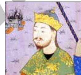
تصویر ۵ الف. بخشی از تصویر ۵