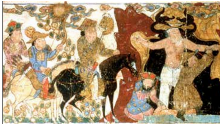
تصویر ۶. فریدون ضحاک را در کوه دماوند به بند می کشد، تصویری از اولین شاهنامه کوچک، شمال غربی ایران، ۱۳۰۰ م / ۷۰۰ هجری قمری، (www.Cbl.ie/islamicseals/View-Seals/137.aspx)

تصویر ۵ د شخصیتی که وظیفه کوبیدن میخ بر پای ضحاک را دارد، بر پشت لباس خود- حدوداً بر روی کتفها- نقشی از پرندهای مانند سیمرغ به همراهی چند گیاه پیچ و تابدار به سبک پرنده و گیاه چینی را در حالتی چهار گوش با خود دارد تصویرنگار، در طرح اندازی خود، نقوش تزئینی دو سوار- به عنوان شخصیت‌های قابل احترام صحنه- آزادتر و بدون محدودیت طرح در شکلی چهار گوش، اما در طرح اندازی دو نفر شخصیت در حال انجام وظیفه، تصویر ۵ ج، ۵ د، سعی بر محدود نمودن اشکال تزئینی در قابی چهار گوش داشته است. تصویر ۵ ز، سایبانی را بر سر پادشاه جوان نشان می‌دهد. نقوش تزئینی بر روی سایبان، القاگر نقوش تزئینی گیاه و پرنده ملهم از اصل چینی است. حضور یک جفت پرنده به نحوی متقارن و مکمل با بال‌های گشوده و دم‌های بلند به همراه نقوش گیاهی نسبتاً متقارن، یادآور الهام تصویرنگار تیموری از تصویرنگاری چینی است (تصویر ۷ و ۸). عناصر به کار گرفته شده به عنوان نقوش تزئینی البسه چهار شخصیت، مانند: مرغابی، گیاهان تزئینی کنار آب، سیمرغ و خطوطی چون ابرهای پیچان، پرنده‌هایی با دم‌هایی بلند، از عناصر تصویرنگاران چینی مورد استفاده در تصویرنگاری تیموری شاهنامه باسینقری است.