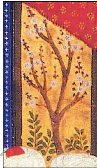
تصویر ۱س. بخشی از تصویر ۱.

موضوع پرنده بر روی درخت، از موضوعات تصویری تجربه شده در فرهنگ تصویرنگاری چین بوده و پرداختن به تصویرگری پرندگان - به نحوی طبیعی و اندام شناسانه - در چین به سده دهم میلادی / چهارم هجری قمری، برمی گردد (تصویر ۲).