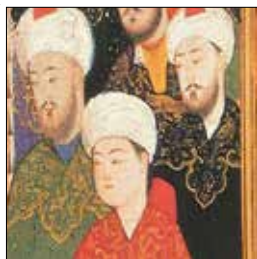
تصویر ۱ د. بخشی از تصویر ۱، (ماخذ: نگارندگان)

تصویرنگار تیموری در قاب‌بندی مستطیل شکل عمودی در ازاره‌های میانه تصویر، به همراه گره چینی هندسی در پایین