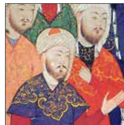
تصویر ۱ ج. بخشی از تصویر ۱، (ماخذ: نگارندگان)

برروی لباس شخص اول مجلس- حاکم- لباس زیر ردا و ردای پوشیده شده بر شانه سمت چپ وی (تصویر ۱ الف).