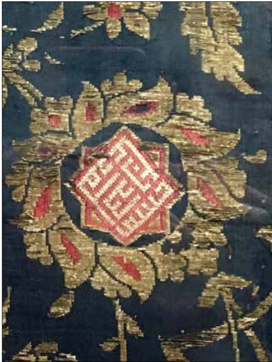
تصویر ۱: نوشته داخل شمشه (عمل غیاث‌الدین نقش‌بند)، که در میان سی و دو گل‌های شاه‌عباسی کوچک متن دیده می‌شود.

او، در القای مفاهیم عمیقی که به صورت نمادین در بافته‌های خود منعکس نموده، بی‌تاثیر نبوده است» (همان: ۱۰). این آثار، با توجه به تاریخ پیش‌بینی شده در مورد تولیدشان، تجربیات و دیدگاه‌های فکری این استاد بافنده را در طی دوران فعالیتش، تاحدودی آشکار می‌سازند. غیاث‌الدین در سال‌های آغازین فعالیتش در اصفهان، در میان نقوش پارچه‌های بافته شده‌اش، عنوان غیاث را قرار داده است و با گذشت زمان، این عنوان را به عمل غیاث تغییر داده و در سال‌هایی که اوج فعالیت و شهرت را می‌گذرانده، خود را غیاث‌الدین نقش‌بند معرفی کرده است. او در تعداد برجا مانده از آثارش، نام خود را درون نقش شمشه هشت پر، به سایر نقوش در بافته‌ها اضافه کرده، و با مهارت آن را به نقشی تزیینی تبدیل کرده است. آنچه غیاث‌الدین علی یزدی را از دیگر بافندگان دوره صفوی متمایز می‌سازد، همین ویژگی، یعنی ثبت نامش در بافته‌ها است.