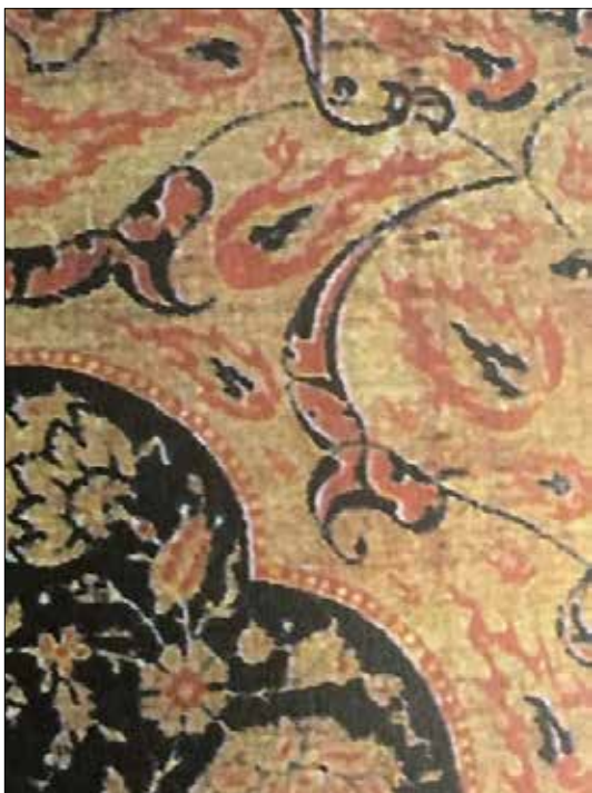
تصویر ۸: نقش شراره‌های آتش در گوشه‌های بالای محراب.

حرکت پویای مارپیچ در شکل تکامل یافته‌اش اسلیمی، ریشه در اعتقادات مقدس دارد. «تکرار نمادین اسلیمی نوعی استذکار به انسان بوده است که همواره، او را برای رها شدن از عالم اسفل و عروج به ملکوت و به سوی حق تعالی، یادآور باشد. به سخنی دیگر، منظور از تکرار، همان ذکر است» (موسوی‌لر و پورجعفر، ۱۳۸۰: ۱۰۱). بافت نقش شراره‌های آتش بر زمینه گوشه‌های محراب با ترکیب‌بندی ایستا و منظم و قرینه، یادآور امری متعالی در قالب تصویر است و سیر آسمانی انسانی کامل به سوی آسمان را یادآور شده است. یک ویژگی الهی برای انسان‌های برگزیده ملکوتی که از نگارگری دوره ایلخانی به بعد، به هنرهای اسلامی شیعی راه پیدا کرد.