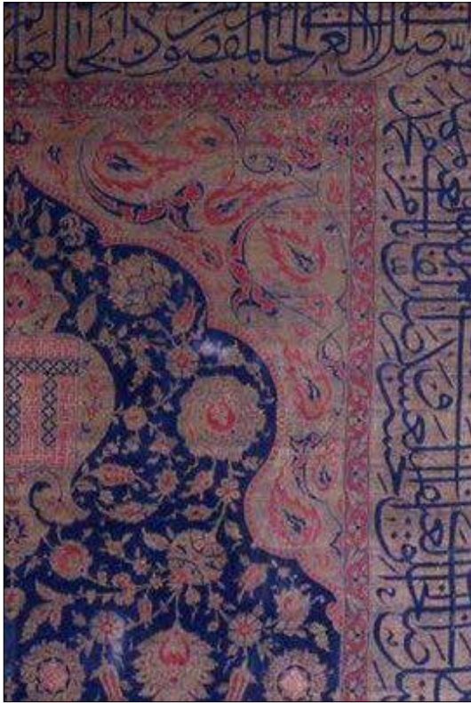
تصویر ۴: نقش اسلیمی دهن ازدهایی در گوشه‌های بالای محراب به صورت قرینه قرار دارند.

کوچک‌تر است» (هزاوه‌ای، ۱۳۶۳: ۱۰۷) این نقش در کنار گل‌های شاه‌عباسی، هماهنگی موزونی ایجاد می‌کند. اسلیمی‌های گوشه‌های بالای محراب به رنگ سرخ رنگ در زمینه کرم با دورگیری به رنگی تیره قرار گرفته‌اند. این دورگیری از ویژگی‌های بافته‌های غیاث‌الدین است که آن را از شیوه قلم‌گیری نقاشی‌های رضاعباسی الهام گرفته است. غیاث‌الدین در تصویر نقوش بافته‌هایش به شدت تحت تاثیر نگارگری مکتب تبریز و اصفهان بود.