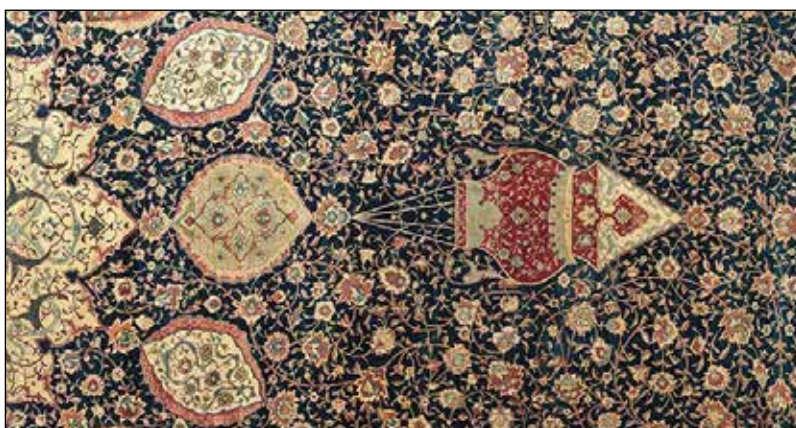
تصویر ۷: قندیل قالی شیخ صفی‌الدین اردبیلی.

کرده است. این نقش چنانکه از نام آن پیداست، مفهوم نور را تداعی می‌کند؛ (نور: ۶۴) «ستاری، ۱۳۷۶: ۵۳». انتخاب رنگ و نقوش تزیینی در این قطعه پارچه، بی‌شبهت به قالی منسوب به شیخ صفی‌الدین اردبیلی نیست. قالی در ابتدا، یک جفت بوده که بر اثر زلزله اردبیل آسیب دیدند و از ترمیم آن‌ها، یک قالی سالم تهیه شده که اکنون نمونه سالم آن در موزه ویکتوریا و آلبرت لندن نگهداری می‌شود. «بافت آن در شهر کاشان و تاریخ کتیبه آن ۹۴۶ ه. ق، به نام استاد مقصود کاشانی است.» (چیت‌سازان، ۱۳۸۵: ۱۱۱) این قالی‌ها مصادف با سیزدهمین سال سلطنت شاه تهماسب، در کف تالار قندیل خانه حرم شیخ صفی‌الدین اردبیلی گسترده شدند. نقش قندیل پارچه غیاث‌الدین، شباهت زیادی به طرح قندیل قالی شیخ صفی‌الدین دارد. پارچه بافته شده، به طور تقریبی، ۵۴ سال پس از قالی مذکور بافته شده است؛ این احتمال وجود دارد که منبع ایده‌ای برای موضوع بافت پوشش بقعه باشد، تا هماهنگ با قالی‌ها باشد. غیاث‌الدین در زمینه پارچه پوشش مزار از رنگ آبی تیره زمینه قالی ایده گرفته است. گل‌های زمینه قالی، همگی دارای نقش ختایی و گل‌های شاه‌عباسی هستند که با نقوش پارچه مزار در هماهنگی بودند.