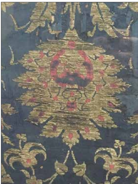
تصویر ۵: نقش یکی از دوازده گل شاه‌عباسی اناری متن پارچه

دینی است. این نقوش اسلیمی حرکتی نرم و سیال دارند که حرکت و سکون را در گوشه‌های محراب، به تماشا می‌گذارند. نقش اسلیمی در دوران تیموری و صفوی از نظر بیان مفاهیم مذهب شیعه، به عالی‌ترین شکل خود رسید. به‌طوری‌که، «بزرگ‌ترین نقاش صفوی، سلطان محمد، که خود استاد نقوش قالی بود، با به‌کار بردن شکل ابرها و ساقه پیچ در پیچ، طرح‌های جدیدی به‌وجود آورد» (هزاوه‌ای، ۱۳۶۳: ۱۰۳) که برای بافندگان پارچه از جمله غیاث‌الدین، منبع الهام بود.