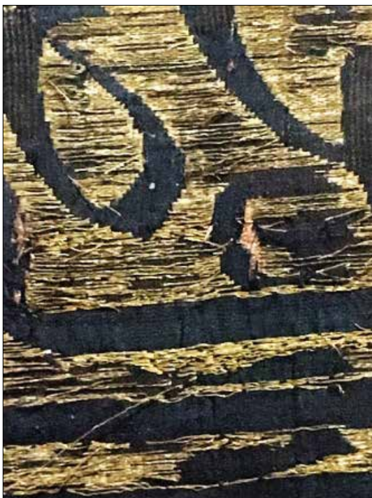
تصویر ۳: عبور نخ‌های گلابتون از روی تار و پود زمینه بافت (ماخذ: نگارندگان)

را غیاث‌الدین به کار برده است. «احتمالاً، این مخمل ابریشم در اصفهان، حدود سال ۱۰۰۰ ه. ق.، بافته شده است. زمینه بافت ساده و نقوش بافت مخمل است. در آن، ویژگی‌های کار غیاث، یعنی در هماهنگی زمینه و نقوش اصلی کاملاً به چشم می‌خورد. این پوشش قبر، یکی از برجسته‌ترین آثار هنر پارچه‌بافی است که تا به حال، شناخته شده است. طرح‌های انتزاعی و اسلیمی و گل‌های شاه‌عباسی به طرز دلپذیری بر این پارچه، نقش شده‌اند. حرکت و پیچش‌های بسیار ظریفی به شاخه‌ها داده شده که اشکال گوشه‌داری را پدید آورده‌اند. با حالت شعف و طربی که از مشاهده این پارچه به وجود می‌آید، به نظر می‌رسد، کاربرد آن برای پوشش قبر نامناسب باشد؛ ولی با وجود کتیبه‌ای که در حاشیه این پارچه وجود دارد، می‌توان ربطی برای کاربرد آن یافت» (پوپ و اکرم، ۱۳۸۷: ۲۵۰۰).