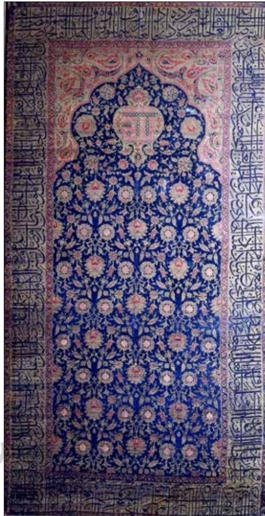
تصویر ۲: پوشش قبر شیخ‌صافی‌الدین اردبیلی - موزه ملی ایران (ماخذ: آرشیو عکس موزه ملی ایران).

در مجموعه شیخ‌صافی‌الدین اردبیلی، سه بنای آرامگاهی مجزا و در عین حال مجاور موجود است. «دومین بنای آرامگاهی، برج مقبره شیخ‌صافی‌الدین است - که به گنبد الله موسوم بوده - و در فاصله بین سال‌های ۷۳۵-۷۵۹ ه. ق. ساخته شده است. در حال حاضر، زیر گنبد الله چهار صندوق قبر وجود دارد؛ از میان آن‌ها، تنها صندوق شیخ‌صافی‌الدین تزئینات کتیبه‌ای دارد. جمعی از هنرمندان، فنون و صنایع گوناگون هنری زمان خویش را برای آراستن آخرین منزل شیخ، به کار برده‌اند. این صندوق در سال ۷۳۵ ه. ق. ساخته شده است. صندوق مقبره شیخ‌صافی‌الدین از دو مکعب مستطیل سوار بر هم تشکیل شده، و از نظر ابعاد، بزرگ‌ترین صندوق قبر مجموعه به‌شمار می‌رود» (خیرالهی از ناوله، خزایی و نعمتی، ۱۳۹۰: ۱۲۷). پارچه مورد بررسی در این تحقیق - که برای مزار شیخ‌صافی‌الدین، تهیه شده است - در نمایی کلی، دارای طرح محرابی یا ساجده‌ای است، که معادلی برای مسجد با بیانی نمادین برای آن است. پارچه از الیاف ابریشم بافته شده، و بافت آن چندلا و دارای تارهای فلزی (گلاتون) است. «کاربست، در هنرهای تزئینی اسلامی به نوار یا چهارچوب اثر، که کار در محدوده آن طرح و ریخته