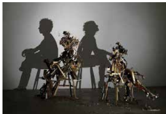
تصویر ۴۸: سایه، اثر هنرمندی گمنام، شکل گرفته از مفتول‌های گوناگون، متعلق به ۲۰۱۷ م..

به هر تقدیر، هنرمندان دیگری با سود جستن از آهن آلات و پیچ و مهره کردن اجزای فلزی به یک‌دیگر - که نمودی انتزاعی دارد - موفق به خلق سایه‌هایی شده‌اند که انسان‌هایی را نشسته به روی چهار پایه، از طریق افتادن سایه‌هایی به روی دیوار مقابل، به نمایش گذارده‌اند (تصویر ۴۸). تصویری که در واقع، وجود خارجی ندارد و کلاً، زاییده تخیلات و تجسمات هنرمند است. باربارا هیپورث، تندیس‌ساز انگلیسی نیز با خلق آثاری انتزاعی، به نام بیضی که با سنگ مرمر به وجود آورده، به خوبی، از فضای منفی (خالی و مجوف) در شکل دادن به اثرش بهره می‌گیرد. او در این اثر، مانند الکساندر آرشیپنکو، فضای منفی را به جای فضای مثبت به کار گرفته است؛ در واقع، اثرش نه مجسمه‌ای ناکامل بلکه تندیس کامل است (تصویر ۴۹).