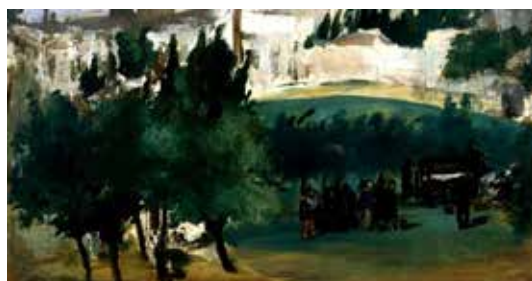
تصویر ۱۰: قسمتی از اثر که همچنان ناتمام رها شده است (ماخذ: همان).

پُل سزان ۲۵ نقاش فرانسوی، در اثری که به خلق یک منظره می‌پردازد، وی از کامل نمودن اثر، شاید به علت خستگی و بی‌حوصلگی سر باز می‌زند، تا در زمانی دیگر آن را به پایان رساند، زمانی که هیچ‌گاه برای او، خلق میسر نمی‌شود. این، اتفاقی است که بارها برای بسیاری از هنرمندان رخ می‌نماید. مانند اثری از ونسان وان گوگ، ۲۶ نقاش هلندی، که در به نمایش گذاشتن منظره‌ای در یک خیابان از به پایان بردن آن صرف‌نظر می‌کند (تصاویر ۱۱ و ۱۲).