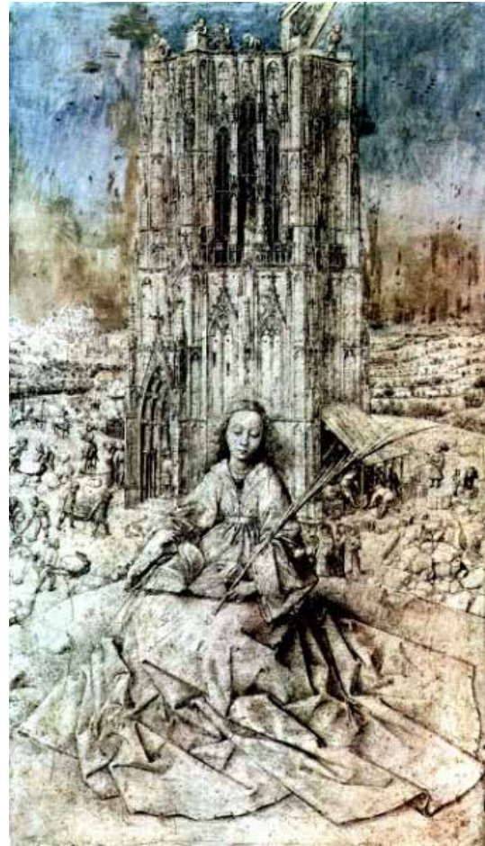
تصویر ۱: باربارای مقدس، اثر بیان وان ایک، هنرمند فلاندی متعلق به ۱۴۳۷ م..