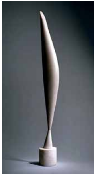
تصویر ۲۹: پرندۀ در فضا، اثر کنستانتین برانکوزی، مجسمه ساز رومانیایی، از سنگ مرمر، متعلق به ۱۹۲۳-۲۸ م..