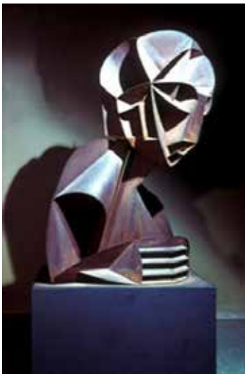
تصویر ۳۳- چهره اثر ناوم گابو، مجسمه‌ساز روس، از مقوا، متعلق به ۱۹۱۷م. (ماخذ: همان).