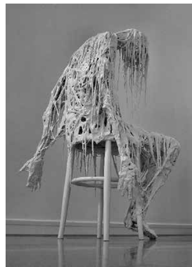
تصویر ۳۹: در انتظار ابدیت، اثر ساشا وینسی، هنرمند ایتالیایی، متعلق به ۲۰۰۷م. (ماخذ: URL11).

می‌گذارد (تصاویر ۳۴ و ۳۵). در واقع، مخاطب بقیه سر را در ذهن خویش می‌سازد.