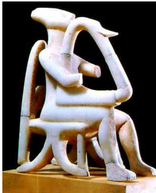
تصویر ۲۵: هنر آژهای، مرد چنگ نواز، مجسمه‌ای که به صورت هندسی و استوانه می‌باشد، متعلق به مینوسی میانه، حدود ۲۰۰۰ ق.م..

هم‌چنین، این نوع ترکیب‌بندی را در اثر ادواردو ماتا ایکازا ۳۸ نقاش معاصر کاستاریکایی، می‌توان نظاره نمود. او در چهره‌سازی‌های خویش، اشاره به بخش کوچکی از صورت می‌کند و بخش دیگر را به کلی، رهامی‌سازد (تصاویر ۲۳ و ۲۴). در این جا، قابل ذکر است که اگر به گذشته‌های دور، نظری افکنده شود، آثاری دیده می‌شود که نه تنها، هنرمند در مجسمه خویش اجزای چهره پرسوناژ را نساخته است، بلکه