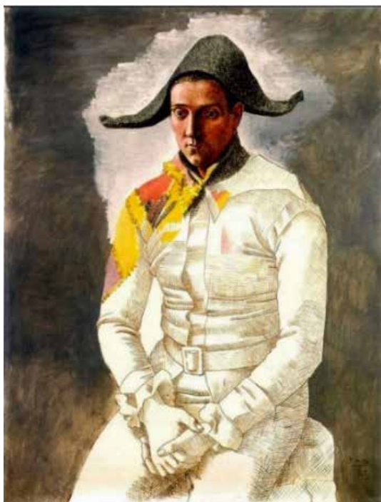
تصویر ۱۵: دلچک نشسته، اثر پابلو پیکاسو، نقاش، چاپگر و مجسمه ساز اسپانیایی، رنگ روغن روی بوم، متعلق به؟.