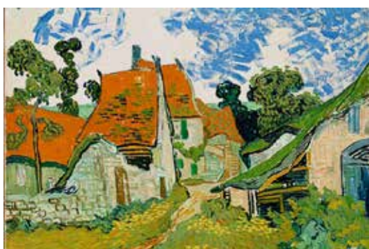
تصویر ۱۲: خیابان آور، اثر ونسان وان گوگ، نقاش هلندی، رنگ روغن روی بوم، متعلق به ۱۸۹۰ م. (ماخذ: همان).