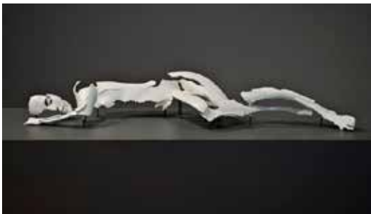
تصویر ۳۸: زن خوابیده، اثر سوفی کان، مجسمه‌ای از مقوا، نمایش از طریق فیلم ویدئویی، متعلق به حدود ۲۰۱۵م. (ماخذ: همان).