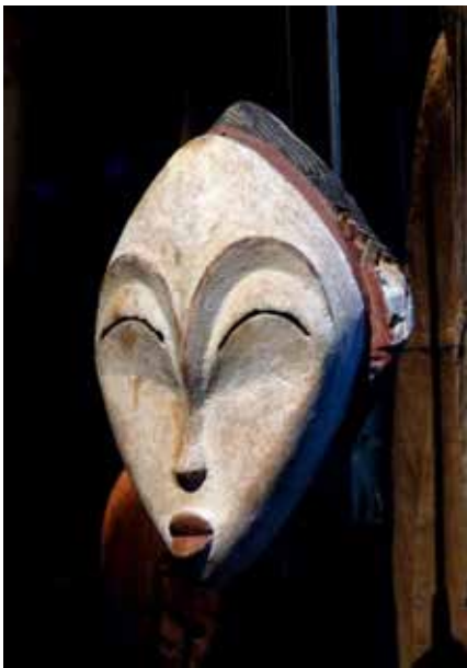
تصویر ۳۰: ماسک سفید پونو، متعلق به کشور گابن، در غرب آفریقای مرکزی.