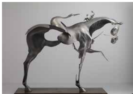
تصویر ۴۲: اسب، اثر گروهی اونماسک، شامل لیوزان، کوانگ جون و تان تیانونی، از فولاد ضد زنگ و سنگ مرمر، متعلق به حدود ۲۰۰۸م.