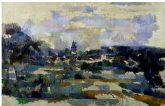
تصویر ۱۱: منظره، اثر پل سزان، رنگ روغن روی بوم، متعلق به ۱۹۰۵ م..