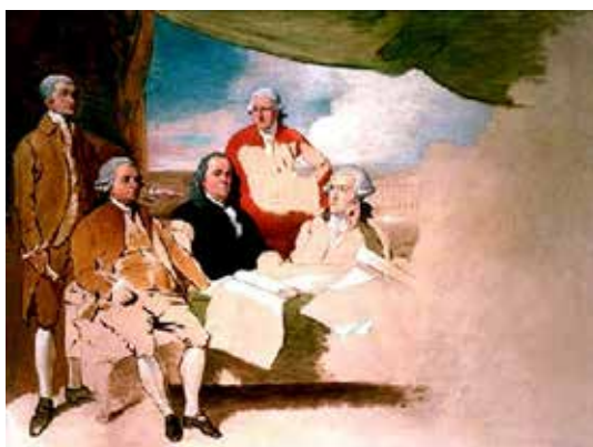
تصویر ۸: عهد نامه پاریس، اثر بنجامین وست، نقاش آمریکایی از پنسیلوانیا، رنگ روغن روی بوم، متعلق به ۱۷۸۳ م. (ماخذ: همان).

غرب انداخته شود که به علت به کار نگرفتن برخی عناصر زیباشناسی صورتی ناکامل به خود گرفته‌اند.