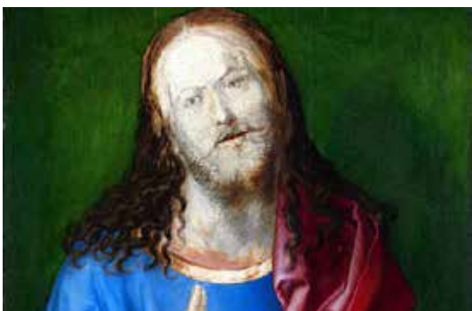
تصویر ۴: حضرت مسیح بانگشتش اشاره به خداوند یکتا مینماید، قسمتی از اثر. (ماخذ: همان).

همچنان ناتمام رها شده‌اند. در واقع، احتمال دارد که هنرمندان غربی، قبل از این که به سرای وعده داده شده