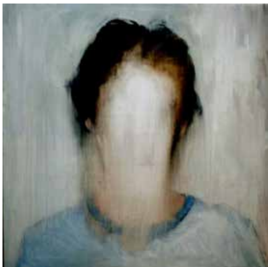
تصویر ۲۲: انسان بی‌چهره، اثر کرگ وادل، رنگ روغن روی بوم، متعلق به ۱۳۲۰ م. (ماخذ: همان).

هم‌زمان، آثاری را ارائه نمودند که حکایت از چنین رویکردی دارد؛ مانند اثری از نقاش معاصر آمریکایی به نام کرگ وادل. ۳۷ وی در اثر «من خود را در تو می‌بینم»، ضمن سود جستن از همسرش به عنوان مدل، زیر تلی از رنگ، چهره‌ای را ارائه می‌نماید که هر چند اعضای صورت، تاحدودی، نمایان است، لیکن، گویی که چشم، بینی، لب و گوش پرسوناژ از جادر رفته و حالتی ناکامل به خود گرفته است (تصویر ۲۱). او در اثر دیگری به نام «انسان بی‌صورت»، تمامی اجزای چهره را حذف می‌کند؛ که اثرش ظاهراً، حالتی ناکامل به خود می‌گیرد؛ لیکن، با توجه به موضوع و مضمون، اثری کامل و یا به عبارتی دیگر، به کمال رسیده می‌باشد (تصویر ۲۲).