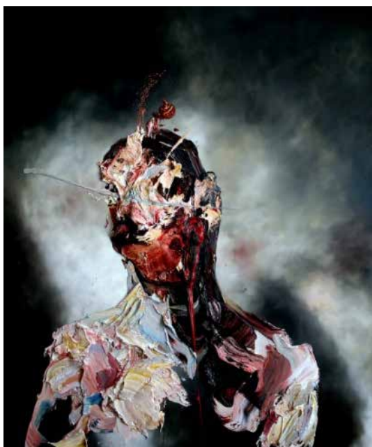
تصویر ۲۰: چهره‌ای درهم ریخته، اثر آنتونی میکالیف، رنگ روغن روی بوم، متعلق به حدود ۲۰۱۶م. (ماخذ: همان).

چهره پرسوناژ ۳۴ روی بوم، به صورت فیگوراتیو ۳۵ بخشی از اثرش را ابتدا، با رنگ آکرلیک و سپس، با رنگ روغن به پایان می‌برد و بخش دیگر را هم چنان، با مداد رها می‌سازد، تا حس و برداشت تازه‌ای را القا نماید (تصویر ۱۹). از هنرمندان