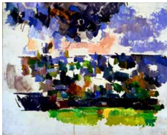
تصویر ۱۳: چهره، اثر ناتمام ادوار دوپار، نقاش و چاپگر فرانسوی، رنگ روغن روی کاغذ، متعلق به حدود ۱۸۹۱ م..

باشد (تصویر ۱۷). هنری ماتیس ۲۰ نقاش فرانسوی نیز در مورد آرایش آثارش که به کمال می‌رسند و کمال را در خلق بیان می‌بیند، چنین اظهار نظر می‌نماید: «آنچه در پی‌اش هستیم، در درجه نخست بیان (اکسپرسیون) ۲۱ است... هر چیز، نقشی ایفا می‌کند. ترکیب‌بندی، هنر آراستن عناصر موجود در اختیار هنرمند، به طرز تزیینی برای بیان احساسات خویش است... هر آن چه در تابلو مفید نباشد، زیان‌آور است» (گاردنر، ۱۳۶۵: ۶۱۸). و یا در جایی دیگر می‌گوید: «بیان در روش تفکر من، عبارت از بازتاب انفعالات بازتابنده بر یک چهره و یا آشکار شده توسط حرکات و اشارات شدید