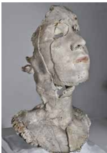
تصویر ۳۵: سر، اثر سوفی کان، مجسمه‌ساز استرالیایی، تندیس از جنس سرامیک، متعلق به ۲۰۱۲م..