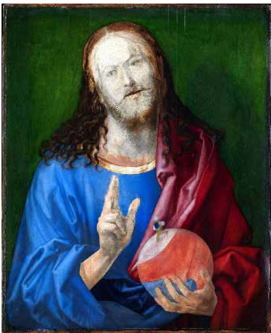
تصویر ۳: حضرت مسیح بانگشتش اشاره به خداوند یکتا مینماید، اثر آلبرشت دورر، متعلق به ۱۵۰۵ م. (ماخذ: URL:1).