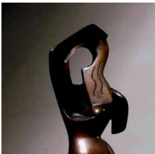
تصویر ۲۷: زنی موهایش را شانه می‌کند، قسمتی از اثر.

گاردنر، نویسنده کتاب «هنر در گذر زمان» درباره اثری از آرشیپینکو و گونزالس - که هر دو از یک موضوع واحد دو اثر متفاوت ساخته‌اند - چنین می‌نویسد: «هم‌چنان که در نقاشی