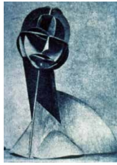
تصویر ۳۱: چهره، اثر ناوم گابو، مجسمه‌ساز روس، از مقوا، متعلق به ۱۹۱۵م.

سود جست‌وجوی خلع و یا به دیگر سخن، فضاهای توخالی و مُجوف، اشاره به ساده‌سازی‌هایی دارد که نمونه‌هایی از آن را به خوبی، می‌توان در آثار ناوم گابو، ۴۸ مجسمه‌ساز روسی، نظاره نمود (تصاویر ۳۱-۳۳). گابو و پوسنر، روش بنیادی را در بیانیه خویش چنین پی‌ریزی کرده‌اند: «حجم و فضا دو چیز قابل اندازه‌گیری‌اند. ما فضا را به عنوان یک عنصر نو و مطلقاً، تندیس‌وار بررسی می‌کنیم و به کار می‌گیریم که همچون جسمی مادی، واقعا، وارد ساختمان می‌شود» (همان: ۶۴۱). در ادامه این روند، مجسمه‌سازان دیگری پا به میدان نوآوری می‌گذارند- که بسیار جوان هستند- و در استفاده از فضاهای