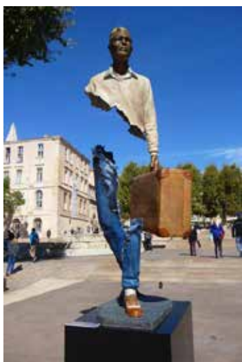
تصویر ۴۵: مردی با چمدان، اثر برونو کاتالانو، مجسمه ساز فرانسوی، متعلق به حدود ۲۰۱۲ م. (ماخذ: همان).