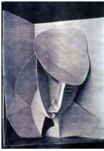
تصویر ۳۲: پرتره، اثر ناوم گابو، مجسمه‌ساز روس، از مقوا، متعلق به ۱۹۱۶م. (ماخذ: همان).