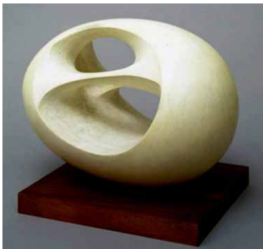
تصویر ۴۹: مجسمه بیضی، اثر باربارا هیپورث، هنرمند سنگ مرمر سفید، متعلق به ۱۹۴۳ م.

انسان بخشی از وجود خود را در زمان جای می‌گذارد (تصاویر ۴۴ و ۴۵).