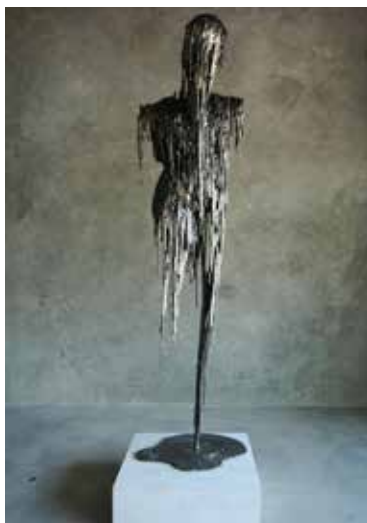
تصویر ۴۰: مرد معلول، اثر ساشا وینسی، هنرمند ایتالیایی، متعلق به حدود ۲۰۰۷م. (ماخذ: همان).