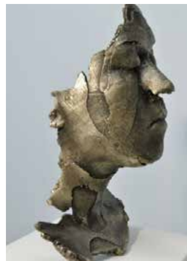
تصویر ۳۴: سر، به رنگ طلایی، اثر سوفی کان، مجسمه‌ساز استرالیایی، تندیس از مقوا، با به کارگیری اسکندر سه بعدی، متعلق به حدود ۲۰۱۲م..