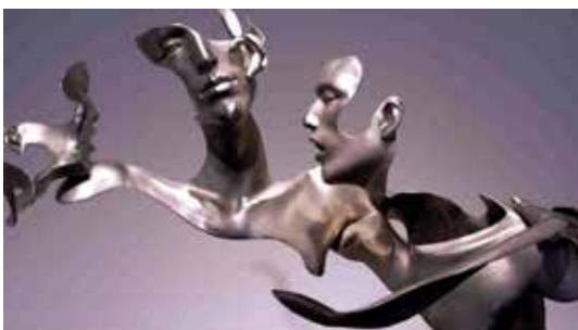
تصویر ۴۳: بی‌عنوان، اثر گروهی اونماسک، قسمتی از اثر، متعلق به حدود ۲۰۱۰م. (ماخذ: همان).

خالی و یا مجوف از آثار هنرمندان گذشته فراتر می‌روند؛ مانند آثار سوفی کان، ۴۹ تندیس‌ساز استرالیایی. او ضمن باقی ماندن در فضایی فیگوراتیو و مجسم نمودن نیم تنه انسان، بدون این که به شبیه‌سازی بهاد دهد، بخش قابل توجهی از سر انسان را نادیده می‌گیرد و تنها اجزای صورت را از روبه‌رو به نمایش