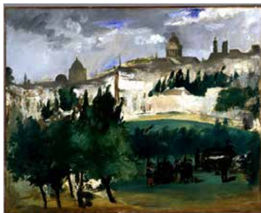
تصویر ۹: مراسم تدفین، اثر ناتمام ادوارد مانه، نقاش فرانسوی، رنگ روغن روی بوم، متعلق به ۱۸۶۷ م..