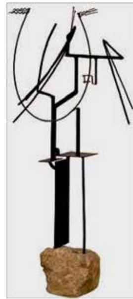
تصویر ۲۸: زنی موهایش را شانه می‌کند، اثر خولیو گونزالس، هنرمند اسپانیایی، از مفتول آهن، متعلق به ۱۹۳۰-۳۳ م. (ماخذ: همان).

درباره انتخاب همین موضوع توسط خولیو گونزالس نیز - که به جای سود جستن از پیکره‌ای فیگوراتیو، از اثری انتزاعی بهره می‌گیرد - چنین اظهار نظر می‌نماید: «خولیو گونزالس، دوست برانکوزی و پیکاسو ۴۴ در عرصه علاقه به امکانات هنری مصالح جدید و روش‌های نوین عاریتی از تکنولوژی صنعتی و فلزکاری سنتی با ایشان وجه مشترک دارد. شکل‌های ساخته شده ... از آهن جوشکاری شده یا آهن شمش و مفرغ، می‌توانند تأثیراتی ساده یا فوق‌العاده بغرنج به بار آورند که در آنها، عملاً، فضاهای تندیس‌وار به صورت نوعی شبکه مجوف در می‌آیند و احجام توپر، فقط نقش خطوط کناره‌نما، حدود، یا سطوح جدا کننده را پیدا می‌کنند. در پیکره زنی موهایش را شانه می‌کند اثر خولیو گونزالس، کافی است که آن را با پیکره‌ای از آرشیپینکو با همین موضوع مقایسه کنیم، هیچ یک از قراردادهای سنتی شبیه‌سازی، نتوانسته است مانع پرواز قدرت خیال‌پردازی هنرمند شود و روند اجرای کار نیز در دخالت روش‌های سخت‌گیرتر کنده‌کاری و قالب‌گیری از مسیر خود خارج نشده است ... هم چنین، لازم به ذکر است، گرچه وی در عرصه مصالح و روش، نوآوری می‌کند، هنوز، هم‌چنان - که از عنوان اثرش بر می‌آید - پیکره آدمی را یک نقطه عزیمت برای انتزاع می‌داند» (همان: ۶۳۹). با توجه به آنچه که در سطور بالا مطرح گردید، اگر نظری به هنر قبایل