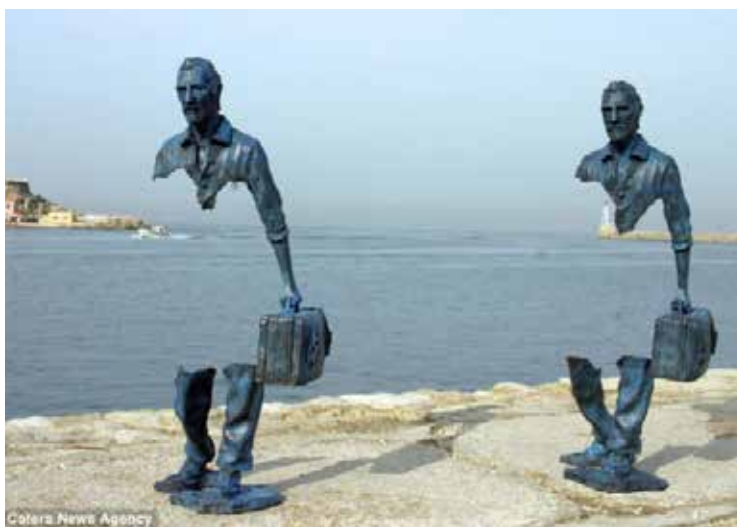
تصویر ۴۴: دو مرد در حال سفر با چمدان در کنار آب، ماری، اثر برونو کاتالانو، مجسمه‌ساز فرانسوی، متعلق به حدود ۲۰۱۲ م. (ماخذ: URL11).

نه از طریق حذف قسمتی از سر، بلکه از طریق سود جستن از دفرماسیون، سر پرسوناز را ارائه نموده، می‌توان به جان رد روستر، ۵۰ مجسمه‌ساز آمریکایی اشاره کرد. او با چرخشی که به سر و صورت داده، آن را از تکرار تناسب معمول به در آورده و این‌گونه نگرینستن به اثر، گویای رد قوانین زیبایی‌شناسی گذشته می‌باشد؛ که تناسب را ملاک اصلی زیبایی‌شناسی می‌دانستند (تصویر ۳۶). لیکن، اگر دوباره به چهره‌سازی‌های سوفی کان - که شرح آن گذشت - نگاهی انداخته‌شود، در صورت‌سازی خود برخلاف چهره‌سازی‌های جان رد روستر، تمامی اجزای چهره را بر طبق قوانین گذشته رعایت نموده است (تصاویر ۳۴-۳۶). در این جا، قابل ذکر است که مجسمه‌سازان نوگرا، تنها به چهره‌سازی و یا نیم تنه انسان نپرداخته‌اند، بلکه به کل اندام انسانی و حیوانی و حتی به شکل‌های هندسی و انتزاعی نیز توجهی خاص داشته‌اند؛ مانند آثاری از سوفی کان، به نام «مردی در بند» - که از به کارگیری نیم‌تنه فراتر می‌رود - و یا «زن خوابیده»، که کل بدن را مورد توجه قرار می‌دهد، هر چند که تمامی اجزای بدن را به کار نمی‌گیرد (تصاویر ۳۷ و ۳۸).