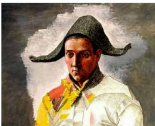
تصویر ۱۶: قسمتی از اثر.

باشد (تصویر ۱۷). هنری ماتیس ۲۰ نقاش فرانسوی نیز در مورد آرایش آثارش که به کمال می‌رسند و کمال را در خلق بیان می‌بیند، چنین اظهار نظر می‌نماید: «آنچه در پی‌اش هستیم، در درجه نخست بیان (اکسپرسیون) ۲۱ است... هر چیز، نقشی ایفا می‌کند. ترکیب‌بندی، هنر آراستن عناصر موجود در اختیار هنرمند، به طرز تزیینی برای بیان احساسات خویش است... هر آن چه در تابلو مفید نباشد، زیان‌آور است» (گاردنر، ۱۳۶۵: ۶۱۸). و یا در جایی دیگر می‌گوید: «بیان در روش تفکر من، عبارت از بازتاب انفعالات بازتابنده بر یک چهره و یا آشکار شده توسط حرکات و اشارات شدید