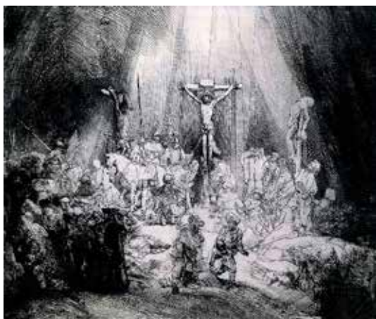
تصویر ۷: تثلیث، اثر رامبراند وان راین، نقاش و چاپگر هلندی، چاپ دستی (اچینگ و آکواتینت) متعلق به ۱۶۵۳ م..