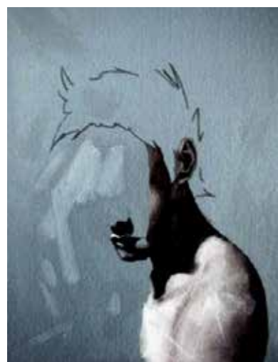
تصویر ۲۳: خود نگاره، اثر ادوار دواماتا، ایکازا، هنرمندی از کاستاریکا، رنگ روغن روی بوم، متعلق به ۲۰۱۰ م..