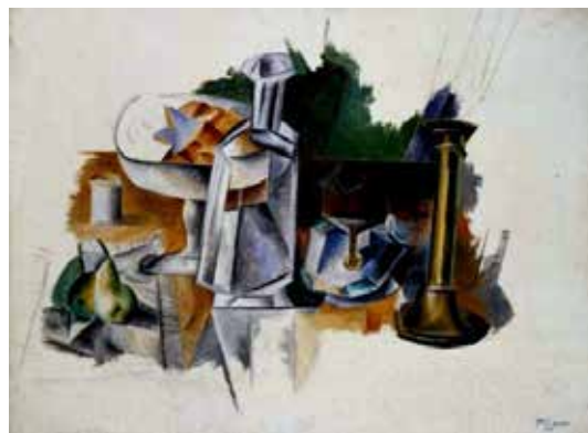
تصویر ۱۷: تنگ و شمعدان ناتمام، اثر پابلوپیکاسو، هنرمند اسپانیایی، رنگ روغن روی بوم، متعلق به ۱۹۰۹م. (ماخذ: URL4).