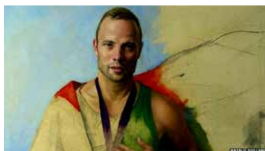
تصویر ۱۸: پرتره مرد جوان، اوسکار پیستوریوس، اثر ناتالی رادینا هولند، رنگ روغن روی بوم، متعلق به حدود ۲۰۱۳م..