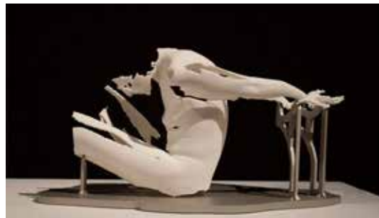
تصویر ۳۷: مردی در بند، اثر سوفی کان، مجسمه‌ای با تکنیک دیجیتال، متعلق به حدود ۲۰۱۵م. (ماخذ: URL10).