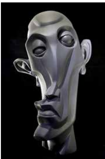
تصویر ۳۶: سری دفرمه شده، اثر ایکس‌دی روسترکس (جان رد روستر) مجسمه‌ساز آمریکایی، از برنز، متعلق به حدود ۲۰۱۲م. (ماخذ: همان).

آفریقایی متعلق به دوران گذشته و سنن و آداب و رسوم آنان انداخته شود، به خوبی، در ماسک‌های آنان ذهنیتی دیده می‌شود که بی‌تردید، نه تنها مسلط بر عینت قرار دارد، بلکه گویای خلاقیتی است که بر مبنای پرواز تخیل و تجسم و از این رهگذر با استفاده از دفرماسیون ۴۹ (تغییر دادن اشکال شبیه‌سازانه به اشکال خیال‌پردازانه) در ترکیب‌بندی چهره و بدن شکل گرفته است. مانند ماسک سفید پونو ۴۶ که متعلق به غرب آفریقا، کشور گابن ۴۷ است. رویکردی که در هنرهای ناتمام، به عنوان یکی از اصول ترکیب‌بندی به وضوح، دیده می‌شود (تصویر ۳۰). این گونه توجه به دفرماسیون و هم‌زمان