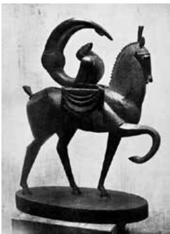
تصویر ۴۱: آکروبات در پشت اسب، اثر ژاک لیبشیتس، مجسمه‌ساز لهستانی آمریکایی تبار، متعلق به ۱۹۱۴م. (ماخذ: همان).