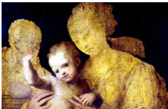
تصویر ۶: قسمتی از اثر که تا حدودی بزرگ‌نمایی شده است.