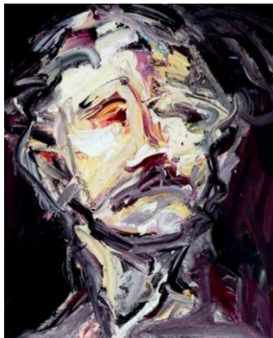
تصویر ۲۱: من خودم را در تو می‌بینم، اثر کرگ وادل، هنرمند معاصر آمریکایی، میکس تکنیک روی بوم، متعلق به حدود ۲۰۱۲ م..

هم‌زمان، آثاری را ارائه نمودند که حکایت از چنین رویکردی دارد؛ مانند اثری از نقاش معاصر آمریکایی به نام کرگ وادل. ۳۷ وی در اثر «من خود را در تو می‌بینم»، ضمن سود جستن از همسرش به عنوان مدل، زیر تلی از رنگ، چهره‌ای را ارائه می‌نماید که هر چند اعضای صورت، تاحدودی، نمایان است، لیکن، گویی که چشم، بینی، لب و گوش پرسوناژ از جادر رفته و حالتی ناکامل به خود گرفته است (تصویر ۲۱). او در اثر دیگری به نام «انسان بی‌صورت»، تمامی اجزای چهره را حذف می‌کند؛ که اثرش ظاهراً، حالتی ناکامل به خود می‌گیرد؛ لیکن، با توجه به موضوع و مضمون، اثری کامل و یا به عبارتی دیگر، به کمال رسیده می‌باشد (تصویر ۲۲).