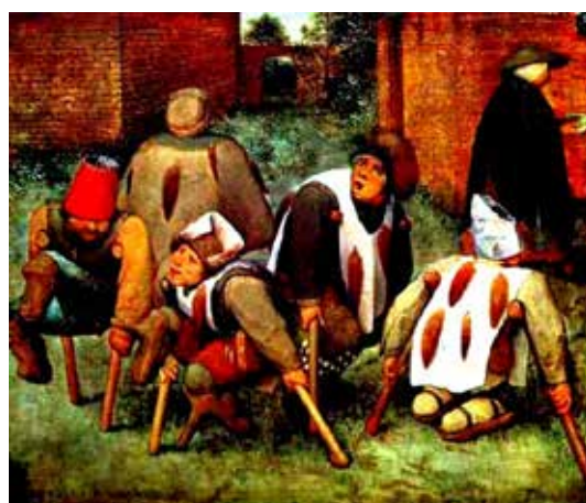
تصویر ۴۷: گدایان افلیج، اثر پیتر بروگل مهتر، نقاش هلندی، متعلق به ۱۵۶۸ م. (ماخذ: همان).

را خود در ذهنش تجسم می‌نماید و آن قوری و یا درخت را ناکامل نمی‌پندارد. از دیگر هنرمندان نوگرا، که سر انسان را