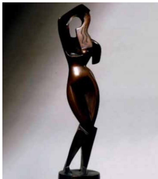
تصویر ۲۶: زنی موهایش را شانه می‌کند، اثر الکساندر آرشیپینکو، مجسمه‌ساز روسی، از برنز، متعلق به ۱۹۱۴-۱۵ م. (ماخذ: هارت، ۱۳۸۲: ۹۸۵).