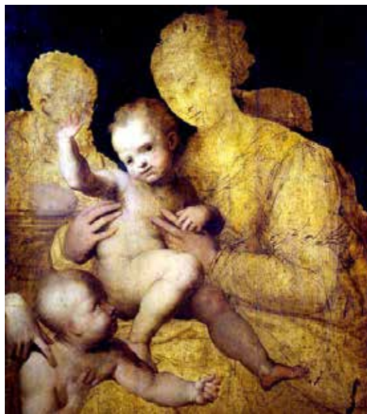
تصویر ۵: حضرت مریم و مسیح در کنار جان مقدس، اثر پرنودل واگا، نقاش ایتالیایی، قسمتی از اثر، متعلق به ۱۵۲۸ م..

همان گونه که قبلا، اشاره رفت در هنرهای تجسمی، به ویژه، در ترکیب بندی هنر نقاشی و تندیس سازی غرب، هنرمندان