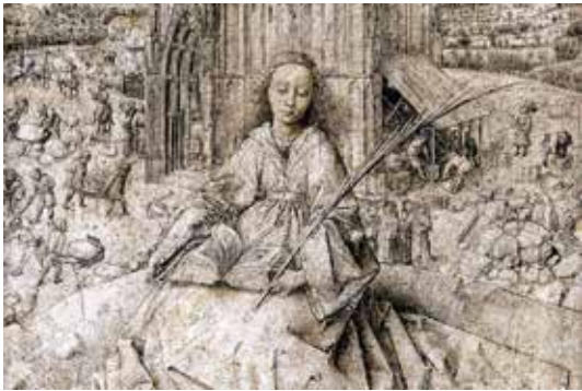
تصویر ۲: قسمتی از اثر که به صورت طراحی همچنان ناتمام باقی مانده است (ماخذ: همان).