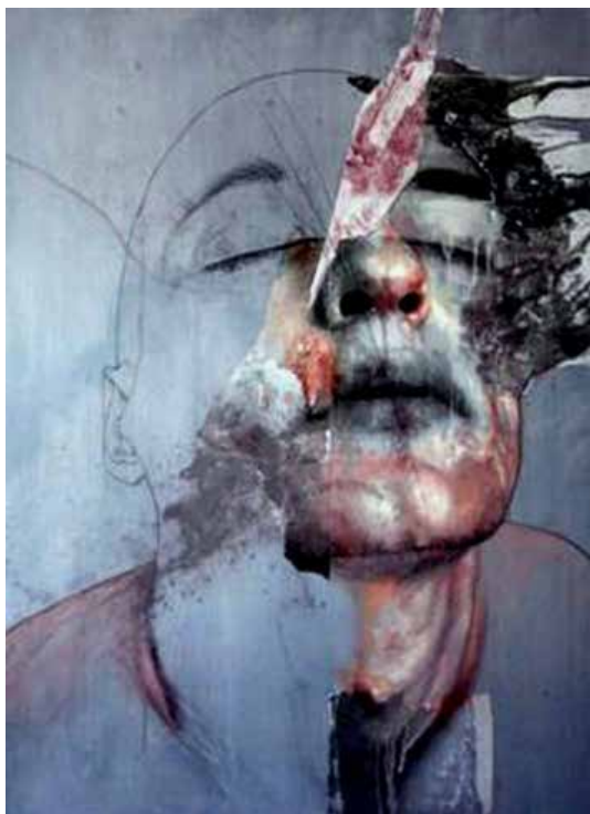
تصویر ۱۹: سر، اثر جسیکاریموندی، هنرمند ایتالیایی، طراحی بامداد، آکرلیک و رنگ روغن روی بوم، متعلق به ۱۹۰۹م..