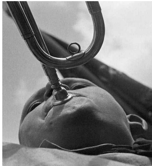
تصویر ۱۰. الکساندر رودچنکو، پیشاهنگ با شبیور، ۱۹۳۰ (ماخذ: کلارک، ۱۳۹۵: ۲۹۱).

عکاس نیز می‌تواند از قراردادهای متعارف عکاسی در گزینش موضوع و ترکیب‌بندی تا ویرایش عکس عدول نماید و از کارکردهای معمول عکس (ارجاعی، گزارشی، استنادی) فراتر رود و با زیرپا گذاشتن هدفمند و آگاهانه قواعد متداول و گذر از شگردهای تکراری، از سوزن‌های خویش تصویری جدید و متفاوت ارائه نماید و بدین شکل، از اشیای متعارف و معمولی آشنایی‌زدایی کند و به عکس خویش کیفیت و کارکردی متمایز و هنری ببخشد. از این جنبه، عکاس در عکس