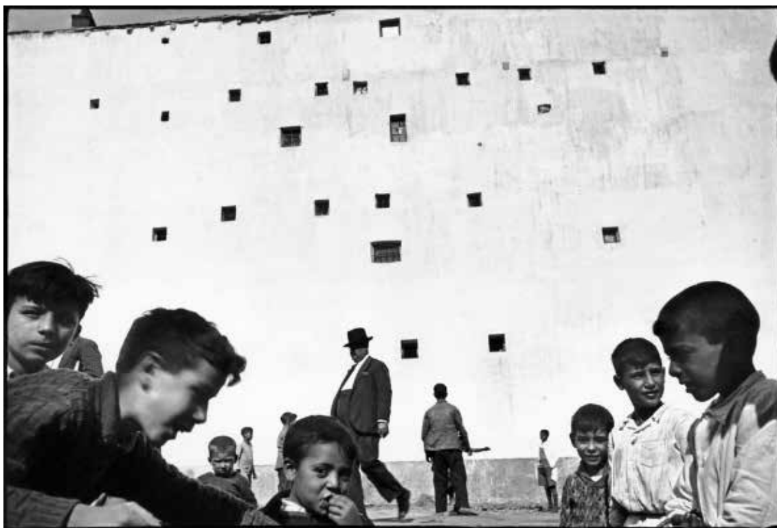
تصویر ۹. کارتیه برسون، مادرید، ۱۹۳۳.

است (ادواردز، ۱۳۹۳: ۱۳۴)؛ آنچه این انعکاس را به مثابه تصویر می‌نمایاند و می‌تواند به آن کیفیت هنری بدهد، در وهله اول قاب است. قاب مرزی است که یک واقعیت را از محیط جدا کرده و بدان هویت جدید می‌بخشد. هم‌چنین، از آن جاکه، محورهای عمودی و افقی در بازنمایی‌های تصویری، ابعاد و نقشی خنثی ندارند (چندلر، ۱۳۸۷: ۱۳۸)؛ قاب عمودی یا افقی، زاویه باز یا بسته یک عکس، هر کدام کیفیت و دلالت مختص خود را ایجاد می‌کنند و عکاس با انتخاب هر کدام می‌تواند به عکس خویش کار کرد و کیفیت متفاوتی ببخشد و به تولید عکس هنری نائل گردد؛ مانند عکس شماره ۸، که با انتخاب زاویه‌ای خاص (قرارگیری بوق با سر شخص) و قاب‌بندی جسورانه و برش بخشی از عناصر دنیای واقعی، عکسی آفریده که حس بصری و زیبایی‌شناسانه مخاطب را تحریک می‌نماید.