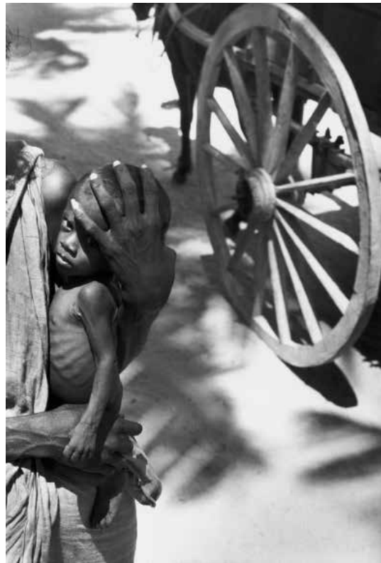
تصویر ۵. کار تیه برسون، هند.

همان طور که نویسندگان و شاعران برخلاف مردم عادی از امکانات دم‌دستی و رایج زبانی استفاده نمی‌کنند و به جای آن به گزینش واژه‌ها دست می‌زنند و توانمندی‌های زبان را بسط و گسترش می‌دهند و به ابداع و خلاقیت در ظرفیت‌های بالقوه زبان می‌پردازند و از این طریق، متون ادبی را خلق می‌نمایند؛ عکس هنری نیز نشان‌دهنده آن است که عکاس، در استفاده از ظرفیت‌ها و امکانات فنی و بیانی عکاسی، با گزینشی آگاهانه و هدفمند، ابداع و خلاقیت به خرج داده است و از درِیچه دوربین خود، جلوه‌ای متفاوت و بدیع از دنیای بیرونی و عناصرش به تصویر کشیده است. در این زمینه، حتی عنصری به ظاهر ساده یعنی قاب و زاویه دید، نقش مهمی در تولید عکس دارد. مانند عکس شماره ۶، که عکاس، به واسطه قاب بسته و ثبت سوژه در لحظه‌ای خاص، تصویری دقیق و ساخته و پرداخته، خلق کرده است. عکس از کارکرد معمول و مستند گونه فراتر رفته و به اثری ماندگار تبدیل شده است و آن را در زمینه تصاویر کهن مادر و کودک (مریم مقدس و کودک) قرار داده است. دیدن عکسی دیگر از همین سوژه که بیش‌تر کارکرد گزارشی و مستند از وضعیت زندگی مادر و فرزندانش دارد، کیفیت هنری این عکس را بیش‌تر آشکار می‌سازد (تصویر ۷). به هر صورت، حتی اگر عکس را انعکاسی بدانیم از واقعیتی که در زمان ثابت و متوقف شده