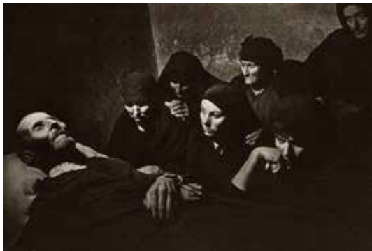
تصویر ۲. یوجین اسمیت، مرگ پدر خانواده، دهکده اسپانیایی (ماخذ: لاینز، ۱۳۸۸: ۱۱۴).

برقرار است» (Sontag, 2005: 78). هم‌چنین، از نظر او عکاسی کشف و تشخیص هم‌زمان اهمیت رویدادی در کسری از ثانیه و همین‌طور کشف اهمیت ساختمان دقیق فرم‌هاست (لاینز، ۱۳۸۸: ۹۴). بر اساس چنین نگرشی، در برخی عکس‌های برسون با ترکیب‌های دل‌نشین و لحظه‌ای از اتفاقات و رویدادهای معمولی خیابان روبرو می‌شویم که توسط او قاب‌بندی شده‌اند. به‌طوری‌که، می‌توان گفت «عکس‌های کارتیه برسون بیش‌تر به لحاظ زیبایی‌شان توسط عکاسان دیگر ستوده می‌شوند. آن‌ها دارای جذبه تعادل و تناسب، شگفتی، سادگی و ایجاز، کشش و ظرافت بصری‌اند» (سار کوفسکی، ۱۳۹۳: ۱۹۴) (تصویر ۱، ۵ و ۹). اما عکاس دیگری چون یوجین اسمیت، ۲ عکاسی را رسانه قدرتمندی برای بیان حالات می‌دانست و هدف اصلی‌اش استفاده از عکاسی به‌عنوان ابزار ادبی و به‌طور ویژه، داستان‌های حماسی بود (جی و هورن، ۱۳۸۸: ۵۹). بر مبنای