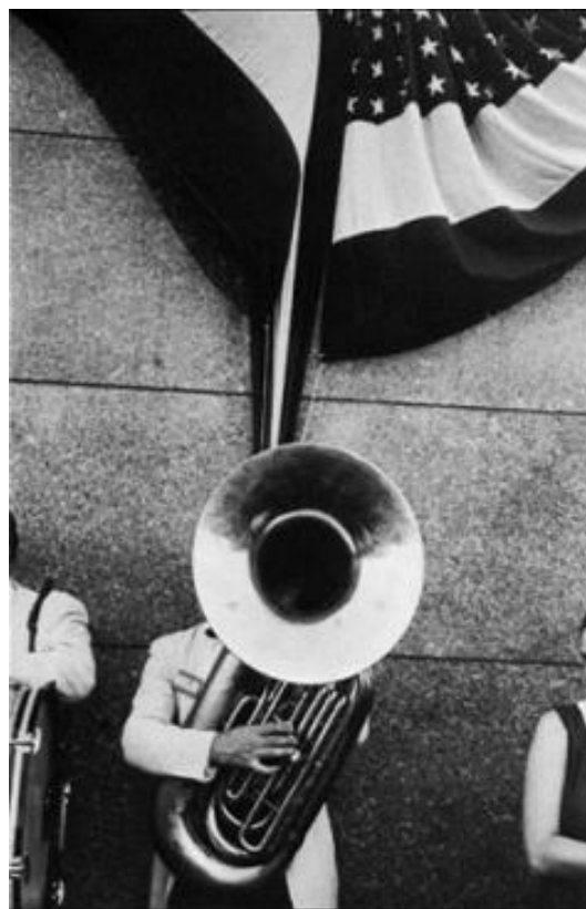
تصویر ۸. رابرت فرانگ، تظاهرات خیابانی، ۱۹۵۶ (ماخذ: مقیم نژاد، ۱۳۹۳: ۲۴۵).

از دیگر سو، اگر متن ادبی با گزینش و ترکیب واژه‌هایی -که ظاهراً، هیچ ارتباطی با هم ندارند- ساخته می‌شود؛ عکس هنری نیز از گزینش و ترکیب برخی عناصر و اشیاء و رویدادهای بی‌ربط تولید می‌شود؛ مانند عکس شماره ۸، که