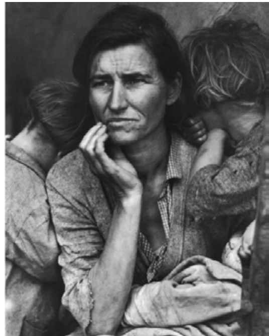
تصویر ۶. دور تیا لانگ، مادر مهاجر، ۱۹۳۶.

اسب‌گاری را نگه می‌دارد تا زمین نیافتد و بودنش کارا باشد؛ تا به کناری گذاشته نشود و گاری وجود اسب را مفید می‌کند برای صاحبش که روشن است صاحب آن مادر و فرزندش