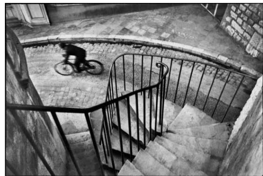
تصویر ۱. کارتیه برسون، فرانس، ۱۹۳۲ (ماخذ: بلاف، ۱۳۷۵: ۵۷).

در واقع، شاعری که فکر تازه دارد، کلمات تازه و تلفیقات تازه هم دارد و هر کس به اندازه فکر خود کلمه دارد و در پی کلمه می‌گردد (یوشیج، ۱۳۹۷: ۱۰۹-۱۱۰). از این جنبه، اگر عکاسی هنری را به‌مثابه حدیث نفس بنگریم (ادواردز، ۱۳۹۳: ۵۰)، عکاس بر مبنای نگرش خاص خویش به موضوعات گوناگون و بنا به اقتضات و الزامات شاخه‌ای که در آن عکاسی