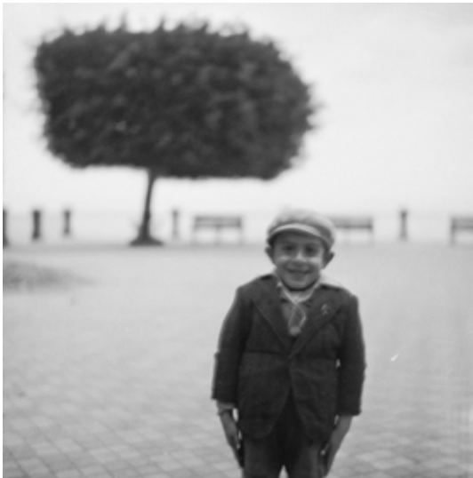
تصویر ۱۲. ریچارد اودون، پسر و درخت، ایتالیا، ۱۹۴۷ (ماخذ: کو، ۱۳۷۹: ۳۲۶).

زبان ادب شاهد درهم‌ریختگی سنجیده گفتار متداول هستیم (ایگلتون، ۱۳۷۲: ۶)، در عکس هنری نیز چنین امری با قاب‌گذاری، زاویه و لنز انتخابی، ترکیب‌بندی غیرمعمول و اعمال تغییرات مربوط به ویرایش عکس رخ می‌دهد؛ که مخاطب، مانند مخاطب متن ادبی با عناصری ناآشنا، غیرمعمول و برجسته روبه‌رو می‌شود؛ مانند عکس پیشاهنگ با شیپور که عکاس، به واسطه زاویه غیرمعمول و قاب و ترکیب‌بندی خاص به هنجارگریزی دست زده است؛ به طوری که حالت سوژه به دلیل زاویه تحریف‌شده، برجسته شده است. پرسپکتیو اشیا، به همان اندازه غیرمعمول، افراطی و چالش‌برانگیز است. اعوجاج زاویه دید، به معنا و رویکرد افراطی این عکس می‌افزاید (کلارک، ۱۳۹۵: ۲۹۱). عکاس از یک سوژه معمولی، عکسی جذاب و مبهم آفریده است (تصویر ۱۰).