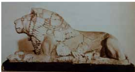
تصویر ۳: مجسمه شیرمینا کاری شده معبد کومپوم کیدویا قرن ۱۲ قبل از میلاد، طول ۱,۳۶ متر.

بال بر روی بدن انسان یا حیوان، علامت ایزدی و نماد قدرت محافظت است. بال نیز هنگامی که مربوط به پیام‌آوران،