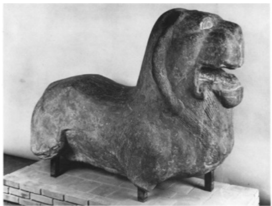
تصویر ۲۶: شیرسنگی، هان شرقی موزه گویمت در پاریس.

از دوره هان یافت شده است که به سبک دیگری ساخته شده اند (تصویر ۲۸). در پشت گردن کلفت آن ها خطوط پیچشی دندان داری وجود دارد که نشان دهنده یال انبوهشان است (Till, 2014: 262).