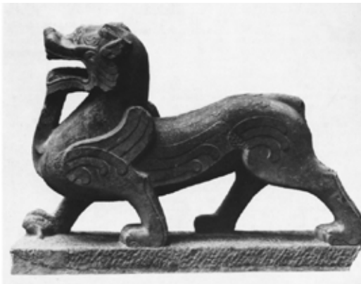
تصویر ۳۵: سرچیمرای سنگی، هان شرقی، گالری نلسون موزه آتکین، کانزاس سیتی.