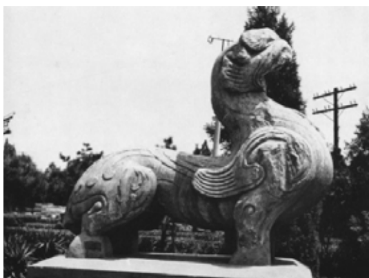
تصویر ۳۱: چیمرای سنگی، هان شرقی، نانیانگ، هونان (ماخذ: ibid).