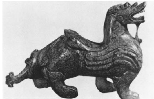
تصویر ۲۲: جانور بال دار برنزی، معبد شاه چانگ شان، دوره حکومت های متخاصم.