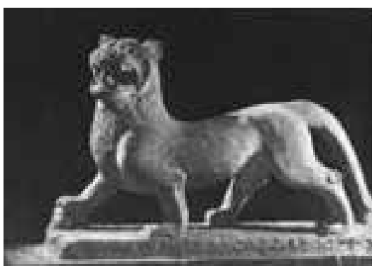
تصویر ۲۹: شیر سنگی، هان شرقی موزه ایالتی شانسی، شیان.

به بررسی پیکره‌های چیمرا در هنر چین باستان پرداخته می‌شود. شیرهای بال‌داری که آنها را چیمرامی نامند در دوره هان شرقی برای مجسم کردن قدرت ماندگار در مجسمه‌های مقابر آن دوران به عنوان موضوعی متداول رواج داشته. چیمراها چیزی میان شیرواژدها هستند. بنابراین، وابستگی نزدیکی با شیرهای سنگی ذکر شده دارند. «چیمراهای هان