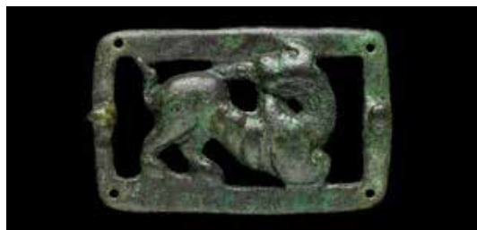
تصویر ۱۸: سگک کمر بند مسی با نقش شیر بال دار، هخامنشیان قرن ۴ یا ۵ قبل از میلاد، اندازه ۴*۳٫۵ سانتی متر، موزه بریتانیا.

قطعاً می توان گفت که هیچ نشانه ای از بومی بودن شیر در متون اولیه چین، اکتشافات باستانشناسی دوره چین ۷ پیشین و نقوش اولیه چین یافت نشده است. از آنجا که شیرهای آسیایی یال هایی کوتاه تر از شیرهای آفریقایی دارند، تشخیص آنها از دیگر گربه سانان در نقوش به جامانده سخت است. برخلاف پلنگ - که شواهد وجود آن در تمام مناطق باستان شناسی، تاریخ هنر و کتیبه های به جامانده در چین وجود دارد - شیر به جز در منطقه ای کوچک در شمال هند وجود نداشته است (Behr, 2004: 5).