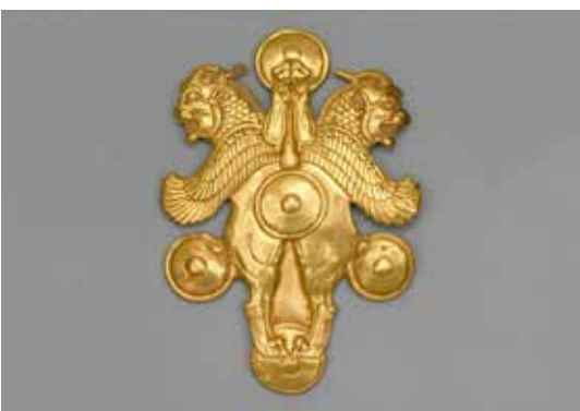
تصویر ۱۷: پلاک طلا با نقش شیر گریفین شاخ دار هخامنشیان قرن ۴ یا ۵ قبل از میلاد، اندازه ۱۳٫۶*۹٫۸ سانتی متر، موزه متروپلیتن (ماخذ: URL1).

بخش، جامی قیف مانند و بدنه شیربال دار تشکیل شده است (تصویر ۱۳). جام با شیرهای افقی و گل لوتوس و نخل و پیچکی تزئین شده که در جلوی بدنه به یک شیربال دار متصل می شوند. شیر به صورت نشسته با دست های به جلو و بال های شیرداری در دو طرف ساخته شده است. دهن شیر، باز و دندان ها و زبان او قابل مشاهده است. پنجه های شیر به سمت جلو قرار دارد. بال ها توخالی و از دو ورقه زرین به هم لحیم شده، ساخته شده اند؛ بال ها دارای دو ردیف پرهای ریز ظریف و سه ردیف پرهای بلند هلالی هستند. در دهان باز شده شیر، زبان نصب شده و در پشت آن سوراخ آب ریز وجود دارد که دیده نمی شود. «این حیوان بنا بر سنت های قدیمی مجسم گردیده است. چین گونه و بینی و گوش های گرد با زینتی شبیه به دندان ها گردن و سینه با