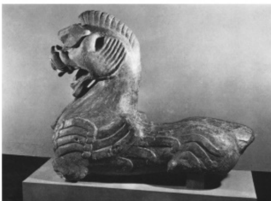
تصویر ۳۷: سرچیمرای سنگی، هان شرقی، موزه شرق دورباستان، استکهلم (ماخذ: ibid).

مربوط به دوره هان شرقی است (تصویر ۳۱): (Till, 2014: 263).