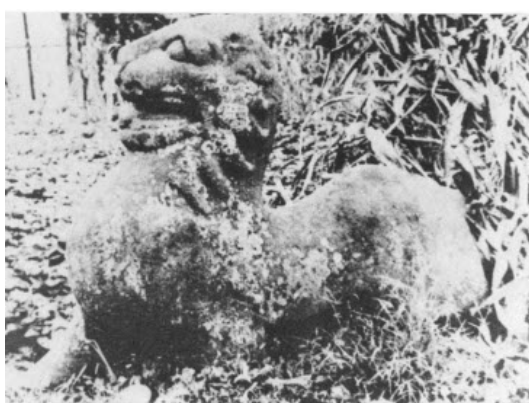
تصویر ۲۸: شیر سنگی، هان شرقی ایالت لوشان در منطقه سیچوان.