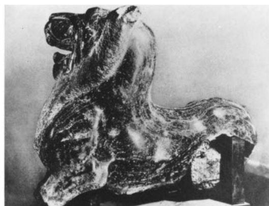
تصویر ۲۷: شیر سنگی، هان شرقی موزه گویمت در پاریس (ماخذ: Till, 2014: 269).