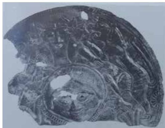
تصویر ۵: قطعه ای از صفحه مفرغی کنده کاری، لرستان، سرخ دم، ۸۰۰ ق. م. ۱۵۰ سانتی متر.