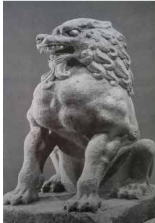
تصویر ۳۸: شیر پاسدار بازمانده از دودمان سوی یا اوایل دوره تانگ در ۶۰۰ میلادی، موزه هنرهای کلیولند اوهایو (ماخذ: Christie, 1996: 133).

نقش شیر در باورها، اعتقادات و اسطوره‌ها ریشه دارد و در قرون متمادی و براساس پیشینه تاریخی در هنر ایران تکرار شده است. شیربال دار از انگاره‌های مهم در اندیشه و هنر خاور باستان به حساب می‌آید. از آن جا که این سرزمین‌ها، زیستگاه این حیوان اسطوره‌ای بوده با زندگی و هنر مردمانش عجین شده و به یکی از مفاهیم اسطوره‌ای بدل گشته است. این نقش در قرون متمادی و براساس پیشینه‌ای تاریخی در هنر ایران تکرار شده است. یکی از مفاهیم اصلی شیربال دار نگهبانی از مقابر و معابد و دور کردن نیروهای شر و ارواح از این اماکن است. استفاده از پیکره‌ها و نقش برجسته این نماد برای بهره‌گیری از نیرو و قدرت شیراز دوره عیلام رواج داشته و در تمدن‌های بین‌النهرین و ایران نیز گسترش یافته است. برقراری ارتباط میان ایران و چین از قرن دوم قبل از میلاد و اهدا این جانور به درباران در چین توسط اشکانیان زمینه ورود این نماد را به هنر این تمدن گشود. یکی از مهم‌ترین کاربردهای این نقش در هنر