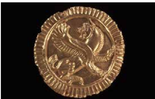
تصویر ۱۵: تزئین لباس طلایی با نقش برجسته شیر، گنجینه جیحون، هخامنشیان قرن ۴ یا ۵ قبل از میلاد یافته شده در تاجیکستان تخت قباد در نزدیکی رود جیحون، اندازه قطر ۴٫۷۵ سانتی متر موزه بریتانیا.