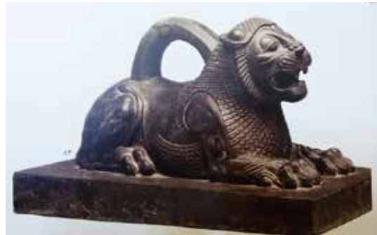
تصویر ۴: وزنه مفرغی. وزن ۱۲۱ کیلوگرم، طول ۶۳ سانتی متر، ارتفاع ۳۰ سانتی متر.

یکی از تصاویر مربوط به شیربال دار در ایران، نقش شیر