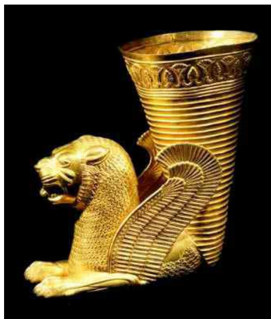
تصویر ۱۳: جام طلای عهد هخامنشی مکشوفه از همدان، ارتفاع ۲۹/۹ و عرض ۱۹ سانتی متر، وزن ۱۹۳ گرم موزه ایران باستان (ماخذ: گیرشمن، ۱۳۴۶: ۲۴۲).