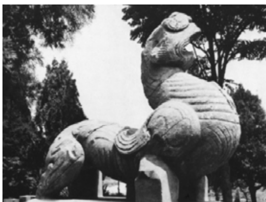
تصویر ۳: چیمرای سنگی، هان شرقی، مقبره تسونگ تزو، ۱۶۷ م. نانیانگ، هونان.