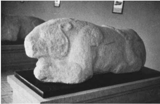
تصویر ۲۴: بیرسنگی، مقبره ژنرال هو چوپینگ Ho Chu-ping، ۱۱۷۰ ق.م. سیان Sian، ایالت شانسی Shensi..