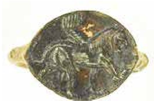
تصویر ۲۰: انگشتر، پارتیان خاور میانه اندازه طول ۱۴ میلی متر عرض ۲۴ میلی متر انگشتر برنزی با نقش شیر بال دار موزه بریتانیا (ماخذ: URL1).

زینتی مانند فلس ماهی، یال با قطعات مثلث شکل و نوک برگشته که تا ابتدای کمر حیوان ادامه می یابد» (گیرشمن، ۱۳۴۶: ۲۵۲).