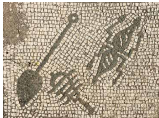
تصویر ۱: موزاییک فلیسی سیموس در استیا مرتبه شیر در آیین میترا ایسم (ماخذ: مقدم، ۱۳۸۰: ۱۹۹).

«شیر از سوئی، نشان قدرت، حرارت و سوزندگی و از سوئی دیگر، نماد پاکی، دلیری و آمادگی برای جان بازی های آرمانی است. در مهرابه ها، شیرمردان دست های میترا به