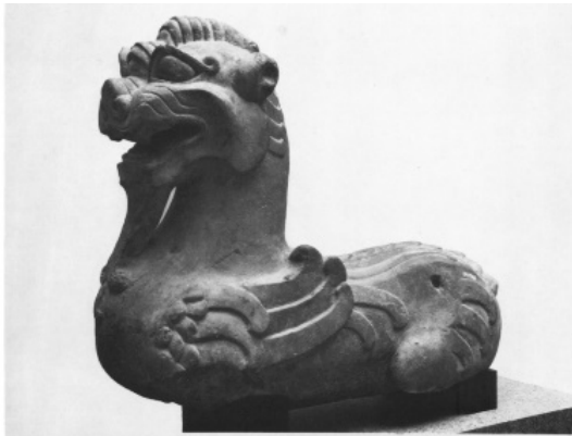
تصویر ۳۶: سرچیمرای سنگی، هان شرقی، موزه هنرآسیا، سان فرانسیسکو (ماخذ: Till, 2014: 276).