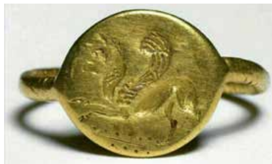
تصویر ۱۲: حلقه انگشتر از جنس طلا با نقش شیربال دار مربوط به گنجینه آمودریا قرن ۵ قبل از میلاد، موزه بریتانیا (ماخذ: URL1).