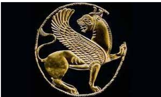
تصویر ۱۴: تزئین طلایی روی پارچه به شکل شیربال دار و شاخ دار احتمالاً از همدان (اکیاتان) قرن ۴ ق. م. موزه موسسه شرقی شیکاگو (ماخذ: پرادا، ۱۳۸۳: ۲۴۸).