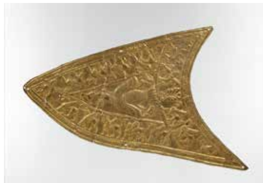
تصویر ۸: پلاک زرین با نقش پرنده شکاری و حیوانات بال دار، عصر آهن ۳، قرن ۷ یا ۸ پیش از میلاد، اندازه ۱۳*۲۲٫۵ سانتی متر، یافته شده در زیویه شمال غرب ایران، موزه متروپولیتن (ماخذ: URL4).