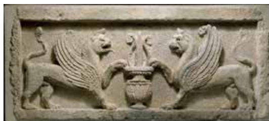
تصویر ۱۹: لوح سنگی، سردر ورودی، با نقش دو شیرو گلدانی حاوی برگ گل نیلوفر در میان، هنر اشکانی، حدود قرن دوم پیش از میلاد تا قرن دوم پس از میلاد، موزه متروپلیتن (ماخذ: URL4).