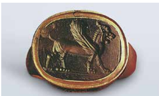
تصویر ۱۱: انگشتر از جنس عقیق با نقش شیر بال دار، قرن ۴ یا ۵ قبل از میلاد، اندازه ۱٫۴*۱٫۸ سانتی متر، موزه آرمیتاژ (ماخذ: URL2).