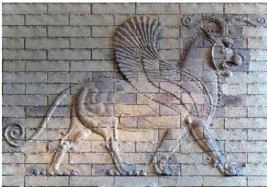
تصویر ۱۰: شوش شیرافسانه‌ای (قرن ۵ ق. م.) موزه لوور (ماخذ: گیرشمن، ۱۳۴۶: ۱۴۲).