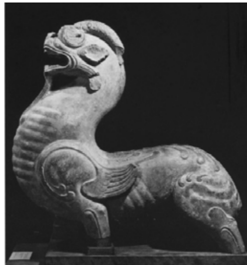
تصویر ۳۳: چیمرای سنگی، هان شرقی، گالری هنرآبرایت کنوکس.