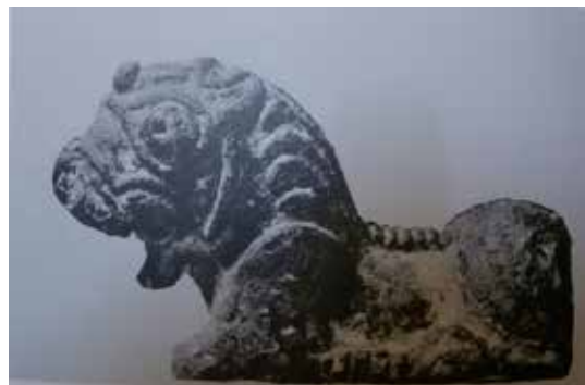
تصویر ۶: شیر مفرغی ریختگی، شمال غرب ایران، هزاره دوم ق. م. طول ۱۷ سانتی متر (همان: ۳۱).

خدایان و بادها می شود، علامت سرعت و تندمی باشد و ممکن است که حکایت از گذر سریع عمر داشته باشد. حیوانات بال دار نیز نتیجه اختلاط ویژگی های خدایان مختلف است (هال، ۱۳۸۰: ۳۶۰). بال ها در حال تصعید به نشانه آزادی و پیروزی قرار دارند. بال ها به قهرمانانی وصل می شوند که غول ها، حیوانات فریب کار، سبع (جانور درنده) یا نفرت انگیز را می کشند (شوالیه و گربران، ۱۳۷۸: ۶۰).