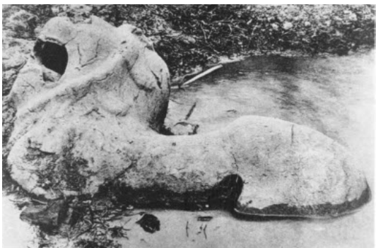
تصویر ۲۵: شیرسنگی متعلق به خاندان وو و ۱۴۷ ب.م ایالت چیا هسینگ Chia- hsiang، شاندونگ Shandong. (ماخذ: ibid).