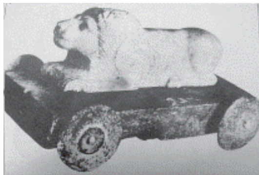
تصویر ۲: پیکره شیر کوچک سنگی در مجاورت معبد اینشوشیناک ارگ شوش (ماخذ: مجیدزاده، ۱۳۷۰: ۶۸).