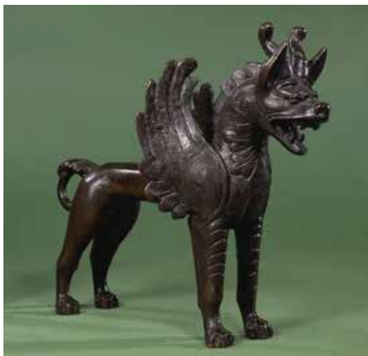
تصویر ۲۱: کوشان، پارتیان، قرن اول تا دوم میلادی یافته شده در افغانستان رود هیرمند اندازه ۲۴٫۹ سانتی متر ارتفاع ۳۲ سانتی متر طول ۱۲٫۵ سانتی متر ضخامت موزه بریتانیا.

نقش برجسته، شامل دو موجود فوق العاده با بدن گربه سانان، گوش های بلند، بال و یال پَرمانند است که ترکیبی از حیوان و عناصر پرنده است و نمونه ای از شیرهای گریفین خاور نزدیک هستند. تقارن مطلق ترکیب بندی، ساده سازی فرم های گیاهی و موتیف شیر گریفین از ویژگی های هنر خاور نزدیک است. این نقش در بسیاری از اشیای یافته شده متعلق به دوره اشکانیان دیده شده است (تصویر ۲۰).