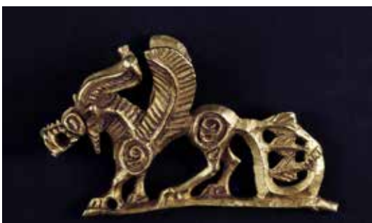
تصویر ۱۶: گریفین ایران قرن ۴ قبل از میلاد یافته شده در سیبری ارتفاع ۵٫۲ سانتی متر موزه ارمیتاژ.