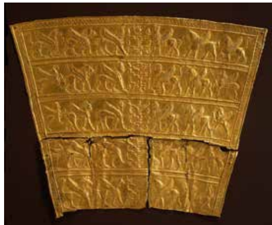
تصویر ۷: لوحه زرین با نقش حیوانات بال دار در حال نزدیک شدن به درخت نمادین، عصر آهن ۳، قرن ۷ یا ۸ پیش از میلاد، اندازه ۱۱٫۶۱*۹٫۶۸ سانتی متر، یافته شده در زیویه شمال غرب ایران، موزه متروپولیتن.