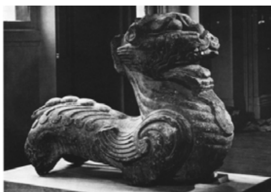
تصویر ۳۲: چیمرای سنگی، هان شرقی، موزه گویمت پاریس.