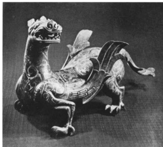
تصویر ۲۳: جانور بال دار از جنس جید، موزه ملی قصر، تایپه، تایوان، دوره هان (ماخذ: ibid).