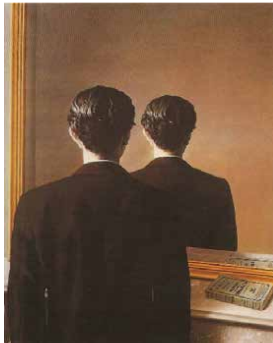
تصویر ۲: عنوان اثر: تولید مثل نمی شود، ۱۹۳۷ م.، رنه مگریت.