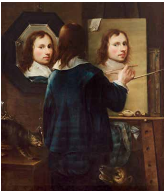
تصویر ۴: عنوان اثر: خودانگاره، ۱۶۴۴ م.، یوهانس گامپ.

که هنرمند آرزویش را دارد و یا به دلایل مختلف بخواهد به مثابه تشبیه یا استعاره آن ویژگی‌ها را نشان دهد و خود را با لباس مبدل یا گریم و آرایش شبیه به هرکسی دیگر بنمایاند. به این ترتیب، چهره نیز می‌تواند نقابی دیگر یا خودی دیگر را افشا کند که به هردلیلی معمولاً، مستور است یا به صراحت آشکار نیست.