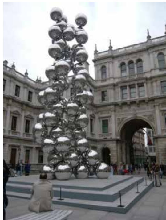
تصویر ۹: عنوان اثر، درخت بلند و چشم‌ها، ۲۰۰۹ م. آنیش کاپور.

در حقیقت، در این اثر، هنرمند با تجزیه فرم تصاویر و انعکاس اشکال پیرامون در حجم‌های آینه‌ای سبب شده است، تا تصاویر منعکس شده، هر کدام شکل ساده شده‌ای از یک جنبه موضوع را بر سطح گسترده خود نشان دهند و در آن