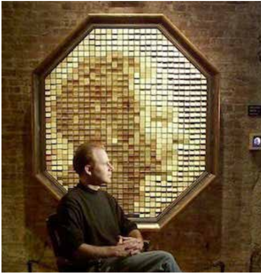
تصویر ۱: عنوان اثر: آینه‌های چوبی، ۱۹۹۹ م.، دنیل روزین.

طبق نظر دریدا در نقد ادبی: «کلیه اشکال نوشتار را باید وجهی از بازی حضور و غیاب به شمار آورد. در چنین صورتی است که می‌توان ذهن را متنی در نظر گرفت و بنابراین، بازی حضور و غیاب همان‌گونه که خود آگاهی و ناخود آگاهی را می‌توان به آن نسبت داد، قابل اعمال است» (ضیمران، ۱۳۹۲: ۲۵۳). در حقیقت، خود آگاهی با ساحت حضور پیوند دارد و ناخود آگاهی با ساحت غیاب؛ بنابراین، تجربه خود آگاه در حضور است که تحقق می‌یابد؛ حال آن‌که، تجربه ناخود آگاه طیف گسترده‌ای است که از گذشته به حال و آینده سرایت می‌کند. در واقع، ناخود آگاه از مرز زمان می‌گذرد. آن‌چه در مورد نظریه دریدا در این‌گونه از هنرهای تعاملی قابل تعمیم است، آن است که، حضور مولف به واسطه دال‌های موجود در اثر هنری با درگیر شدن با ناخود آگاه مخاطب منجر به تولید معنا می‌شود که البته، نسبت به هر مخاطب معنایی جدید متبادر می‌شود. در این آثار، مولف از باور ناخود آگاه و حضور مخاطب در تعامل با اثر هنری بهره جسته و به واسطه معنائی متنی - که اثر هنری به مخاطب منتقل می‌کند - ایده‌ها، عواطف و احساسات خود را به شیوه‌ای نامحسوس به مخاطب انتقال می‌دهد. بر این اساس، از سویی، می‌توان گفت نظریه دریدا - که می‌گوید در زمان نوشتن، خواننده غایب است و در زمان خواندن نویسنده - در این جا تعمیم پذیر می‌باشد. از سویی دیگر، آن‌چه او برای نقش و کارکرد پویای دال و مدلول قایل است، یعنی معانی مدلول‌ها، اموری ثابت و غیر قابل تغییر نیستند؛