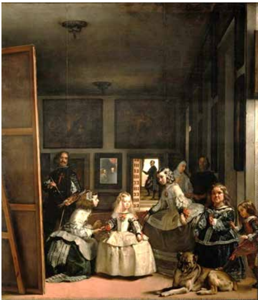
تصویر ۳: عنوان اثر: ندیمه‌ها، ۱۶۵۶ م.، دیگو والاسکوئز.