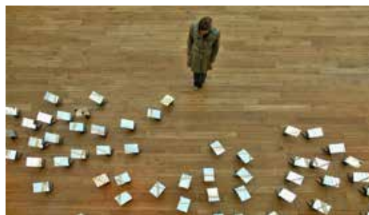
تصویر ۸: عنوان اثر: ماسک، ۲۰۰۸ م.، فوردی پویگ.

اتفاق می‌افتد، اما پیام مولف جریان خوانش متن را تحت تاثیر قرار می‌دهد.