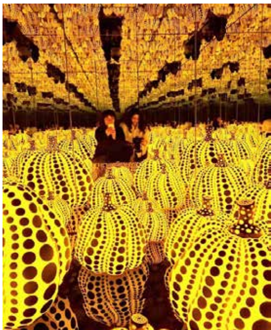
تصویر ۶: تمام عشق ابدی من برای کدو تنبل ها، ۲۰۱۷ م.، یایویی کوساما.

در واقع، آفرینشی دیگر از اثر هنری ایجاد کنند که نه تنها باعث اعتلای اثر باشد، بلکه خود به تنهایی تعریفی جدید از اثر را بازنمایاند. بدین ترتیب، نقد از یک سو ساختار و عملکرد قوانین ادبی و هنری در اثر را آشکار و تفسیر می‌کند و از سوی دیگر، آیین‌هایی تازه و نورا-که در آن مستتر است- کشف و نمایان می‌سازد. نقد نو، هیچ‌گاه مکتب منسجمی نبوده است. اصحاب مکتب نقد جدید برای این عقیده بودند که، وحدت یک متن در ساختار آن است و نه در قصد مولف؛ اما این وحدت قایم به ذات، پیوندهای پنهانی نیز با مولف دارد (وارد، ۱۳۸۴: ۲۸۶). نقد نو مانند ساختارگرایی معتقد است معنا را ساختار متن تعیین می‌کند و نه نویسنده. دیدگاه نقد نو با کنار گذاشتن نویسنده و نیت او و تمرکز بر متن (اثر هنری) راه را برای طرح نظریه مرگ مولف رولان بارت بازکرد. نقد نو هم مانند واسازی برای باور است، هیچ چیز بیرون از متن وجود ندارد؛ اما ادعای نقد نو مبتنی بر این نظر است که متن منبع معنا است. بر این اساس، فهم و تفسیر ما از یک متن یک سرخصوصی و دل‌بخواه نیست. هر تفسیر به سنتی تعلق دارد و بخشی است از یک تاریخ؛ و از این رو، درستی و نادرستی آن به معنای وسیع واژه، پایه عینی دارد؛ و این به‌طور کلی در تقابل با نظریات پس‌ساخت‌گرایان و اندیشه ساخت‌گرایانه است. زیرا وجود ساختار هسته‌ای و نهفته را به عنوان مبنای معنا نفی می‌کند. از نظر