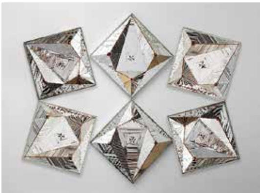
تصویر ۱: عنوان اثر: اردیبهشت، ۲۰۱۵ م. منیر فرمانفرمایان.

امروزه کاربرد دانش آینه‌ها بسیار بیش‌تر از کاربردهای نخستین و بازنمایی آن‌ها در گذشته است. البته، ناگفته نماند در این میان، دنیای هنر نیز از این پیچیدگی و رموز بی‌بهره نبوده و آن‌گونه که هنر در بستر خود گستره‌ای از علوم روان‌شناسی و اخلاق و سیاست و تکنولوژی و... را جای داده، آینه نیز چون همزادی اسرارآمیز هنر را در پیچ و تاب زیبایی پنهان و خاص خود باز نمود کرده است و در هر قوم و فرهنگی معنا و مفهوم ویژه‌ای برای خود پیدا کرده است. چنان‌چه در هنر سنتی و اسلامی، یکی از ارکان مهم معماری است.