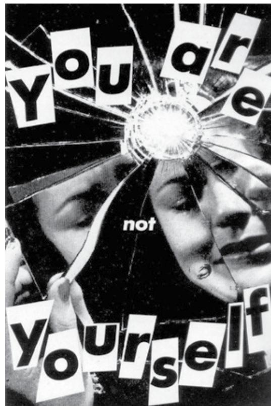
تصویر ۵: عنوان اثر: تو خودت نیستی، ۱۹۸۱ م.، باربارا گروگر.

در واقع، آفرینشی دیگر از اثر هنری ایجاد کنند که نه تنها باعث اعتلای اثر باشد، بلکه خود به تنهایی تعریفی جدید از اثر را بازنمایاند. بدین ترتیب، نقد از یک سو ساختار و عملکرد قوانین ادبی و هنری در اثر را آشکار و تفسیر می‌کند و از سوی دیگر، آیین‌هایی تازه و نورا-که در آن مستتر است- کشف و نمایان می‌سازد. نقد نو، هیچ‌گاه مکتب منسجمی نبوده است. اصحاب مکتب نقد جدید برای این عقیده بودند که، وحدت یک متن در ساختار آن است و نه در قصد مولف؛ اما این وحدت قایم به ذات، پیوندهای پنهانی نیز با مولف دارد (وارد، ۱۳۸۴: ۲۸۶). نقد نو مانند ساختارگرایی معتقد است معنا را ساختار متن تعیین می‌کند و نه نویسنده. دیدگاه نقد نو با کنار گذاشتن نویسنده و نیت او و تمرکز بر متن (اثر هنری) راه را برای طرح نظریه مرگ مولف رولان بارت بازکرد. نقد نو هم مانند واسازی برای باور است، هیچ چیز بیرون از متن وجود ندارد؛ اما ادعای نقد نو مبتنی بر این نظر است که متن منبع معنا است. بر این اساس، فهم و تفسیر ما از یک متن یک سرخصوصی و دل‌بخواه نیست. هر تفسیر به سنتی تعلق دارد و بخشی است از یک تاریخ؛ و از این رو، درستی و نادرستی آن به معنای وسیع واژه، پایه عینی دارد؛ و این به‌طور کلی در تقابل با نظریات پس‌ساخت‌گرایان و اندیشه ساخت‌گرایانه است. زیرا وجود ساختار هسته‌ای و نهفته را به عنوان مبنای معنا نفی می‌کند. از نظر