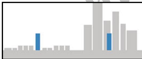
شکل شماره ۱: تعریف بنای بلند براساس زمینه. مأخذ:

متوسط زمین باشد. برای ساختمان‌های مخاطره‌آمیز این ارتفاع را می‌توان به تشخیص مرجع قانونی صدور پروانه و کنترل ساختمان، کمتر از این مقدار در نظر گرفت (مبحث ۳ مقررات ملی ساختمان، ۱۳۹۵، ۹). ساختمان‌های بلند بناهایی هستند که نسبت به زمینه‌ی استقرارشان دارای تأثیرگذاری خاصی باشند تا حدی که به عنوان یک بنای شاخص و مورد توجه و یک نشانه شهری مطرح گردند (کریمی، ۱۳۹۴، ۳۱). بلندی یک ساختمان تنها وابسته به ارتفاع آن نیست، بلکه در ربط با زمینه‌ای است که در آن وجود دارد بنابراین با در نظر گرفتن این که یک ساختمان ۱۴ طبقه در شهری با سازه‌های بلند مثل شیکاگو و یا هنگ‌کنگ ممکن است که به عنوان یک ساختمان بلند در نظر گرفته نشود اما در یک شهر ایالتی اروپائی یا یک ناحیه برون شهری، این ساختمان ممکن است که مشخصاً بلندتر از یک معیار متوسط شهری باشد نکته‌ای است که باید بدان توجه داشت. (Council on tall buildings and urban habitat 2013).