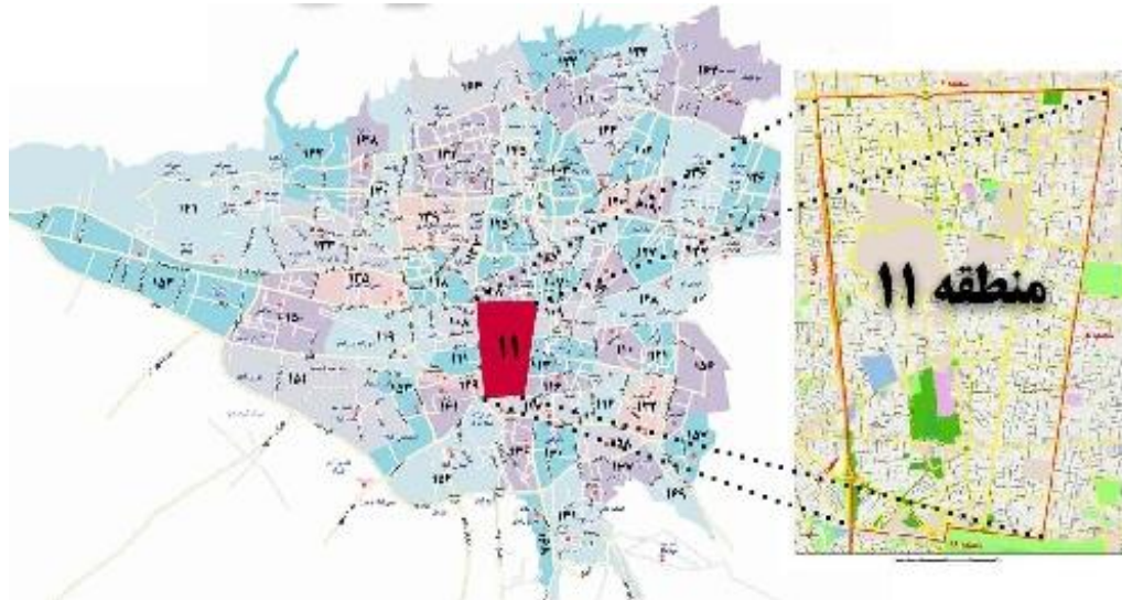
نقشه ۱- موقعیت منطقه ۱۱ در محدوده کلانشهر تهران

ارزیابی نقش عوامل موثر بر احساس امنیت زنان در محیط‌های شهری مطالعه موردی: منطقه ۱۱ تهران