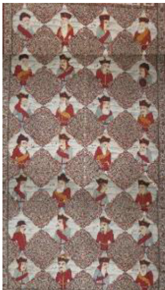
تصویر ۹: پرده قلمکار قرن ۱۴ ق. / ۲۰ م. (مونسی سرخه و حسین‌زاده قشلاقی، ۱۳۹۸: ۱۵۲).

هندسی و نوشتاری در پارچه‌ها دیده می‌شود (مونسی سرخه، حسین‌زاده قشلاقی، ۱۳۹۸: ۱۶۹).