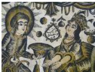
تصویر ۸: پرده قلمکار، یوسف و زلیخا، قرن ۱۳ ق. / ۱۹ م. (مونسی سرخه و حسین‌زاده قشلاقی، ۱۳۹۸: ۱۴۶).

برای تنوع در ماده رنگ می‌توان قلمکار را به سه شیوه اکلیلی، زرو و جیگر نات تقسیم نمود. در قلمکار اکلیلی بعد از چاپ رنگ‌های اصلی مقداری اکلیل با سریشم مورد استفاده قرار می‌گیرد که سبب براق شدن کار می‌گردد. قلمکار زر همان طور که از نامش پیداست با طلای ذوب شده تزیین شده که هزینه بالایی دارد. جیگر نات که شامل رنگ قرمز و بنفش است به دلیل ارزانی و سادگی کم‌ارزش‌ترین قلمکار تلقی می‌شود که در تهیه لباس زنان ایلات و روستا کاربرد داشته است (قره‌نژاد، ۱۳۵۶: ۷۰).