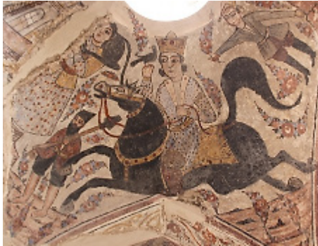
تصویر ۶: بهرام گور (نگارندگان، ۱۳۹۷).

مهارت داشت. این داستان عاشقانه در صدفه غربی حمام به رنگ‌های سیاه، آبی کمرنگ، اخراپی، کرم، زرد قهوه‌ای و قرمز قابل رویت است (تصویر ۶).