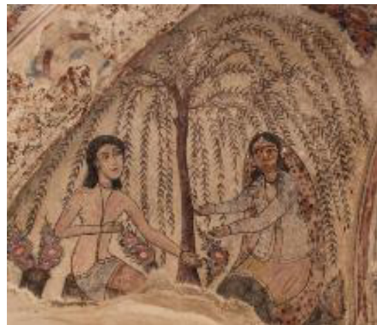
تصویر ۵: دیدار لیلی و مجنون (نگارندگان، ۱۳۹۷).

داستان عاشقانه دیگر تصویر دو دل‌داده در کنار درخت بید در حال گفت‌وگوست که در صدفه شمالی حمام با رنگ‌های قهوه‌ای سبز، آبی، صورتی قرمز، زرد، آبی تیره، اخراپی و کرم قابل مشاهده است (تصویر ۵).