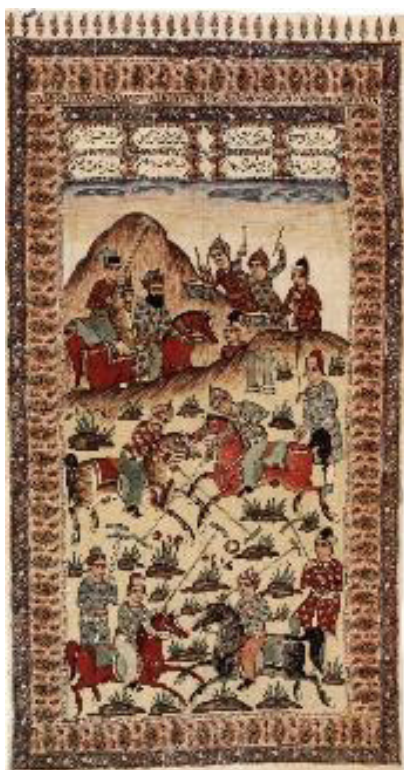
تصویر ۱۰: پرده پنبه‌ای قلمکار، ۱۲۹۷-۱۳۳۸ ق. / ۱۸۸۰-۱۹۲۰ م. نگهداری در موزه ویکتوریا و آلبرت، لندن، (collection.vam.ac.uk).

دو مرد نوازنده طبل و یک مرد در حال نواختن ساز بادی با لباس به رنگ آبی و قرمز در زیر آسمان ابری تصویر شده‌اند. دو ردیف متن سیاه و سفید در بالای صحنه بر باندهایی با زمینه زرد تصویر شده و در بالای آن نقوش زرد، قرمز و سفید بر حاشیه باریکی به چشم می‌خورد.