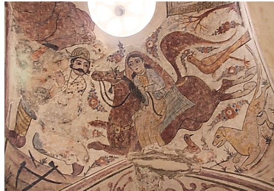
تصویر ۴: دیدار شیرین و فرهاد (نگارندگان، ۱۳۹۷).

تصویر عاشقانه نظامی گنجوی در داستان پرویز پسر خسرو پرویز، پادشاه ایران، در یک خانه روستایی که سبب شفاعت غلام او می‌شود را در صدفه غربی حمام و در داستان دیدار شیرین و فرهاد در بیستون با رنگ‌های قهوه‌ای، آبی کمرنگ، مشکی و اخراپی می‌توان ملاحظه کرد (تصویر ۴).