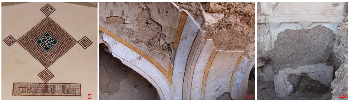
تصویر ۹: آرایه‌های گچی و دیوارنگاره الف) خانه‌ای در محوطه درمیان ب) خانه‌ای در محوطه ریگ ج) مسجد گز (نگارنده: ۱۳۹۰).

با توجه به آثار برجای مانده، آرایه‌های گچی بناهای برخوار در دوره زمانی مورد بررسی همانند روند حاکم بر آرایه‌های معماری دوره صفوی، اندک بوده و در مقایسه با نمونه‌های دوره‌های متقدم و میانه سطح و شیوه هنری نازل و متفاوتی را نشان می‌دهد. این آرایه‌ها عمدتاً شامل ابزاراندازی‌ها و قاب‌بندهای گچی شکل‌گرفته از شمشه‌کاری است که بر سطوح بناهای صفوی هم‌چون اقامتگاه شاهی علی‌آباد ریگ،