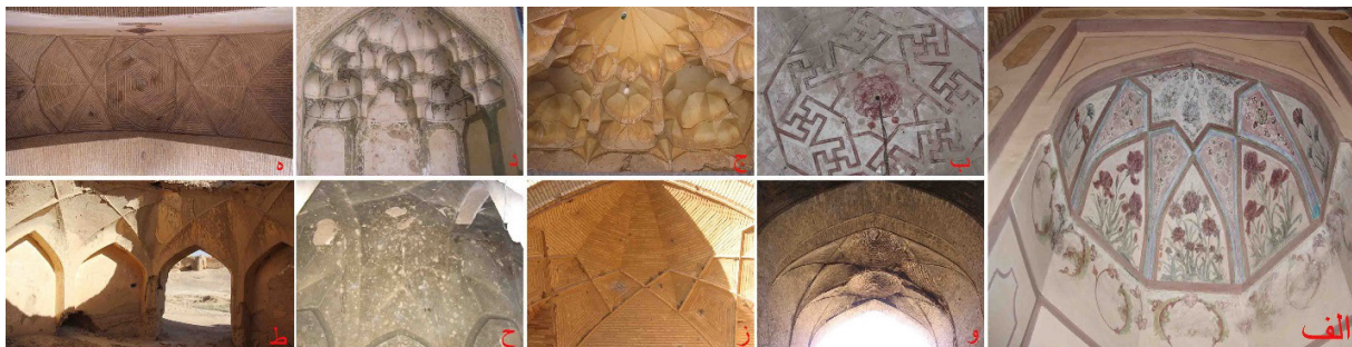
تصویر ۱۱: الف) دیوارنگاره‌های محراب مسجد گز ب) دیوارنگاره‌های بقعه عبدالمؤمن ج) آرایه مقرنس‌کاری مسجد گز د) آرایه مقرنس‌کاری بقعه عبدالمؤمن ه) آرایه کاربندی مسجد گز و) آرایه کاربندی کاروانسرای گز ز) آرایه کاربندی کاروانسرای شیخ‌علیخان ح) آرایه کاربندی خانه حاج عابدی‌های شاپورآباد ط) آرایه کاربندی مدرسه جعفرآباد.

دیوارنگاره به عنوان پدیده‌ای رایج در معماری تزیینی دوره صفوی در محراب صفوی مسجد جامع گز و پوشش زیرین گنبد بقعه عبدالمؤمن حبیب‌آباد به ثبت رسیده است. این نقوش در گز دربردارنده اسلیمی‌ها، ختایی‌ها و گل‌هایی هم‌چون شاه‌عباسی، زنبق، سرخ و لاله‌عباسی بوده (تصویر ۱۱.الف) و در بقعه عبدالمؤمن از گره‌های هندسی اختر چلیپا تشکیل شده است (تصویر ۱۱.ب). دیگر تزیینات ثبت شده در بناهای این دوره منطقه، در قالب تزیینات سازه‌ای هم‌چون کاربندی و مقرنس‌کاری قابل بررسی است. مقرنس‌کاری‌های این دوره محدود به مقرنس‌های گچی بوده و نمونه‌های آن در سردر مسجد جامع گز (تصویر ۱۱.ج) و ورودی غربی بقعه عبدالمؤمن حبیب‌آباد قابل ملاحظه است (تصویر ۱۱.د). نمونه‌های مذکور