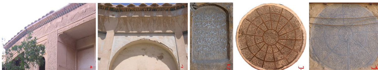
تصویر ۱۷: آرایه‌های سنگی و آجری (الف) کتیبه سنگی مسجد جامع گز (ب) کتیبه سنگی بقعه امامزاده نرمی (ج) کتیبه سنگی کاروانسرای مورچه خورت (د) خانه‌ای در دولت‌آباد (ه) خانه‌ای در گز (نگارنده، ۱۳۸۴).

بوده است. این پنجره‌ها در اشکال مدور، نیم‌مدور و چهارگوش است (تصویر ۱۸ - الف و ب). هم‌چنین سقف‌های چوبی لمبه‌کوبی‌شده نیز در یکی از خانه‌های گز و باغ نو سفیدآب (تصویر ۱۸ - ج)، دیده می‌شود.