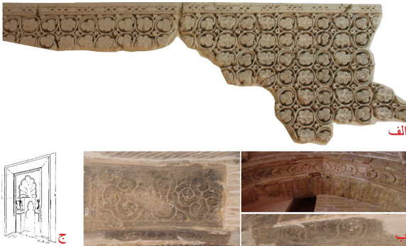
تصویر ۱: آرایه‌های معماری قرون سوم و چهارم هجری قمری، الف) آرایه‌های گچی بقعه امامزاده نرمی (نگارنده، ۱۳۹۳) ب) آرایه‌های گچی مسجد جامع گز (نگارنده، ۱۳۹۰) ج) طرح محراب مسجد جامع شاپورآباد (سیرو، ۱۳۵۷:۳۶۹).

بنا تهیه شده، محراب مسجد دارای تزیینات صدفی شکل و دونیم‌ستون گلدانی شکل بوده است (تصویر ۱-ج). سیرو این محراب گچی را با توجه به مقایسه‌های صورت گرفته به قرون دوم و سوم هـ ق نسبت داده است (سیرو، ۱۳۵۷:۳۶۶). از دیگر تزیینات این محراب، سنگ یشم سبزرنگی بود که در مرکز محراب قرار داشت و قبل از بازدید سیرو مفقود شده است. ۴