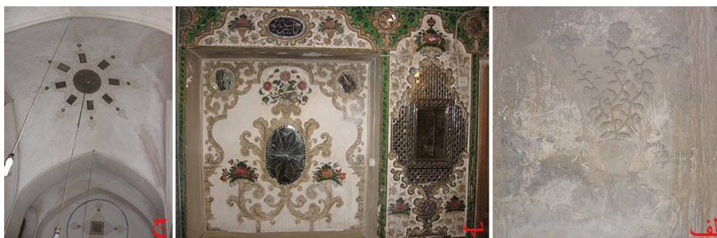
تصویر ۱۹: آرایه‌های آهکی، حمام مورچه‌خورت (ب) آرایه آینه‌ای، خانه محمدصادق خان برومند در خورزوق (ج) آرایه آینه‌ای، خانه کدخدا حاج محمدحسین لودریجه.

آرایه‌های آهکی حمام مورچه‌خورت که شامل تزیینات دالبردار و گلدان گل است نیز دارای چنین شرایطی بوده و معدود نمونه آرایه‌های آهکی برخوردار در این دوره و کل دوره‌های مورد بررسی را تشکیل داده است (تصویر ۱۹ - الف). همانند آرایه‌های چوبی و آهکی، آرایه آینه‌ای نیز برای اولین بار از بناهای دوره قاجار منطقه قابل پیگردی است. این آرایه‌ها که