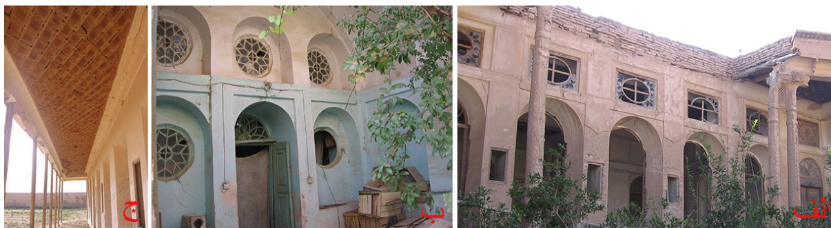
تصویر ۱۸: آرایه‌های چوبی (الف) خورشیدی‌ها، خانه‌ای در گز (ب) خورشیدی‌ها، خانه‌ای در دولت‌آباد (ج) آرایه چوبی سقف، باغ نو سفیدآب (نگارنده، ۱۳۸۴).

از آرایه‌های چوبی که برای اولین بار از این دوره قابل پیگردی است، پنجره‌های چوبی موسوم به خورشیدی است که به اشکال گره‌های هندسی با تکنیک مشبک‌کاری با شیشه‌های الوان تزیین شده و مختص برخی منازل این دوره