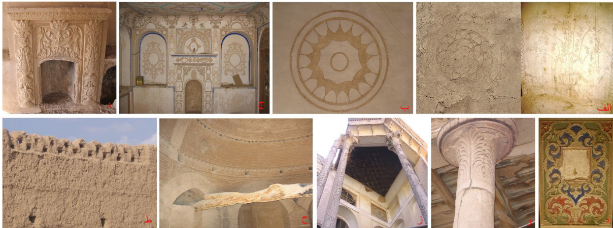
تصویر ۱۳: آرایه‌های گچی (الف) کشته‌بری، خانه‌ای در مورچه‌خورت (ب) کشته‌بری رنگی، خانه‌ای در علی‌آباد (ج) کشته‌بری و نقاشی دیواری، خانه غفاری‌ها در محسن‌آباد (د) بخاری دیواری، باغ نو سفیدآب (ه) گچ‌بری برجسته و رنگ‌کاری، خانه‌ای در مورچه‌خورت (و) گچ‌بری بر چوب، قلعه رحمت‌آباد شمالی (ز) گچ‌بری بر چوب، خانه‌ای در گز (ح) آرایه‌های خشت و گلی، آسیاب درمیان (ط) آرایه‌های خشت و گلی، یخچال خوشی دولت‌آباد (نگارنده، ۱۳۸۴ و ۱۳۸۶).

تشکیل می‌دهد (تصویر ۱۳ ح و ط). این گونه، با توجه به مصالح در دسترس و ارزان، از ویژگی‌های بومی منطقه ریشه گرفته و عمدتاً در تزیین منازل مسکونی کاربرد داشته و در دیگر بناهای خشت و گلی منطقه هم‌چون برخی قلاع،