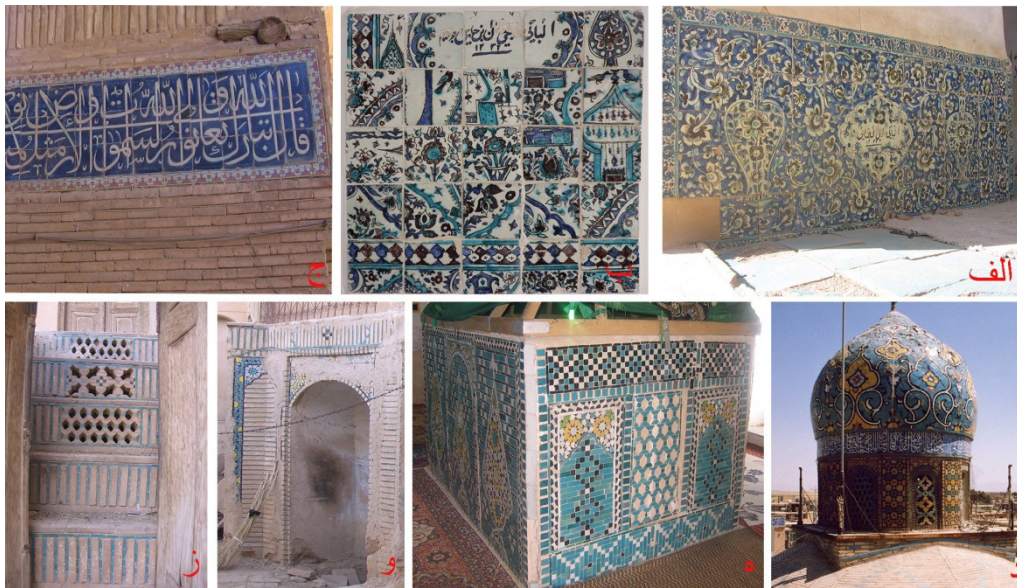
تصویر ۱۵: آرایه‌های کاشی (الف) کاشی هفت‌رنگ، مسجد جامع مورچه‌خورت (ب) کاشی هفت‌رنگ، بقعه سیدعلی مورچه‌خورت (ج) کاشی هفت‌رنگ، مسجد جامع گز (نگارنده، ۱۳۹۰) (د) کاشی معرق، هفت‌رنگ و نره، بقعه امامزاده نرمی (نریمانی، ۱۳۷۰) (ه) کاشی معرق، بقعه شاهزاده ابوالحسن کمشچه (و) کاشی معرق، خانه‌ای در گز (ز) کاشی معقلی و تکرنگ، خانه‌ای در گز (نگارنده، ۱۳۸۴).

در منازل، بیشتر مختص بناهای مذهبی بوده و در فضاهای هم‌چون سردر ورودی و محراب‌ها به کاررفته است. استفاده از رنگ به منظور تزیین آلت‌های کاربردی نیز رایج بوده؛ با این وجود کاربردی‌های منقوش از کمیت پایینی برخوردار بوده است (تصویر ۱۶ - ب و ج). تزیینات قطاربندی گچی و خشت و گلی از دیگر آرایه‌های سازه‌ای این دوره است که در نمای بیرونی بعضی از کبوترخانه‌های ۸ منطقه به کاررفته است (تصویر ۱۶ - د).