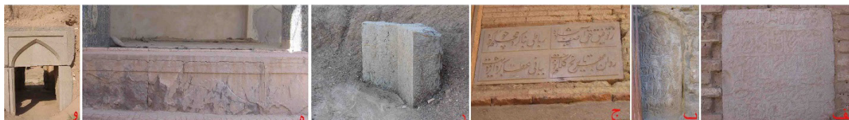
تصویر ۱۲: آرایه‌های سنگی الف) کتیبه سنگی مسجد گز ب) کتیبه سنگی مسجد گز ج) کتیبه سنگی کاروانسرای شیخ‌علیخان د) ازاره سنگی مدرسه جعفرآباد ه) ازاره سنگی مسجد مورچه‌خورت و) قاب بند سنگی سردر مدرسه جعفرآباد (نگارنده: ۱۳۸۴ و ۱۳۸۶).

و نقشدار (تصویر ۱۲ - ۵) به همراه قاب بند سنگی سردرها (تصویر ۱۲ - ۵) که نمونه‌های آن در مدرسه جعفرآباد و مسجد جامع مورچه‌خورت و برخی کاروانسراهای منطقه دیده می‌شود، از دیگر تزیینات حجاری این دوره است.