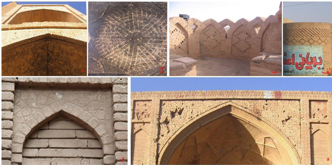
تصویر ۸: آرایه‌های آجری دوره صفوی الف) کاروانسرای مورچه‌خورت ب) کاروانسرای مادرشاه ج) کاروانسرای شیخ‌علیخان د) کاروانسرای شیخ‌علیخان ه) کاروانسرای شیخ‌علیخان و) مسجد گز (نگارنده: ۱۳۸۴).

مدرسه جعفرآباد و خانه‌ای در درمیان دیده می‌شود. این ابزاراندازی‌ها در مواردی در قالب اشکال گیاهی و هندسی (تصویر ۹ - الف) و در مواردی با دیوارنگاره همراه شده است (تصویر ۹ - ب). کتیبه‌های گچی از دیگر شیوه‌های آرایه‌های گچی است که تنها نمونه این دوره آن در ایوان جنوبی مسجد جامع گز دیده می‌شود. این کتیبه‌ها به خط کوفی بنایی و خط ثلث است (تصویر ۹ - ج).