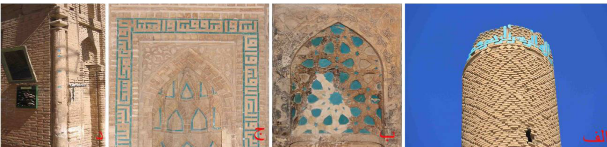
تصویر ۴: آرایه‌های تلفیقی آجر و کاشی الف) مناره سین ب) محراب مسجد گز ج) محراب مسجد گز د) نیم ستون تزیینی ایوان غربی مسجد گز.

سومین شیوه تزیینی، آرایه‌های تلفیقی کاشی و آجر است که از ترکیب کاشی‌های فیروزه‌ای تک‌رنگ با آجرهای قالبی و پیش‌بر به وجود آمده است. این آرایه‌ها در قالب کتیبه‌های کوفی منار سین (تصویر ۴ - الف)، کتیبه‌های بنایی و نقوش گره‌بندی محراب گز (تصویر ۴ - ب و ج) و هم‌چنین قطار بندی محراب مسجد گز (تصویر ۲ - د) تجسم یافته است. شیوه