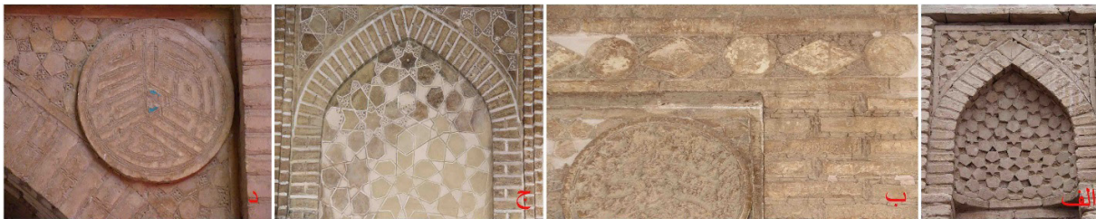
تصویر ۳: آرایه‌های تلفیقی آجری و گچی الف) نغول تزیینی مسجد گز ب) قاب بندهای ایوان غربی مسجد گز ج) محراب مسجد سین د) کتیبه کوفی مدور مسجد گز (نگارنده: ۱۳۹۰).

اخیر با مقرنس‌کاری نعلبکی مناره سلجوقی راهروان اصفهان، شباهت کامل دارد. تا مدت‌ها مناره سین، قدیمی‌ترین بنای ایرانی تاریخ‌دار با آرایه‌های کاشی محسوب می‌شد (گدار و دیگران، ۱۳۸۴: ۱۸۴)؛ تا این‌که تحقیقات محققان ایرانی نشان داد که این مناره، دومین بنای کتیبه‌دار کاشی‌کاری شده ایران به تاریخ ۵۲۶ ه.ق است (مخلص، ۱۳۷۹: ۳۴۳).