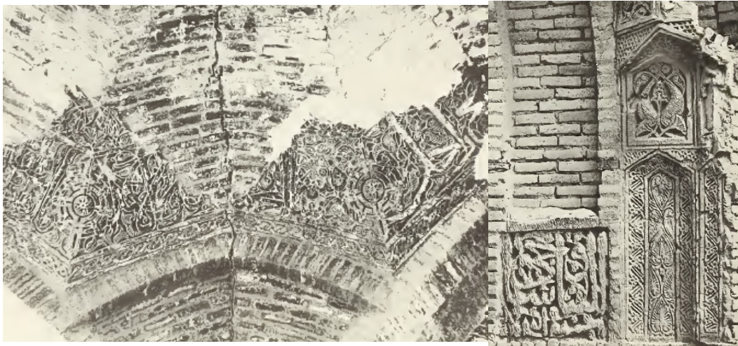
تصویر ۷: تزیینات گچ‌بری کاروانسرای معدوم‌شده سین (کیانی و کلایس، ۱۳۷۳:۲۲).

به بررسی تصاویر موجود (تصویر ۷)، تکنیک اجرای نقوش، گچ‌بری برجسته، برهشته و آژده کاری بوده و نقوش گیاهی و کتیبه‌های ثلث، عمده‌ترین نقش‌مایه‌ها را تشکیل می‌داده است. این آرایه‌ها، اسپرها و طاق سردر ورودی و سرسرای ورودی کاروانسرا را تزیین می‌نمودند.