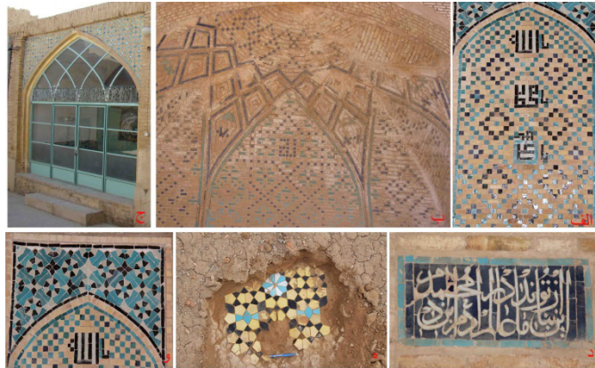
تصویر ۱۰: آرایه‌های کاشی الف) کاشی معقلی در مسجد گز ب) کاشی معقلی کاروانسرای گز ج) کاشی معقلی مسجد جامع مورچه‌خورت د) کاشی معرق کتیبه‌ای مسجد گز ه) کاشی معرق هندسی مدرسه جعفرآباد و) کاشی معرق هندسی مسجد گز (نگارنده: ۱۳۸۴ و ۱۳۹۲).

بر خلاف آثار دوره قبل به ویژه دوره سلجوقی، صرفاً جنبه آمودی و غیر باربر داشته و مصالح متفاوتی دارد. سطوح این مقرنس‌ها بعضاً با ابزاراندازی و رنگ‌کاری تزیین شده است. با توجه به آثار موجود، ظهور کاربندی در بناهای منطقه در این دوره بوده است. این کاربندی‌ها در دو گونه سازه‌ای و آمودی در دو دسته گچی و آجری قرار می‌گیرند. کاربندی‌های آجری به اشکال گوناگون در بناهایی هم‌چون مسجد جامع گز (تصویر ۱۱.ه)، کاروانسرای گز (تصویر ۱۱.و) و کاروانسرای شیخ‌علیخان (تصویر ۱۱.ز) و کاربندی‌های گچی در بناهایی هم‌چون خانه حاج عابدی‌های شاپورآباد (تصویر ۱۱.ح) و مدرسه جعفرآباد (تصویر ۱۱.ط) دیده می‌شود.