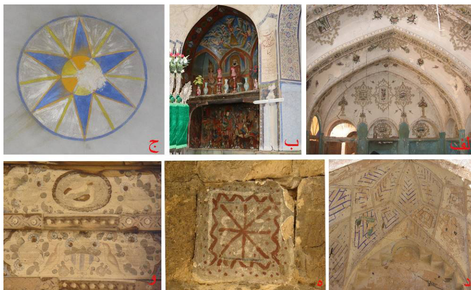
تصویر ۱۴: تزیینات نقاشی الف) خانه کدخدا حسین گرگاب ب) بقعه عبدالمؤمن حبیب‌آباد ج) مسجد جامع گرگاب د) تکیه دلیگان ه) خشت منقوش، خانه‌ای در مورچه‌خورت و) جوک‌کاری، خانه‌ای در مورچه‌خورت (نگارنده، ۱۳۸۴).

دوره است که در بنای شاهزاده ابوالحسن ۶ کمشچه (تصویر ۱۵ - ۵)، قبه بقعه امامزاده نرمی (تصویر ۱۵ - ۵) و یکی از خانه‌های اعیانی گز (تصویر ۱۵ - ۵) دیده می‌شود. کاشی‌های بنای شاهزاده ابوالحسن که در پوشش صندوق قبر به‌کاررفته، در مقایسه با نمونه‌های معرق دوره صفوی از منظر چگونگی اجرا و رنگ و لعاب کیفیت پایینی را نشان می‌دهد. نمونه‌های کاشی‌کاری معقلی در یکی از منازل مسکونی اعیانی گز (تصویر ۱۵ - ۵) شناسایی شده است. این آرایه‌ها از نقوش گل‌انداز و بندکشی‌های کاشی تشکیل شده که در راه‌پله بنا به‌کاررفته است. این موضوع در کنار کاربرد کاشی معرق در این خانه، خصوصیتی است که در منازل مسکونی به ویژه در نواحی روستایی کمتر معمول بوده است. کاشی نره به عنوان گونه‌ای خاص از کاشی که مختص پوشش خارجی گنبدها بوده است، در قبه بقعه امامزاده نرمی به‌کاررفته بود (تصویر ۱۵ - ۵).