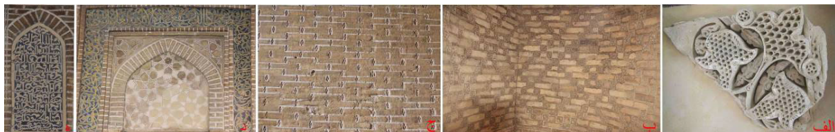
تصویر ۶: الف) آرایه گچی مکشوفه در بقعه امامزاده نرمی (نگارنده: ۱۳۹۳) ب) آرایه گچی کلوک‌بند در مسجد گز (ج) آرایه گچی کلوک‌بند در مسجد سین (د) کتیبه گچی رنگ‌آمیزی شده در محراب مسجد سین (ه) کتیبه سنگی در گنبدخانه مسجد سین (نگارنده: ۱۳۹۰).

آرایه گچی در این دوره، فقط در مقبره امامزاده نرمی به کار رفته است (تصویر ۶ - الف). از این آرایه‌های گچی چند قطعه مانده و همان‌گونه که پیشتر بدان اشاره شد، در حین تخریب گنبدخانه بنا به دست آمده است. آرایه مذکور از نقوش گیاهی آژده‌کاری شده تشکیل شده و با بسیاری از نمونه‌های دوره سلجوقی قابل مقایسه است. از دیگر آرایه‌های گچی، آرایه گچی کلوک‌بند است که سطوح دیواره‌های آجری دو مسجد گز و سین را پوشانده است (تصویر ۶ - ب و ج). این آرایه به عنوان یکی از ویژگی‌های مختص دوره سلجوقی (مکی‌نژاد، ۱۳۸۷: ۱۸۶)، به وفور در آرایه‌های معماری این دو