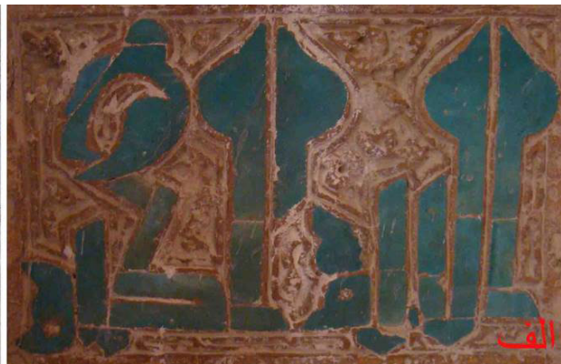
تصویر ۵: آرایه تلفیقی کاشی و گچ (الف) محراب مسجد گز (ب) کتیبه زیر پاکار طاق اولیه ایوان غربی مسجد گز (نگارنده: ۱۳۹۲).

بنا به کاررفته است. همانند بسیاری از آرایه‌های این گونه در معماری سلجوقی، در ترکیب این آرایه‌های گچی کلوک بند با یکدیگر و با بندکشی‌های سطوح، طرح‌های متنوعی در دو بنای یاد شده به وجود آمده است. کتیبه نسخ حاشیه بیرونی محراب مسجد سین که زمینه آن با رنگ آبی تزیین شده، معدود نمونه رنگ‌آمیزی بستر آرایه گچی است (تصویر ۶ - ۵). آرایه‌های سنگی این دوره محدود به کتیبه سنگی مسجد سین است که با خط ثلث تلفیق یافته با نقوش گیاهی، بانی ساختمان و تاریخ ساخت گنبدخانه بنا در ۵۲۹ هـ ق را معرفی کرده است (تصویر ۶ - ۵).