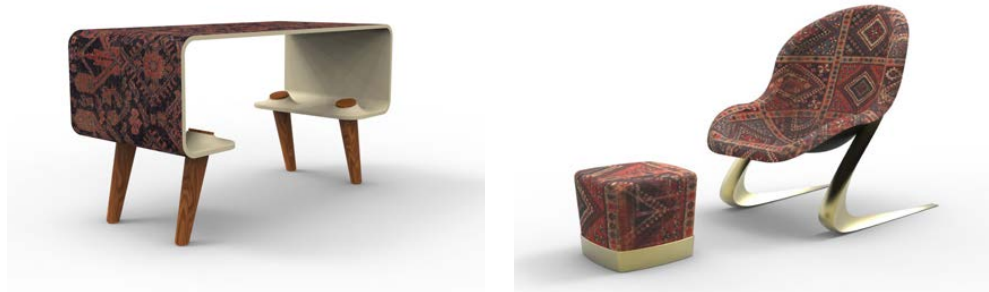
تصویر ۶: نمونه میز و نشیمن‌های طراحی‌شده با هدف استفاده مجدد از فرش دست‌باف ایرانی (طراحی و سه‌بعدی‌سازی: نگارندگان).