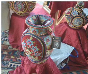
تصویر ۳: نمونه استفاده از فرش در تزئین ظروف