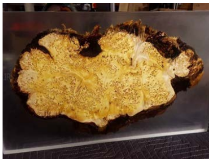
تصویر ۲: نمونه‌ای از رویکرد هم‌جواری مواد متفاوت در خلق یک محصول