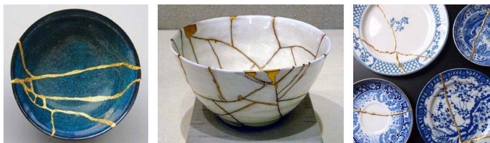
تصویر ۱: نمونه‌هایی از هنر کینسوگی.

به طوری که ظرف، پس از کهنه و حتی شکسته شدن، نماد تجربه‌ای ارزشمند تلقی می‌شود. در این زمان ظرف از کار افتاده با طلا تعمیر می‌شود و پس از آن، در مرتبه‌ای بالاتر از عملکرد پیشین خود قرار می‌گیرد و از یک شی معمولی به یک شی گرانبها تبدیل می‌شود (تصویر ۱). کینسوگی قرار است نشان بدهد که چطور اشیاء قدیمی و نوستالژیک از کار افتاده تعمیر شده، و به ایجاد درک دوگانه‌ای از یک اتفاق منفی و بازسازی آن متمایل می‌شوند (Keulemans 2016). کینسوگی در راستای نشان دادن ارزش نوستالژی نهفته در محصول مستهلک شده و از کار افتاده و به عنوان راهی برای حفظ آن ایجاد شده است. به رغم وجود چنین رویکردهایی که در سایر فرهنگ‌ها یافت می‌شوند، در ایران، فرش‌های دست‌باف قدیمی که دیگر نمی‌توانند کارکرد اصلی‌شان را داشته باشند از چرخه مصرف خارج می‌شوند. فرش‌هایی که حاوی یک نوستالژی ارزشمند و حامل بخشی از فرهنگ ایرانی هستند.