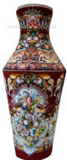
تصویر ۴: نمونه استفاده از فرش در تزئین گلدان