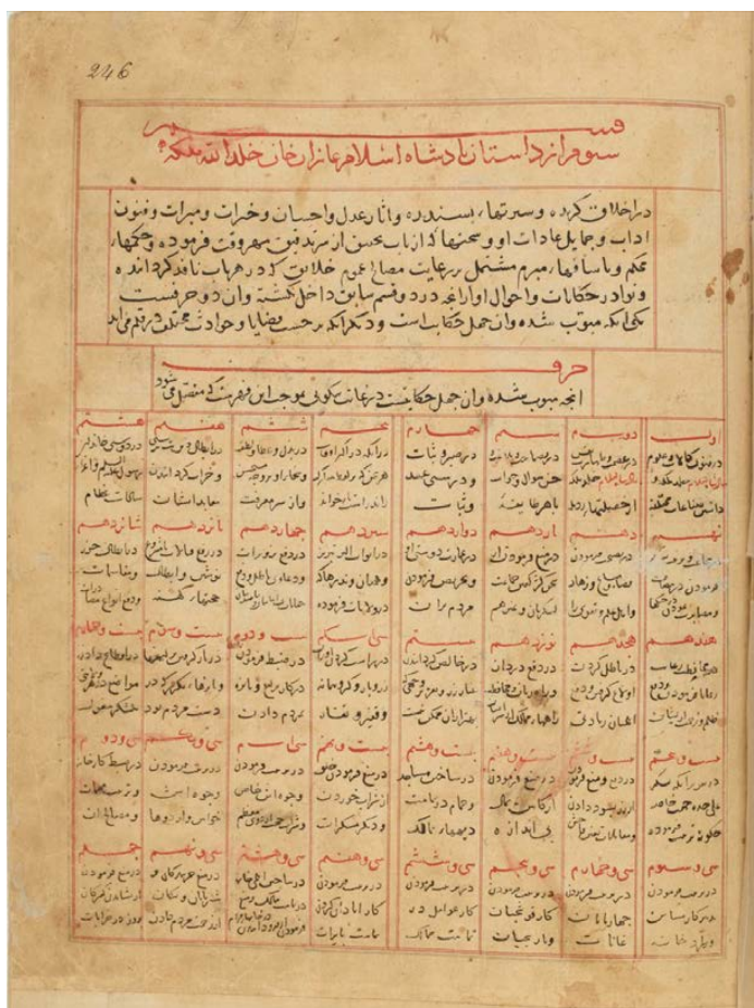
تصویر ۳: برگی از جامع التواریخ، مربوط به اصلاحات غازانی، محفوظ در کتابخانه ملی پاریس (113.1513, 113). (SUPPL.)

در این مجلد، خواجه رشید شرح دقیقی از خاتونان غازان خان ارائه می‌دهد (همان، ۱۴-۱۵) و در ادامه، تمامی اقدامات و اصلاحات ساختاری غازان خان را شرح می‌دهد که البته خود او نیز در انجام این اصلاحات نقش بالافصلی داشته است.