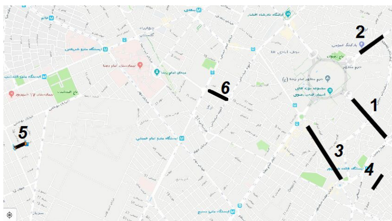
تصویر ۱: نقشه مناطق فعال انگشترسازی مشهد: (۱) خیابان نواب صفوی، (۲) خیابان طبرسی، (۳) بازار رضا، (۴) خیابان چهنو، (۵) دختر بهشتی، (۶) کوچه ارگ، (۷) خانه ملک.

علاقه‌مند به خرید انگشتری با نگین خاص را ترغیب می‌کند، اعتقاد به روایت‌های ائمه معصومین است که در منابعی چون حلیه المتقین، تحفه عالم شاهی، هدایت الائم، مصباح تذکره، کنز الحقایق و ... آمده است. در حلیه المتقین از امام صادق (ع) نقل شده است که: دوست دارم مومن، پنج انگشتر با نگین‌های عقیق، فیروزه، یاقوت، حدید و دُر به دست کنند (مجلسی ۱۳۸۸، ۳۶). بنا بر اعتقادات اسلامی، انداختن نگین عقیق به‌ویژه قرمز، زرد و سفید، فقر را از بین می‌برد، محافظ در سفر است، حاجت‌ها برآورده شده و غم و غصه دور می‌شود. از خواص فیروزه است که صاحب آن نیازمند نخواهد شد و ناامید نشدن از حاجت و پیروزی است. انگشتر یاقوت برای نجابت و بزرگی و حدید، موجب نیرومندی و آرامش و سبب تقویت انرژی معنوی می‌شود. از آنجا که معادن فیروزه در نیشابور و عقیق در تربت حیدریه و تربت جام است (تصویر ۲)، به نظر می‌رسد از این دو نوع نگین در انگشتری‌های مشهد بیش‌تر استفاده شده است (ماهنامه بین‌المللی اقتصاد آسیا ۱۳۹۷، ۲۶-۲۷).