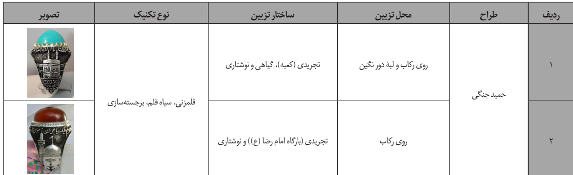
جدول ۹. اماکن مقدس بر انگشتری‌های مشهد دوره معاصر (نگارندگان).

در انگشترسازی معاصر مشهد، رکاب‌های بازاری غالباً از جنس نقره و رکاب‌های سفارشی از فدیوم بوده که یک تکه و بدون جوش هستند. بیش‌تر این رکاب‌ها با کارهای هنری از قبیل قلمزنی همراه هستند و این مسأله باعث خلق سبک جدید و خاص مشهد شده است. هنرمندان انگشترساز مشهدی، تزیین آثار را به صورت کنده‌کاری و مثبت‌کاری انجام می‌دهند و نقوش، قلمزنی می‌شوند تا برجسته شده و فرم سه بُعدی به خود بگیرند. همچنین، بیش‌ترین مضامین به کار رفته، ادعیه، اذکار، نقوش گیاهی، حیوانی، پرنده و اماکن مقدس است که در بین افراد مذهبی بیش‌ترین خواستار را دارد. بیش‌ترین نگین‌هایی که روی رکاب سوار شده، فیروزه و عقیق هستند با اعتقادات حاصل از احادیث شیعی مرتبط هستند. حرفه انگشترسازی در گروه صنایع کوچک جای دارد و با آموزش و تولید اشتغال در فعالیتهایی از قبیل رکاب‌سازی، تراش نگین و ... در کارگاه‌های خانگی، رونق پیدا کرده است.