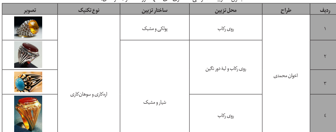
جدول ۵. تزیینات انتزاعی انگشتری‌های مشهد دوره معاصر (نگارندگان).

روی رکاب، نقوش هندسی به صورت خاص و تنها وجود ندارد. این نقوش به صورت مستطیل، بیضی، سه گوش و ... است و اساتید قلمزن، اصطلاحاً به آنها کادر می‌گویند. شاید بتوان از جمله نقوش انتزاعی بر انگشتری‌ها، از پرندگان اسطوره‌ای مانند سیمرغ یا وقایع تاریخی که به صورت ذهنی طراحی می‌شوند، نام برد (جداول ۵ و ۶).