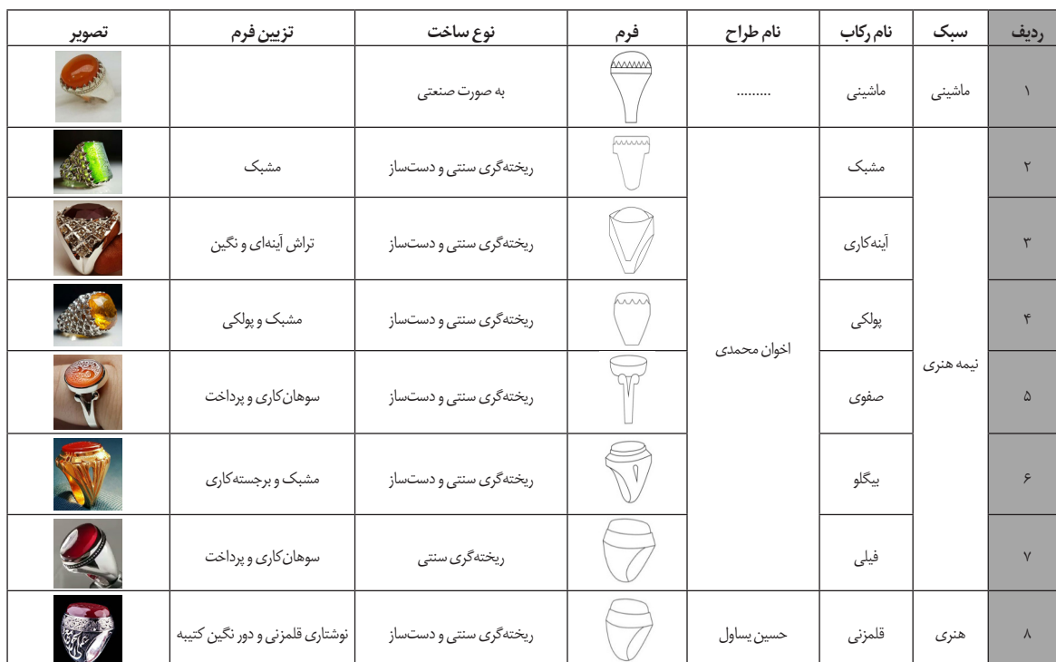
جدول ۱. رکاب انگشتری‌های موجود در بازار مشهد (نگارندگان).

* رکاب‌های قلمزنی: این رکاب‌ها با قیمت بالاتری نسبت به رکاب‌های دیگر به فروش می‌رسند. جنبه هنری و قیمتی دارند و برای افزایش کیفیت، صرف وقت بیش‌تری در زمان تولید را طلب می‌کنند. در جدول (۱)، دسته‌بندی رکاب‌های انگشتری مشهد و نمونه تصویری هر یک، نمایش یافته است.