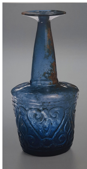
تصویر ۷: تنگ گوشت‌کوبی، تزئین به شیوه دمیده در قالب دوتکه، سده ۴ و ۵ ه.ق، احتمالاً ایران، مجموعه الصباح، موزه ملی کویت (Carboni and Whitehouse 2001, 91).