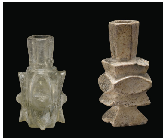
تصویر ۱۴: عطردان‌های شیشه‌ای، با کاربرد تراش، ایران یا عراق (Whitehouse 2010, 62)