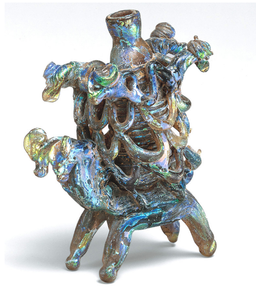
تصویر ۴: فلاسک حیوانی، سوریه، شماره ثبتی: ۶۹/۱۵۳ (www.metmuseum.org)