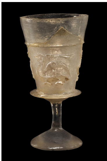
تصویر ۸: جام شیشه‌ای پایه‌دار، مصر یا ایران (Whitehouse 2010, 210).