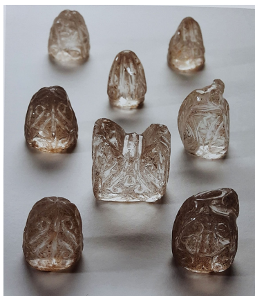
تصویر ۱۰: مهره‌های شطرنج ساخته‌شده از سنگ بلور، مصر (Alkhemir 2014, 123).