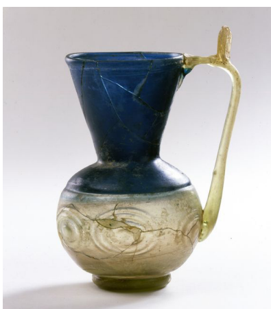
تصویر ۳: پارچ شیشه‌ای، شیوه‌ی ساخت اینکالمو، ایران شماره ثبتی: 9/1966 (www.davidmus.dk)

استفاده از شیوه‌ی اینکالمو که به نظر می‌رسد توأمان از شیوه‌های ساخت و تزئین شیشه محسوب می‌گردد، برای اولین بار در شیشه‌گری اسلامی مشاهده می‌شود. «شیشه‌گران اسلامی از نظر فنی مهارت بسیاری در پوشش کامل یا جزئی و همچنین فرایندهای پیچیده هم‌جوشی قطعات شیشه با رنگ‌های متضاد داشتند. این شیوه از ساخت شیشه، در دوره‌های بعد در شیشه‌گری روم متداول می‌شود» (Ricke 2002, 39). در سده‌های بعدی با انتقال این شیوه از شیشه‌گری اسلامی به شیشه‌گری غرب، اینکالمو به عنوان یکی از شیوه‌های رمزآلود شیشه‌گری مورانو مطرح می‌شود.