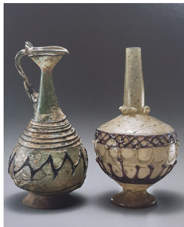
تصویر ۱۲: تنگ شیشه‌ای با تزئین نوار افزوده، ایران (Carboni 2001, 176-177, Cats.43a-b).