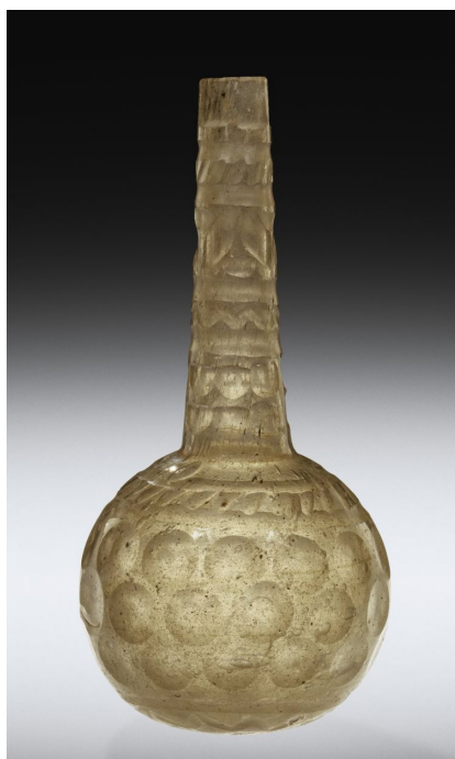
تصویر ۶: صراحی شیشه، ایران، شماره ثبتی: ۵۵/۱/۱۲۹ (www.cmog.org)

لیوان‌ها و جام‌های پایه‌دار از جمله فرم‌های متداول در این دوران است که به نظر می‌رسد استفاده از این فرم در شیشه‌گری اسلامی مورد توجه قرار می‌گیرد. «لیوان‌هایی برای نوشیدن مایعات از فرم‌های معمول در سده‌های چهارم تا پنجم ه.ق محسوب می‌شوند. اغلب این فرم‌ها با استفاده از نقوش قالبی حاوی نقوش حیوانی و نوشتاری است» (Carboni 2001, 87). بر روی این آثار، اغلب از تزئینات قالبی حاوی نقوش حیوانی و خط استفاده می‌گردید (تصویر ۸).