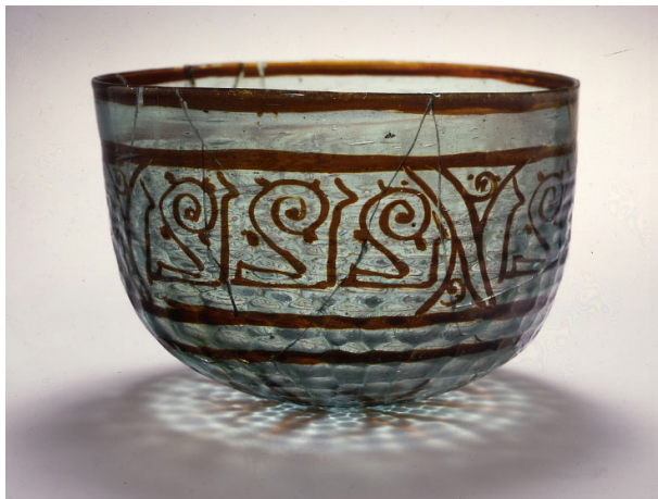
تصویر ۱۵: کاسه شیشه‌ای با تزیین مینیایی نوع قرمز رنگ، مصر