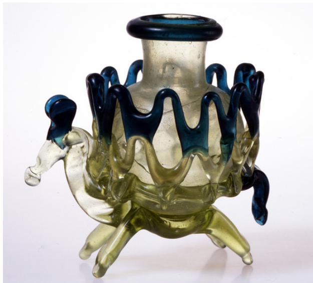
تصویر ۵: فلاسک حیوانی، سوریه، شماره ثبتی: ۱۹۷۹/۴۹

(Carboni et. al 2006, 56) «فلاسک‌های حیوانی ۷ با استفاده از نوارهای شیشه‌ای تزئینی ساخته می‌شدند. در این آثار، ظرف شیشه‌ای روی پیکره حیوانی قرار می‌گرفت که با نوارهای شیشه‌ای در قالب قفس‌های محافظ ظرف مشاهده می‌شد. این ظروف برای نگهداری مایعات معطر مورد استفاده بوده است» (Ibid, 56) (تصاویر ۴ و ۵).