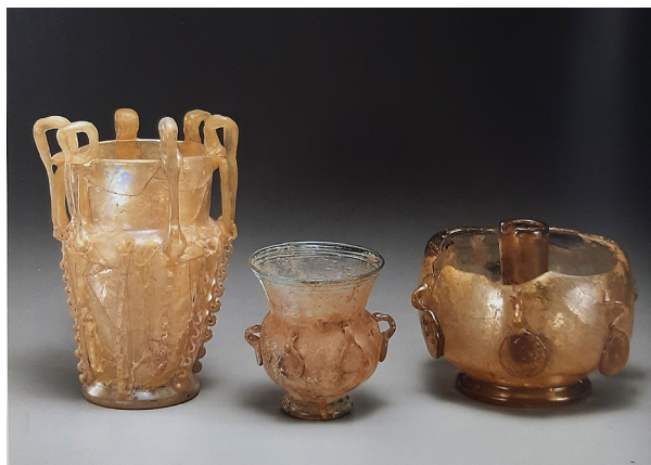
تصویر ۹: قندیل‌های شیشه‌ای، به ترتیب از راست) سوریه، سوریه یا ایران و ایران (Carboni 2001, 165-167, Cats. 38a-c).