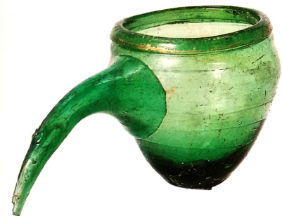
تصویر ۱۱: ظرف شیشه‌ای حجامت، محل نامشخص (مادیسون و ساواژ اسمیت ۱۳۸۷، ۴۰).