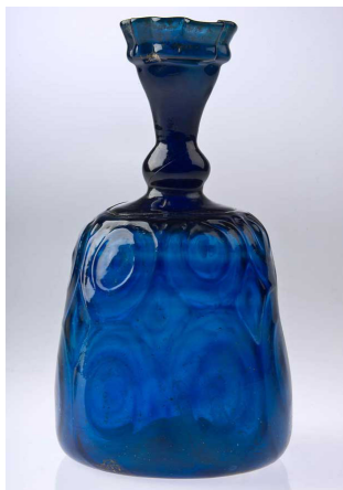
تصویر ۱۳: تنگ زنگوله‌ای با تزئین قالبی و نقوش مدور، ایران، شماره ثبتی: GL.521

به کارگیری قالب برای ایجاد نقوش و تزئینات روی بدنه تولیدات شیشه‌گری اسلامی در حالت گرم مشاهده می‌شود. آثار ارزشمند و بی‌بدیلی که با این شیوه ساخته شده‌اند از بیش‌ترین تنوع و فراوانی در بین شیشه‌های اسلامی برخوردار هستند. «استفاده از قالب برای ایجاد نقوش روی بدنه ظرف در حالتی که گوی شیشه هنوز فرم نهایی را به خود نگرفته است، از ابداعات شیشه‌گری اسلامی در ایران و عراق و سوریه محسوب می‌شود. در این روش، به دلیل گرم‌نمودن مجدد شیشه پس از فشردن در قالب، نقوش روی آثار بزرگ‌تر شده و در مواردی از قرینگی و نظم خارج می‌شوند. متداول‌ترین نقوش در قالب‌ها اشکال هندسی متحدالمرکز با یک دایره در مرکز (اصطلاحاً اومفالوس ۴ )، نقوش گیاهی و گل‌های بزرگ متشکل از چند گلبرگ و ایجاد خطوط موج‌دار است. در مواردی نیز نقوش طاووس و الگوی لانه‌زنبوری در تولیدات شیشه مشاهده می‌شود» (Ibid, 64) (تصویر ۱۳).