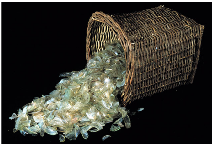
تصویر ۱: شیشه‌های ذوب‌شده مکشوفه از کشتی سرچه لیمانی (www.Nauticalarch.org).

با بررسی مواد اولیه در آثار شیشه اسلامی مشخص می‌شود: «تقریباً اغلب شیشه‌های دوره اسلامی مشابه شیشه‌های تاریخی مصر، بین‌النهرین، هلنی و رومی از نوع شیشه سودا آهکی سودالایم ۱ هستند که مجدداً با کیفیت بهتری احیاء شده‌اند. این شیشه‌ها به خوبی از سنت‌های ساخت شیشه یعنی استفاده از آهک، سنگ سیلیس و سودا پیروی کرده‌اند. سودا یا ماده‌گذارآور، از سوزاندن نوعی گیاه به دست می‌آید که خاکستر آن دارای مقادیر زیادی از پتاسیم و سدیم بوده است. سیلیس از کوارتز موجود در طبیعت به دست می‌آید و مقادیری از آهک در ترکیب سیلیس و سودا وجود داشت که در ترکیب مواد اولیه ساخت شیشه قرار می‌گرفت» (Carboni and Whitehouse 2001, 28).