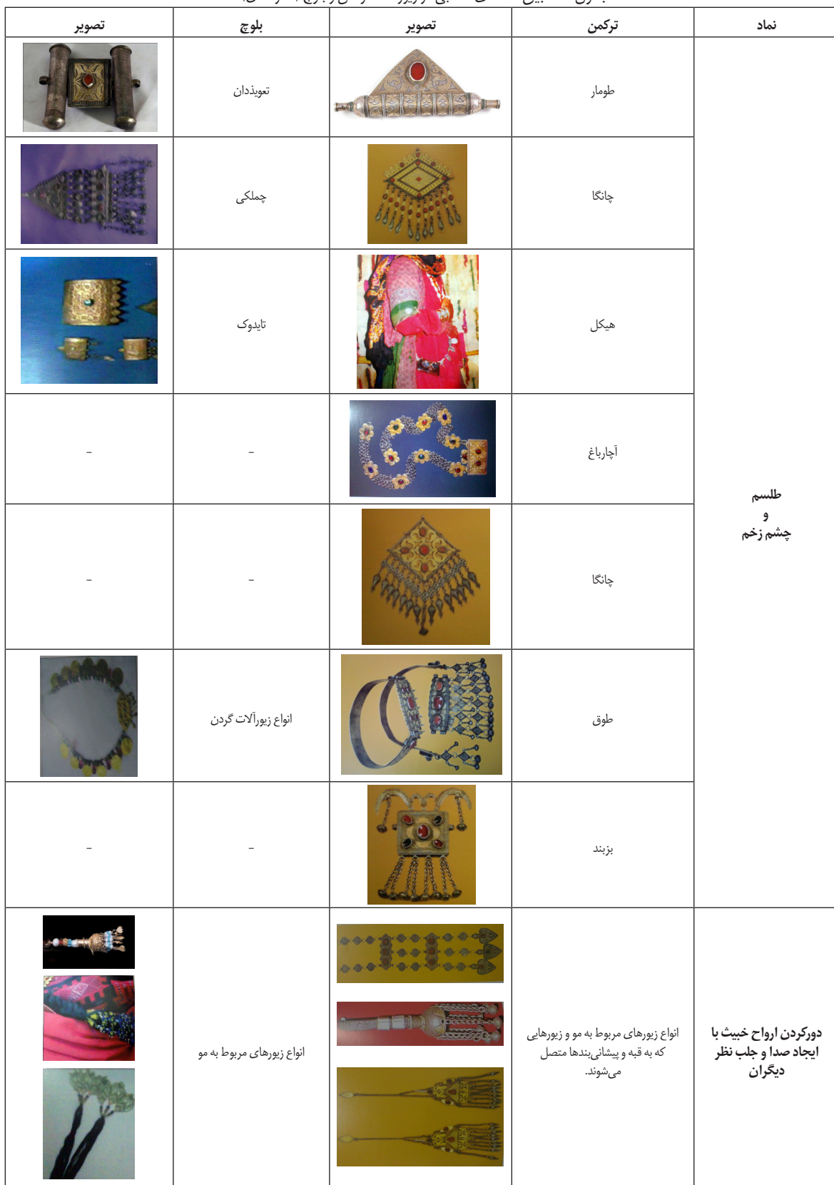
جدول ۲. تطبیق نمادهای مذهبی در زیورآلات ترکمن و بلوچ (نگارندگان).