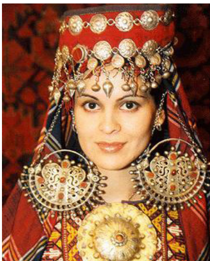
تصویر ۴: نمایی از زیورآلات زن ترکمن

زرگرها سعی می‌کنند تا جایی که محدودیت‌های هنری اجازه می‌دهد ذهنیت خود از زیبایی را روی اثر پیاده کنند. هرچه بیش‌تر بتوانند این زیبایی را از درون خود به بیرون انتقال دهند، اثر هنری آنها دارای اصالت بیش‌تری خواهد بود. «زیورآلات ترکمن اغلب به صورت قطعاتی درشت از نقره‌اند که بر سطح آن‌ها طرح‌هایی ساده شده از گل و گیاه و نقش‌هایی جادویی حک شده و با نگین‌هایی از عقیق یا شیشه‌های رنگین تزیین شده‌اند. این زیورآلات اغلب فاقد جزییات و دارای وقار و سنگینی ویژه‌ای هستند که به آن‌ها اصالت خاصی می‌بخشد. این جواهرات که وزن خیلی زیادی دارند در ابتدا برای هدف خاصی ساخته شده‌اند. گویی صدای جیرینگ جیرینگ آن‌ها طلسم محافظی است که ارواح شرور را دور می‌کند و باور ترکمن‌ها در مورد باطل السحر بودن فلزات ما را وادار به قبول این نظریه کرده و عظمت و بزرگی آن‌ها محافظی است که همیشه همراه صاحبانشان می‌باشد» (محمدی ۱۳۸۸، ۹۴).