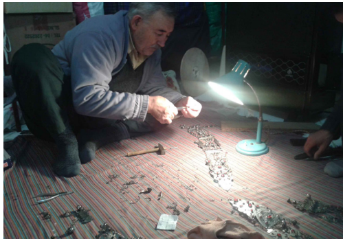
تصویر ۳: ساخت جواهرات در یک کارگاه جواهرسازی، بندر ترکمن.

ساخت زیورآلات ترکمن، «در کارگاه‌های استادکاران نقره‌کار با وسایل ابتدایی و روش‌های خاص صورت می‌گیرد» (کلته و پوری ۱۳۸۲، ۷). مواد اولیه تولید این زیورآلات، شامل نقره، طلا، ورشو، برنج، قلع، تته‌کار، کاتمنیوم، عقیق، سرب و انواع سنگ‌های رنگی می‌باشد. البته از میان مواد اولیه مذکور، نقره بیش‌ترین کاربرد را دارد و دیگر فلزات، به عنوان فلزات تکمیلی یا جهت ساخت زیورهای بدلی مورد استفاده قرار می‌گیرند. زیورسازان ترکمن، از ابزارآلات مختلفی استفاده می‌کنند که شامل کوره ذوب، بوتله، آتشگیر، انواع چکش، سندان، دم‌باریک زگری، حدیده، دستگاه ورق‌کن، انواع قیچی، سوهان و سمباده، شابلون‌های نقوش، انواع انبر، اره، برس و گیره، لوله دم، دستگاه نورد برقی، ترازو، مشعل گازی، چراغ پریموس و انواع دریل می‌باشند (تصویر ۳).