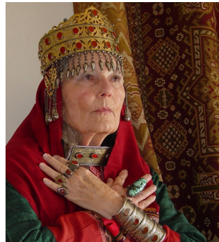
تصویر ۲: نمونه‌ای از کاربرد زیورآلات ترکمن (همان).