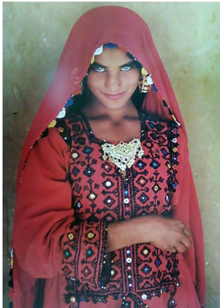
تصویر ۵: نمونه‌ای از زیورآلات بلوچ (ذوالفقاری ۱۳۸۹، ۱۵۲).

بنا بر عقیده برخی باستان‌شناسان، جنوب شرق ایران به ویژه بلوچستان یکی از نقاطی است که بر سر راه مهاجرت نخستین گروه‌های انسانی از آفریقا به سوی جنوب شرق آسیا قرار داشته است. از اینرو از مناطق مهم و کلیدی به شمار می‌رود. منظور از زیورآلات سنتی در بلوچستان، زینت‌آلات سنتی شهری، روستایی و مردم چادرنشین بلوچستان می‌باشد که به عنوان یک منطقه فرهنگی در نظر گرفته شده است. «از سابقه تاریخی ساخت زیورآلات در سیستان اطلاع چندانی در دست نیست و مسلم است زیورآلات را دوره‌گردها که وطن خاصی نداشتند و از یک منطقه به منطقه دیگری می‌رفته‌اند که معمولاً به آنها کولی گفته می‌شود می‌ساخته‌اند» (یعقوبی ۱۳۹۲، ۷۵). زیورآلات این منطقه، عمدتاً از نقره بوده و استفاده از فلزات دیگر صرفاً جهت ساخت زینت‌های بدلی بوده است. ابزار و وسایل ساخت زیورآلات در بلوچستان، شامل ابرک، ریجه، برمه، بوته سوز، پرس مکانیکی، جوت انبر، چکش، چمود و دریل برقی، سنگاتی، سرایی، سندان، سنگ سباده، سوهان، سیم چین و ... می‌باشد.