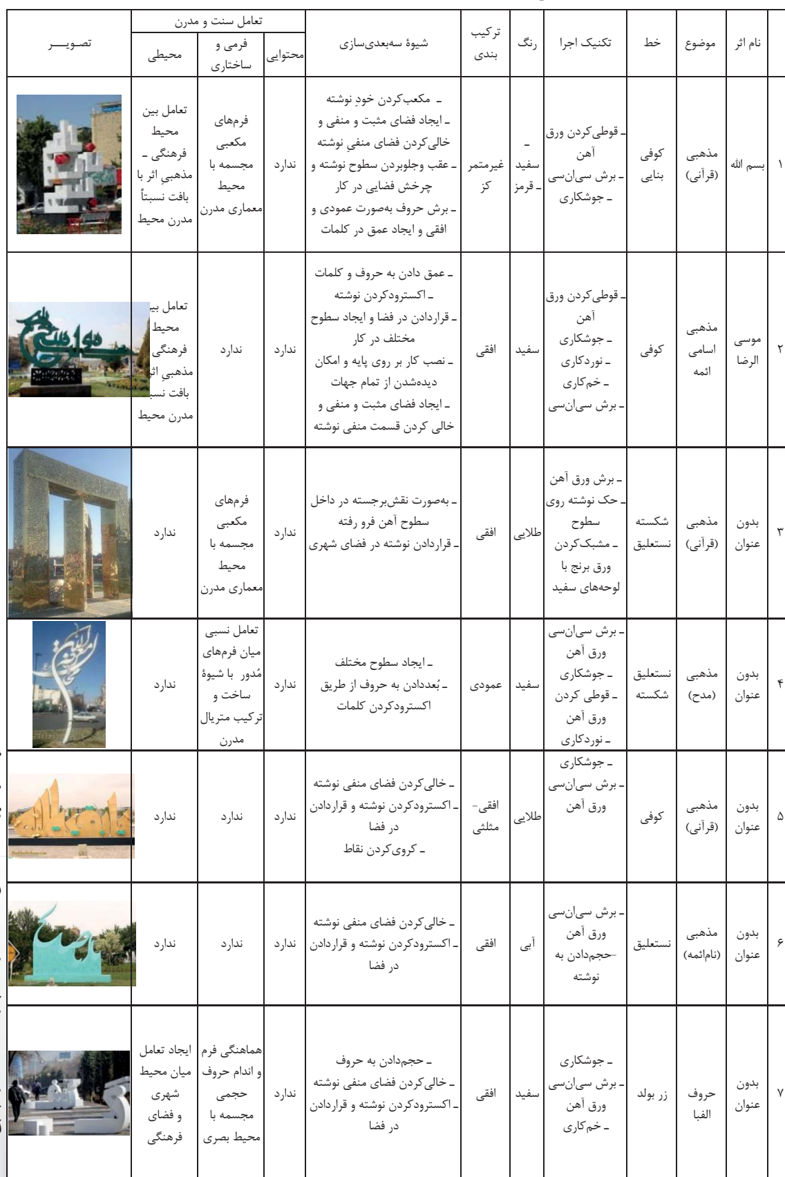
جدول ۱. آثار تایپوگرافی (نوشتاری) اجرا شده در فاصله سال‌های ۱۳۹۰-۱۳۹۴ در شهر مشهد (نگارنده).

جلوه هنر، دوره جدید، سال ۱۲، شماره ۱، بهار ۱۳۹۹، شماره پیاپی: ۲۶