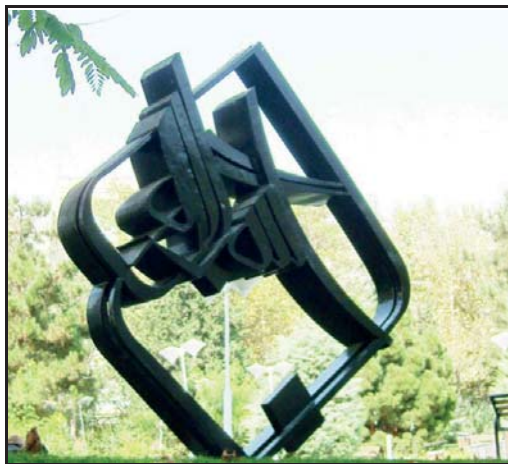
شکل ۳- بسم‌الله، فلز، تهران (نگارنده).

در میانه بالایی مجسمه -که محل انباشت فرم‌هاست- اتصالات میان حروف با کم‌ترین فاصله چیده شده‌اند. چنین تمهیدی تمرکز بصری و سنگینی آن منطقه را بیش‌تر کرده است. ریتم متناوب فرم‌های کشیده و فرم‌های منحنی نیز به جلب توجه منطقه فعال بصری کمک کرده است. از طرفی کادر نقطه نیز باعث گردش و هدایت چشم به این ناحیه می‌شود. خطوط و فرم‌های نرم همراه با کشیدگی‌های سریع و آزاد در برخی نقاط، یادآور نظمی طبیعی است که بسیار چشم‌آشناست. این تنوع فرمیک و ریتم حرکتی را در شاخ و برگ درختانی که در پس‌زمینه این مجسمه حضور دارند نیز می‌توان مشاهده کرد. گویی همان نظم گیاهی است که در قالبی جدید، با مضمونی آشنا، شکل گرفته است.