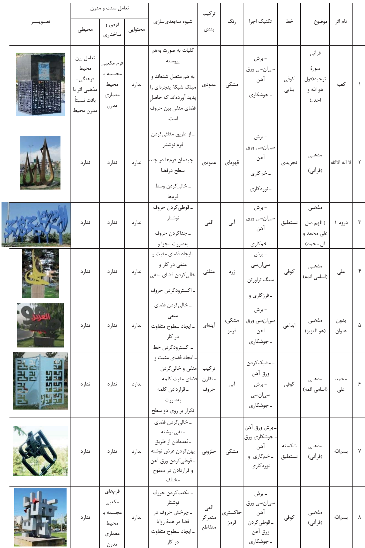
جدول ۲. آثار تایپوگرافی اجراشده در فاصله سال‌های ۱۳۹۰-۱۳۹۴ در شهر تهران (نگارنده).

جلوه هنر، دوره جدید، سال ۱۲، شماره ۱، بهار ۱۳۹۹، شماره پیاپی: ۲۶