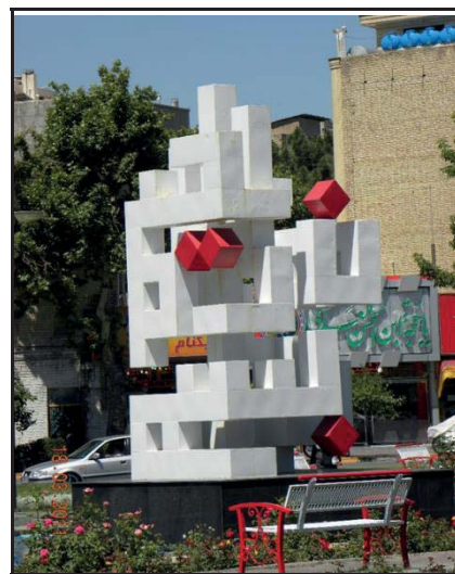
شکل ۲- بسم‌الله الرحمن الرحیم، فلز، مشهد (نگارنده).

تلاش شده تا با قرارگیری مجسمه بر روی سکو و پایه مستقل و با فاصله مناسب ایمنی اثر نیز مدنظر قرار گرفته شود. تنوع ریتم فرم‌ها همراه با تنوع فضاهای مثبت و منفی و نیز تنوع نور و سایه‌ها در اثر، آن را در نهایت، به اثری پویا در چشم مخاطب بدل کرده است. گردش چشم در ترکیب‌بندی اثر، به گونه‌ای طراحی شده که علاوه بر این‌که کلیت مجسمه یک‌جا دیده و درک می‌شود، اجزا و احجام به‌صورت منفرد و غیرپیوسته نیز می‌توانند خوانده شوند. درک دیداری هر اثر چند بُعدی، می‌تواند به‌صورت مشاهده پلکانی و یا ادراک بصری چندمرحله‌ای تحلیل و پردازش شود. از محاسن چنین امری جذابیت و کنجکاوای مخاطبان برای شناسایی و تعامل با اثر هنری است.