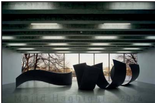
شکل ۴- بسمه، فر، تهران (نگارنده).

ریتم پویا و امکان تغییر فضاهای منفی بین حرکات حروف به واسطه تغییر موضع مخاطب از دیگر ویژگی‌های این تایپوگرافی حجمی است. مرکز ثقل و نقطه عطف این اثر در مرکز ترکیب‌بندی قرار دارد. جایی که سومین ورق تاب‌خورده قرار دارد و سپس، فرم کشیده «سمه» آغاز می‌شود. از آن‌جا که، این مجسمه در فضایی داخلی کار شده، احتمالاً، مخاطبین خاصی هم دارد که شیوه تعامل آن با مخاطب را نسبت به فضاهای شهری متفاوت ساخته است. بدیهی است چنانچه این مجسمه در فضایی غیر از فضای داخلی نصب می‌شد، بسیاری از ویژگی‌های ساختاری و ذاتی خود را از دست می‌داد. در نتیجه، از موفقیت‌های اثر، باید به تناسب و هماهنگی آن با محیط اشاره کرد. ولی چنانچه این اثر بخواهد در فضای شهری و فضاهای عمومی نصب و اکران شود، لازم است به موارد ایمنی آن توجه شود.