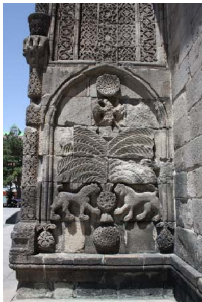
تصویر ۴- نقش مایه درخت زندگی در سردر مدرسه چیفته مناره، ارزروم (نگارنده).