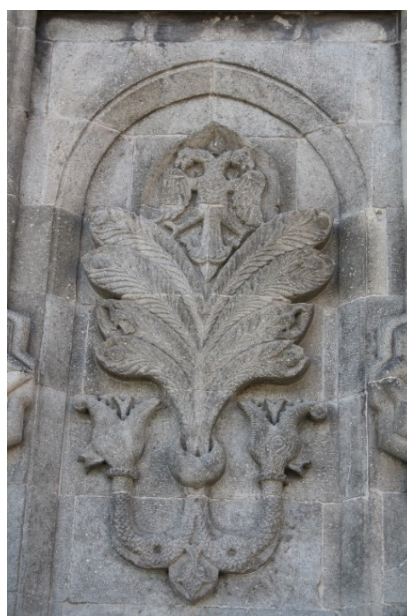
تصویر ۶- نقش مایه درخت زندگی در سردر مدرسه چفته مناره، ارزروم.

سماچتین بر این باور است که ریشه نقش مایه درخت زندگی، در مفهوم جهان و برکت، در هنر این دوره به تأثیر باورهای آسیای میانه بازمی‌گردد (Çetin, 2012: 11,14).