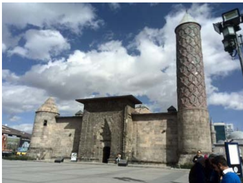
تصویر ۱- نمای کلی مدرسه یاقوتیه و سردر ورودی (نگارنده).

170-167: 2006). تزیینات به کار رفته در سردر ورودی این مدرسه، به شکل حجاری بر روی سنگ، چشم نواز و خیره کننده است. نمونه همین تزیینات را در دیگر سردرهای دوره سلجوقی و ایلخانی می بینیم. این بنا یک مدرسه چهار ایوانی با حیاط مربع مستطیلی است و صحن آن دارای طاق مرکزی مقرنس کاری با روزن گردی است. سه ایوان و چهارده حجره به این صحن باز می شود. در جبهه غربی مدرسه، سردر قرار دارد که از بدنه بنا، بیرون زده است. در محور جبهه شرقی، قاعده مکعبی شکلی با مناره استوانه‌ای خودنمایی می کند. مناره‌ها در اطراف سردر ورودی واقع نشده؛ بلکه به گوشه‌های بنا رانده شده‌اند. احتمال می رود یکی از مناره‌های موجود در سمت چپ بنا یا از بین رفته و یا اصلاً ساخته نشده است (تصاویر ۱ و ۲).