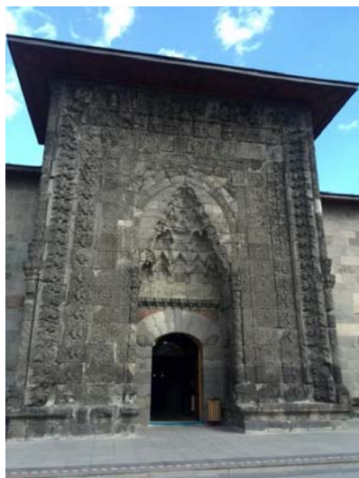
تصویر ۲- سردر مدرسه یاقوتیه.