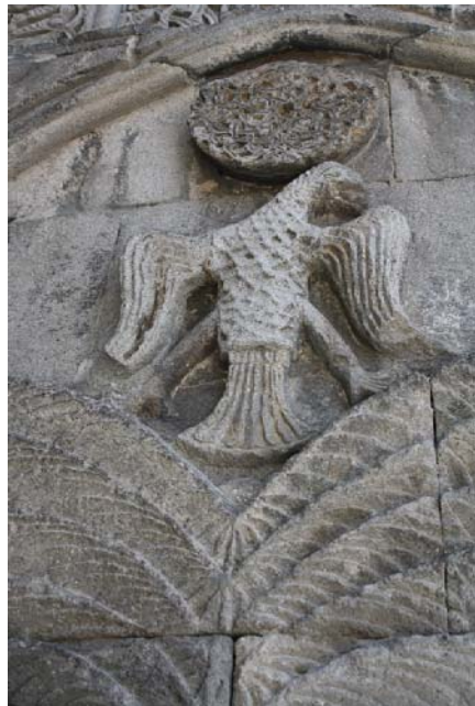
تصویر ۷ - نقش عقاب دوسر (تغییر شکل یافته) بر بالای درخت زندگی، مدرسه یاقوتیه (نگارنده).

شمن نیز هست. چون که شمن به واسطه درختی که زمین و آسمان را به هم مرتبط می‌سازد، به آسمان راه یافته و به اوج می‌رسد. در کنار این مفاهیم، نماد روشنایی و خورشید نیز تلقی می‌گردد (Ibid).