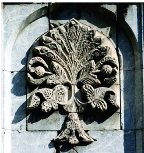
تصویر ۵- نقش درخت زندگی بر سردر ورودی گوک مدرسه شهر سیواس، ۱۲۷۱ م. (URL1).

از منظر کارشناسان، مدرسه یاقوتیه و مدرسه چیفته مناره ارزروم، به عنوان شاهکار معماری دوره ایلخانی، از نظر اسلوب و تزیینات در گروه معماری سلاجقه آناتولی قابل بررسی هستند (Korkutan, 2011: Abstract). اکتای آسلانایا معتقد است که مدرسه یاقوتیه در گروه مدارس گنبددار سلجوقی جای می‌گیرد و این بنا تأثیرات مدرسه سلجوقی چیفته مناره ارزروم را به وضوح منعکس می‌کند (Aslanapa, 1990: 309). در دوره سلجوقیان در آناتولی، نقش مایه درخت زندگی در معماری دینی و غیرنظامی به کرات مشاهده می‌شود. در دوره‌های اولیه، به‌تنهایی و یا احاطه شده توسط پرندگان وجود