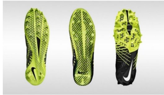
تصویر ۱- نایکی، کفش های با میخ پاشنه های چاپ سه بعدی، ۲۰۱۴ م. (URL7).

و ساخت صفحات سبک در زیر کفش استفاده کرده است (Molitch-Hou, 2014) (تصویر ۱). نایکی با استفاده از چاپ سه بعدی توانست زمان تولید نمونه اولیه و تولید نهایی را از دو تا سه سال به شش ماه کاهش دهد. هم چنین، این برند در سال ۲۰۱۶ میلادی، اولین کیف های ورزشی چاپ سه بعدی را در جام جهانی فوتبال برای سه بازیکن مشهور نیمار جونینور، ۱۷ وین رونی ۱۸ و کریستین رونالدو ۱۹ تولید کرد (Taylor, 2017).