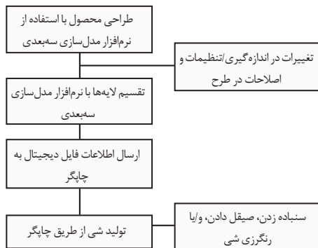
جدول ۱. نمای کلی طراحی و فرایندهای تولید روش های چاپ سه بعدی (Yap & Yeong, 2014: 198)

فرایندهای چاپ سه بعدی با طراحی محصول در نرم افزارهای کد و به طور معمول، یک برنامه مدل سازی سه بعدی مانند راینو ۲۲ آغاز می شود. از طریق تنظیم الگوریتم های محاسباتی، می توان طرح ها را اصلاح کرد، تا بهتر شوند و یا پارامترهای خاص سایز هر یک از مصرف کنندگان را در بر داشته باشند. (Strickfaden et al., 2015: 217) برنامه هایی مانند راینو ابزارهای طراحی پارامتریک را به ویژه برای طراحانی که تجربه کدنویسی ندارند، فراهم می نماید. ابزارهای طراحی پارامتریک دارای کارایی بالاتر و سهولت در کار هستند، به طوری که تغییرات متعدد در یک طراحی را می توان با یک کد واحد ایجاد کرد (Yap & Yeong, 2014: 198). زمانی که مدل سازی کامل شد، نرم افزار محصول را به لایه های افقی تقسیم می کند. سپس، داده ها از فایل به چاپ گر ارسال می شوند و محصول سه بعدی را تولید می کنند. هم چنین، پس از چاپ ممکن است محصول به رنگ پوشی و پولیش نیاز داشته باشد (Mellor et al., 2014: 196). در جدول یک، نمای کلی طراحی و فرایندهای تولید در چاپ سه بعدی نشان داده شده است. بسیاری از چاپ گره های سه بعدی دارای حجم ساخت محدودی هستند که چاپ کل محصول را در یک فرایند واحد دشوار می سازند. به همین دلیل، غالباً، بخش های مختلف محصول به صورت مجزا چاپ می شوند و سپس، با استفاده از چسب ها و یا در هم بافتن و درگیر کردن اجزای نر و مادگی مونتاژ می شوند. (Yap & Yeong, 2014: 198)