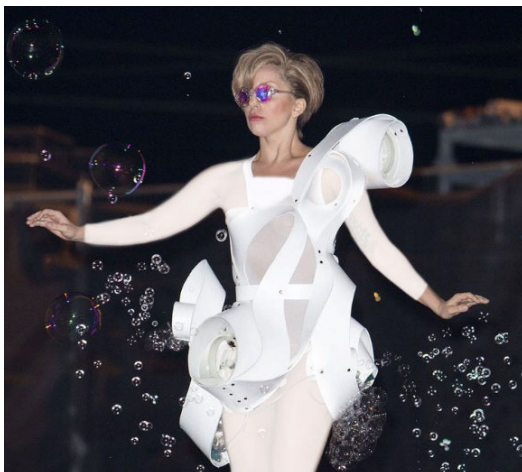
تصویر ۴- لباس شقایق لیدی گاگا، بنجامین میلس، چاپ با چاپگر استریولیتوگرافی (URL4).

شقایق «لیدی گاگا» ۳۱ است (شکل ۴). در داخل این لباس ربات‌های کوچکی برای تولید حباب تعبیه شده است. این طرح توسط بنجامین میلس ۳۲ با همکاری متریا لایز طراحی شده است (Sharma, 2013).