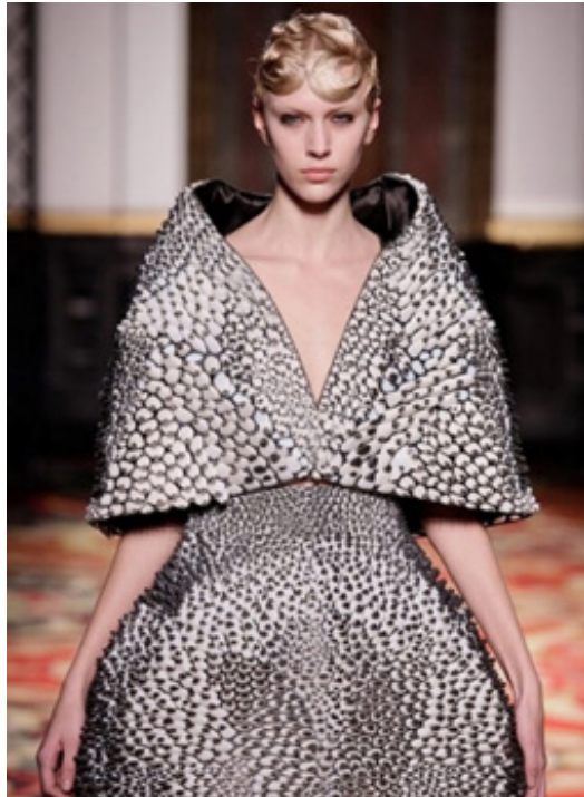
تصویر ۷- شل و دامن، مجموعه ولتاژ، آیریس ون هرین، هفته مُداوت کوتور پاریس، ۲۰۱۳ م. (URL5)

در آن‌ها به کار رفته است. ون هرین این شل و دامن را با همکاری طراح، معمار و پروفیسور نری اکسمن ۴۸ طراحی کرده است (Vanderploeg et al., 2017: 6).