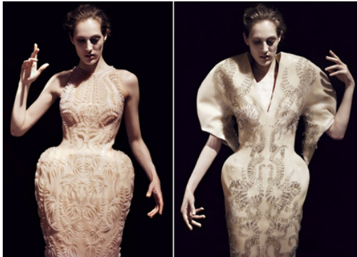
تصویر ۳- مجموعه طبیعت بکر، آیریس ون هرین، هفته مُداوت کوتور پاریس، جولای ۲۰۱۳ م. (URL6).