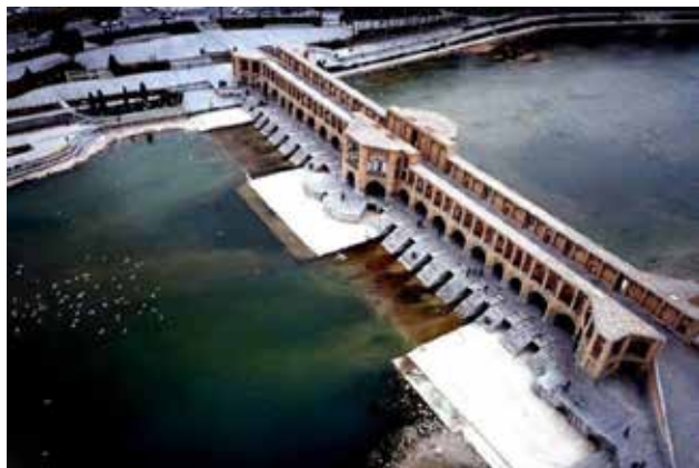
تصویر ۵. ساختار پل خواجو

مسجد جامع محوری‌ترین مکان فعالیت‌های فردی و اجتماعی هر فرد مسلمان محسوب می‌شد و افزون بر آن سرای مسجد جامع به دلیل کمبود فضای عمومی در این دوره نقش فضایی عمومی را ایفا می‌کرد. نقش مسجد جامع در دوران اسلامی با روی کار آمدن حکومت‌های مختلف و بسته به قدرت آنها متفاوت بود (مشهدی‌زاده دهاقانی، ۱۳۹۰، ۲۷۹).