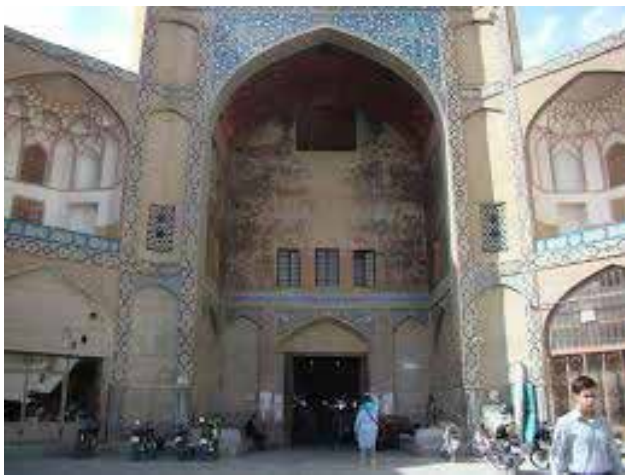
تصویر ۲. سردر بازار قیصریه در ضلع شمالی میدان نقش جهان.

به نظر می‌رسد همبستگی واژه خیابان با ساختار باغ ایرانی و پیوند آن با عنصر آب از ریشه‌های اصلی شکل‌گیری این مفهوم در فرهنگ ایران است (منصوری، ۱۳۹۵). این مفهوم در نظر «ناظم الاطباء» عبارت است از هر کوی راست و فراخ و دراز که اطراف آن درخت و گل باشد و با کوی و شارع هم‌مقصد است (نفیسی، ۱۳۵۵). رویکرد خاص عهد صفوی به خیابان به‌عنوان فضای شهری باغ‌گونه