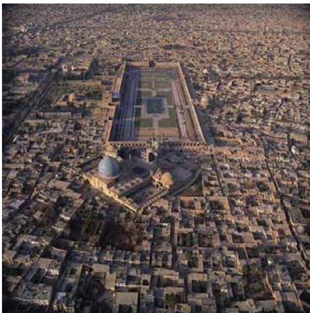
تصویر ۳. موقعیت میدان اصلی در بافت شهری.

به‌مثابه مکانی معنوی-فردی و فردی-جمعی انسانی؛ سوم، میدان و بازار، به‌مثابه مکان زندگی روزمره جمعی انسان‌ها» (فلامکی، ۱۳۷۱، ۱۷).