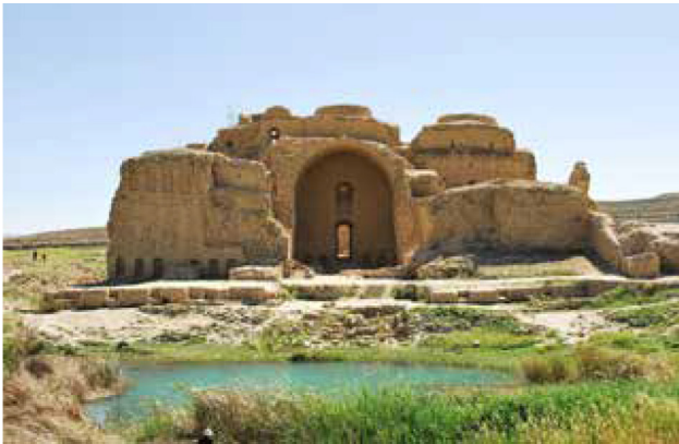
تصویر ۱. کاخ اردشیر، فیروزآباد-فارس.

با نقش برجسته‌هایی از ایزدان مهر، آنهیتا و اهورامزدا در صحنه‌های تاج‌ستانی و شکار شاه به انواع نقش و نگارها و نمادهای طبیعی آراسته شده‌اند. مجموعه این بناهای مذهبی-حکومتی در دل صخره‌های شکوهمند و مقابل چشمه‌ای جوشان واقع شده که درختان کهنسال گرداگرد آنان را دربر گرفته و باغ معبد و شکارگاه شاه را تقدس بخشیده است. نیایش، تاجگذاری و شکار از رسوم و آیین‌های باشکوه شاهان ساسانی بوده که بر سنگ‌نگاره‌هایشان ثبت کرده‌اند. سی و چهار صحنه از نقش برجسته‌های ساسانی در ارتباط با طبیعت از اسناد مهم و باارزش حکومت مذهبی-سیاسی این دوران است که ردپای دین و باورهای طبیعت‌گرای آنان را آشکار ساخته است.