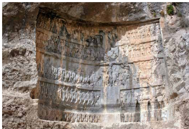
تصویر ۱۰. نقش برجسته تنگ چوگان.