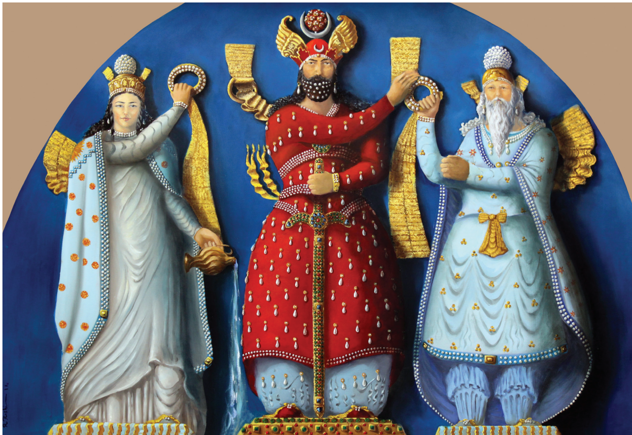
تصویر ۹. نقوش لباس شاهان و ایزدان ساسانی. مأخذ: جوادی و آوزمانی، ۱۳۹۵.