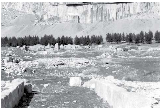
تصویر ۱۱. صفت فرهادتراش.