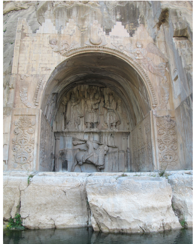
تصویر ۶. تاق بستان.

در گذشته آبی در این مکان جاری بوده و امروز حمام و مسجدی در نزدیکی این مکان وجود دارد که نشان می‌دهد از گذشته تا کنون مکانی محترم بوده و مجاورت آن با آب، ارتباط با آناهیتا، الهه باروری و نگهبان آب‌ها را آشکار می‌سازد. از این مکان با تعلق به دوران اشکانی-ساسانی به عنوان شکارگاه نیز یاد شده است. البته مغایرتی بین شکارگاه و نیایشگاه نیست، زیرا در زمان ساسانی هر دو در کنار هم وجود داشته‌اند. چنانکه