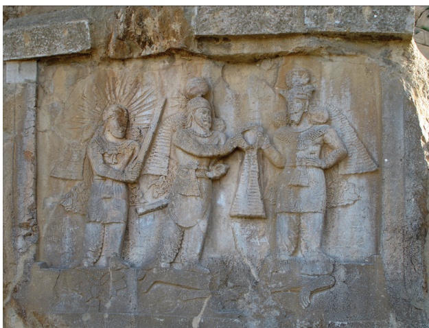
تصویر ۸. تاج‌گیری اردشیر دوم از اهورامزدا با حضور ایزد مهر-میترا.