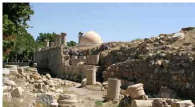
تصویر ۱۲. معبد آناهیتا، کنگاور.