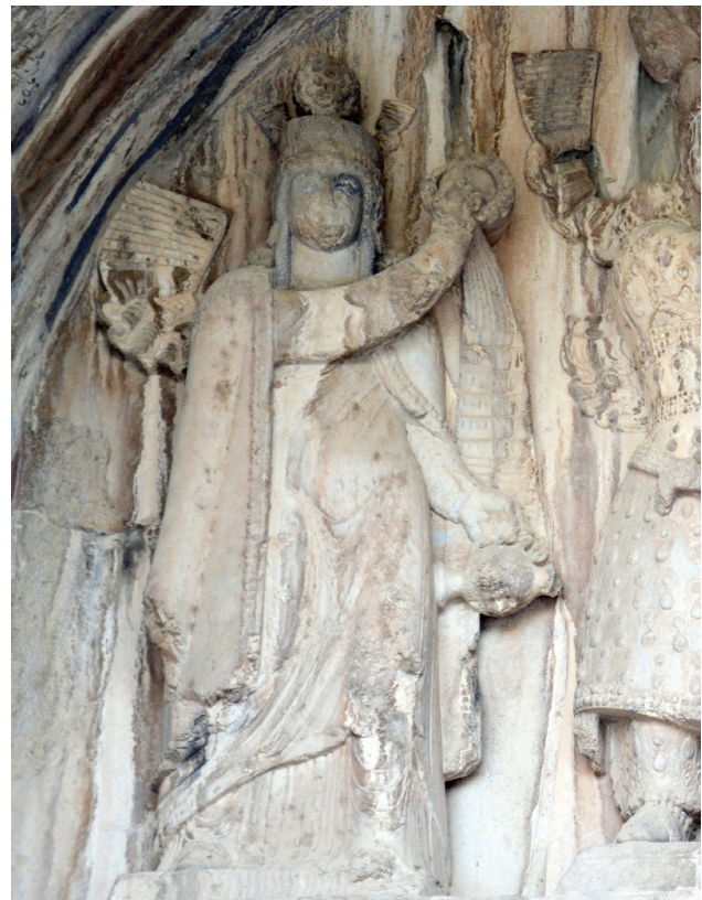
تصویر ۷. ایزدبانو آناهیتا در نقش برجسته تاق بستان با تاجی از مروراید به همراه کوزه آب.