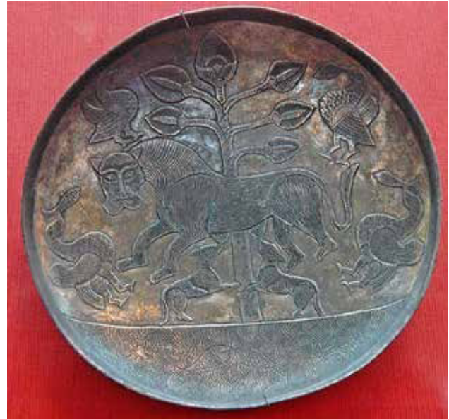
تصویر ۲. ظروف ساسانی با نقوش گیاهی.