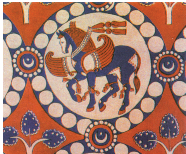
تصویر ۳. نقش اسب و بز با دیهیم و گردنبند مروارید بر پارچه ساسانی.