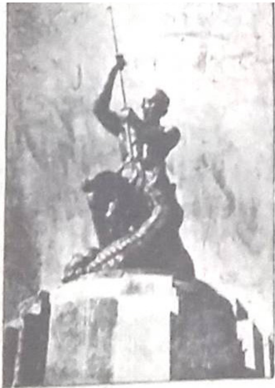
مجسمه سوم اسفند در میدان سوم اسفند ( میدان جاری باغ شاه )

تصویر ۴. اطلاق نام مجسمه گرشاسب در روزنامه اطلاعات.