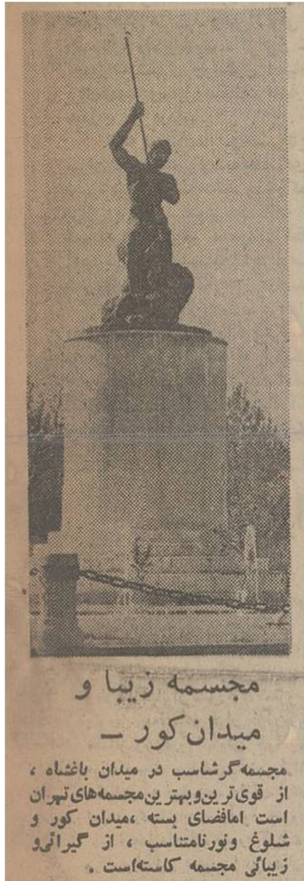
تصویر ۵. تصویر مجسمه با اطلاق نام مجسمه گرشاسب در روزنامه اطلاعات. مأخذ: روزنامه اطلاعات، ۲۷ فروردین ۱۳۵۴، ۵.