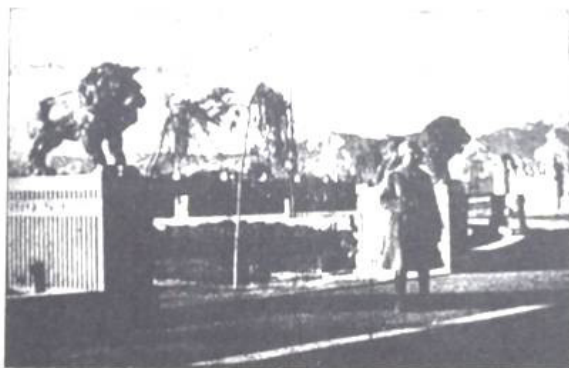
در انهای خیابان شیر میدان حلوی باغ شاه

• نگارنده در بررسی آرشیو «سازمان اسناد و کتابخانه ملی