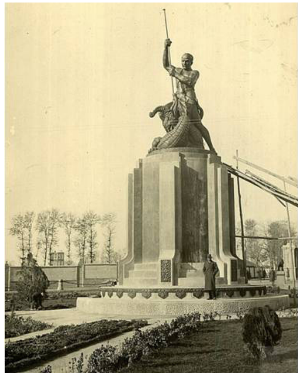
تصویر ۲. عکسی برداشت‌شده از میدان حر فعلی تهران که تاریخ آن (۱۴/۱۰/۱۲) در پشت عکس مشهود است.