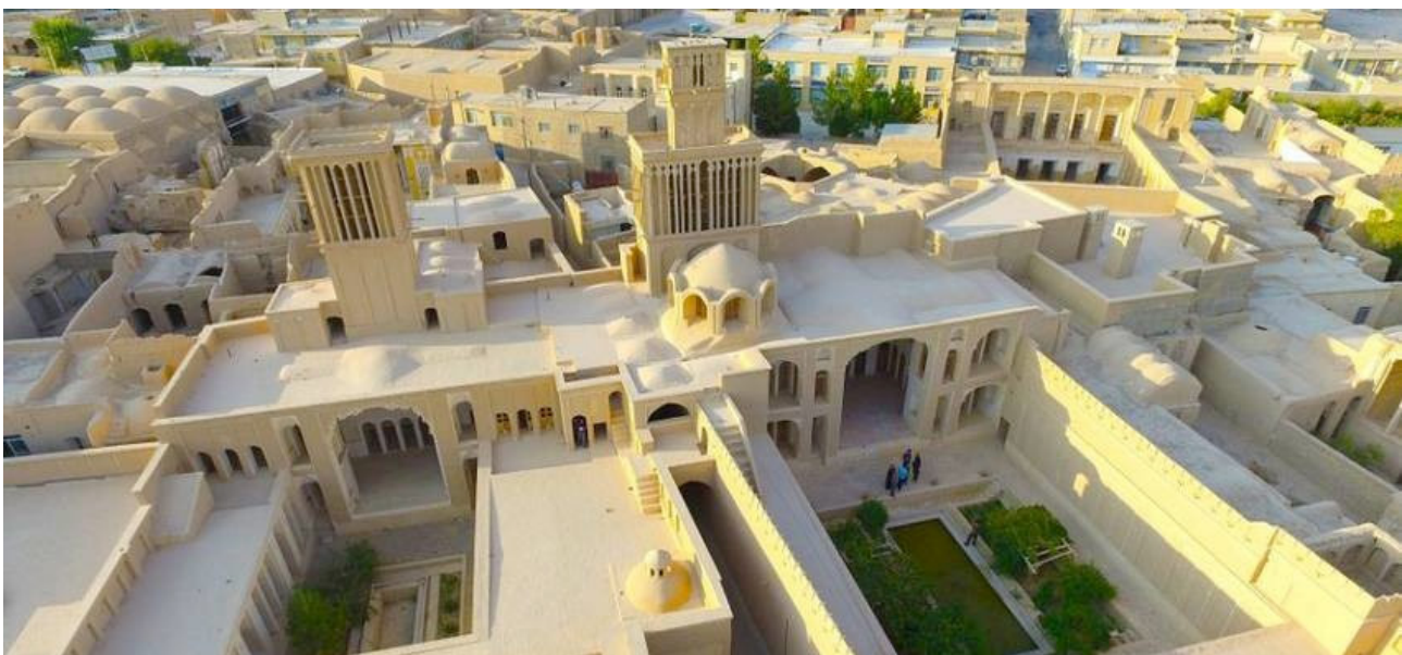
تصویر ۱۱. کیفیت‌های فضایی بام؛ بخشی از بافت مسکونی شهر ابرکوه.