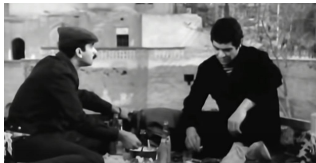
تصویر ۷. بام به عنوان فضای تعامل و صرف غذا در کنار هم، یکی از سکانشی‌های فیلم سینمایی غریبه (کارگردان: شاپور قریب- سال ساخت: ۱۳۵۱).