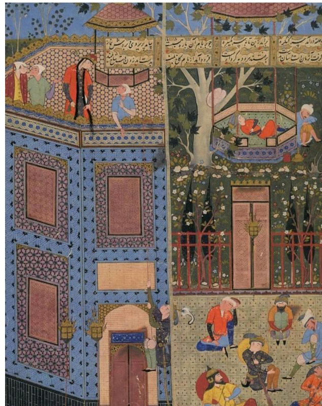
تصویر ۳. به تصویر کشیدن داستان زال و رودابه از شاهنامه فردوسی، رودابه برفراز بام.

تأکید کرد که سینما همچون بسیاری از رسانه‌های ارتباط جمعی از جمله عواملی است که بخشی از تخیل ما درباره شهر از طریق آن رقم می‌خورد و می‌تواند به تخیل ما در باب شهر سامان بخشد (رادورد و محمودی، ۱۳۹۴). لذا، یکی از منابع بسیار مهم جهت بازشناخت فضای بام و نقش‌های آن در شهرهای ایرانی و زندگی روزانه مردم، آثار سینمایی معاصر است چرا که بسیاری از آن‌ها در ارتباط با زندگی عامه مردم و وقایع جاری در خانه‌های آن‌ها بوده است. فیلم‌های سینمایی زیادی با محوریت فضای خانه، خصوصاً بام خانه‌های ایرانی در سینمای معاصر ایران ساخته شده است که چند مورد از آن‌ها همچون طوقی، غریبه و کاکو در این پژوهش مورد بررسی قرار گرفته است. از جمله صحنه‌های پرتکرار در این فیلم‌ها، صحنه‌های نشان دهنده پرواز دسته جمعی کبوترها بر فراز بام یا ارتباط ساکنان خانه با کبوترهاست که از بارزهای نقش