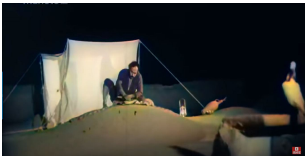
تصویر ۸. برپایی پشه‌بند و خوابیدن اعضای خانواده روی بام، سکانشی از فیلم طوقی (کارگردان: علی حاتمی- سال ساخت: ۱۳۴۹). مأخذ: نماگرفت از فیلم طوقی.