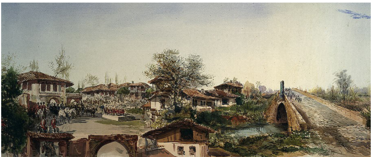
تصویر ۲. تأکید بر فرم و رنگ بام و تصویر هماهنگ شهر در نقاشی پاول پیاستسکی، نقاش روس، از شهر رشت.