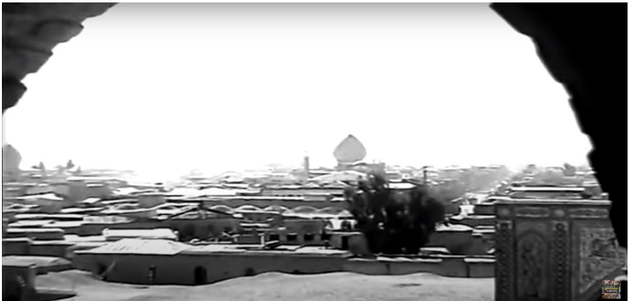
تصویر ۹. جایگاه بام‌ها در تصویر شهر در یکی از سکنس‌های فیلم قدیمی کاکو (کارگردان: شاپور قریب - سال ساخت: ۱۳۵۰).