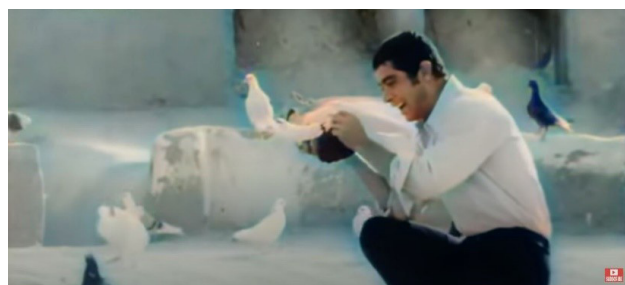
تصویر ۵. بام به عنوان بستری جهت ارتباط ساکنان با طبیعت، سکانشی از فیلم طوقی (کارگردان: علی حاتمی- سال ساخت: ۱۳۴۹). مأخذ: نماگرفت از فیلم طوقی.