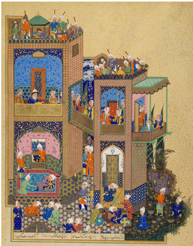
تصویر ۴. به تصویر کشیدن داستان ضحاک و کاوه آهنگر از شاهنامه فردوسی.