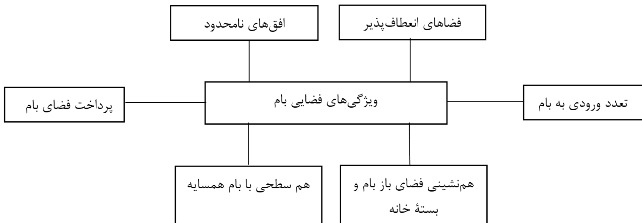
تصویر ۱۰. ویژگی‌های فضایی بام که نشان از نقش‌های هویتی، اجتماعی و ارتباط با طبیعت دارند.

فضاهای انعطاف‌پذیر: در عین توجه به کیفیت‌های فضایی از جمله ایجاد دسترسی مناسب، پرداخت فضاهای روی بام (از جمله بادگیر و خیش‌خون)، بام‌ها دارای فضایی انعطاف‌پذیر جهت فعالیت‌های گوناگون اهل خانه همچون صرف شام،