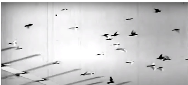
تصویر ۶. پرواز کبوترها در آسمان شهر و بر فراز بام‌ها، سکانشی از فیلم کاکو (کارگردان: شاپور قریب- سال ساخت: ۱۳۵۰).