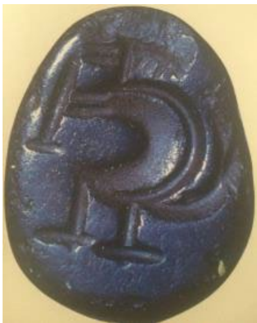
شکل ۳۳- مهر نگین از سنگ سیاه منبع (Ayazi et al., 2004)

با آنکه باقی‌مانده‌های آثار منقوش متعلق به دوران ساسانیان چندان فراوان نیست و دست روزگار بیش‌ترین این آثار را محو ساخته است با این‌همه هنوز در داخل مرزهای کنونی ایران و در دیگر نقاطی که در عصر ساسانی یا مستقیماً جزء ایران بوده و یا در قلمرو فرهنگی ایران قرار داشته است کم‌وبیش نمونه‌های اصیلی‌ای باقی‌مانده است که بر اساس نظر پژوهندگان و با توجه به مدارک باستان‌شناسی می‌توان آن‌ها را بدون تردید متعلق به دوران شاهنشاهی ساسانیان داشت.