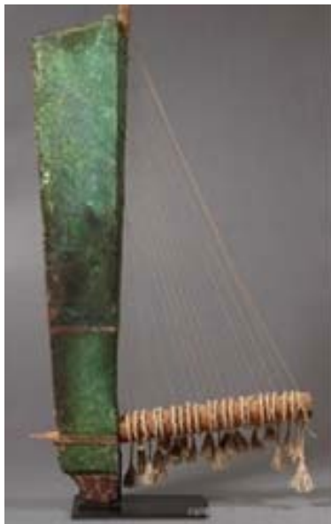
چنگ بازسازی شده مربوط به زن چنگ‌نواز بیشاپور (www.louvre.fr/en/oeuvre-notices/angle-harp, 2020)