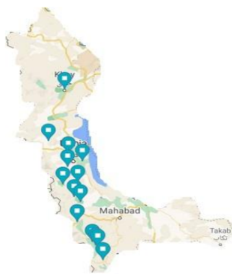
شکل ۱- نقشه موقعیت جغرافیایی نمونه‌های جدا شده

در این مطالعه تعداد ۶۷ جدایه اندوفیت باکتریایی از دوازده منطقه واقع در استان آذربایجان غربی شامل دیزج، اشنویه، پیرانشهر، زینالو، علیان، بزبله، یلوکه، ده گرجی، گچی، خوی، قطورلار، سردشت و امامزاده جدا شدند. در شکل زیر مناطق جداسازی نمونه‌ها بر روی نقشه استان نشان داده شده است (شکل ۱)