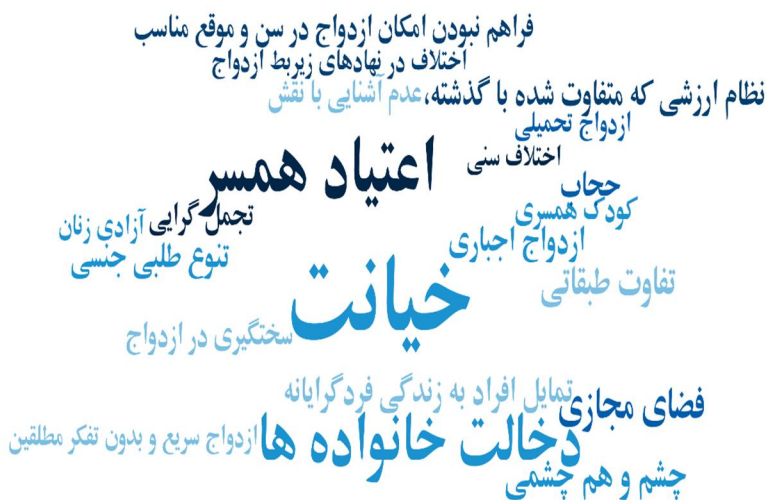
جدول (۴): فرایند فهرست موضوعات و مفاهیم مربوط به علل فرهنگی طلاق

در ذیل ابر واژگان علل اجتماعی طلاق آمده است. همان‌طور که مشاهده می‌شود عللی چون خیانت، اعتیاد همسر و دخالت خانواده‌ها مهم‌ترین دلایل اجتماعی طلاق از منظر صاحب‌نظران است.