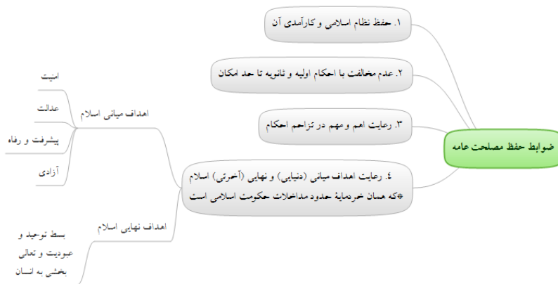
شکل ۳. ضوابط حفظ مصلحت عامه (دانایی فرد و جوانعلی آذر، ۱۳۹۵)

سؤال بعدی این است که چگونه مصلحت عامه حفظ می‌شود. حفظ مصلحت جامعه‌ی اسلامی، ضوابطی دارد: