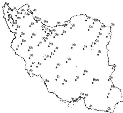
شکل ۱: موقعیت ایستگاه‌های مورد مطالعه

پایه‌های زمانی متداول در شاخص بارش استاندارد عبارتند از ۳، ۶، ۱۲، ۲۴، و ۴۸ ماه که معمولاً بصورت میانگین متحرک بر اساس فرمول زیر محاسبه می‌شود. برای مثال در مورد شاخص بازه سه ماهه شاخص استاندارد به این صورت محاسبه می‌شود: