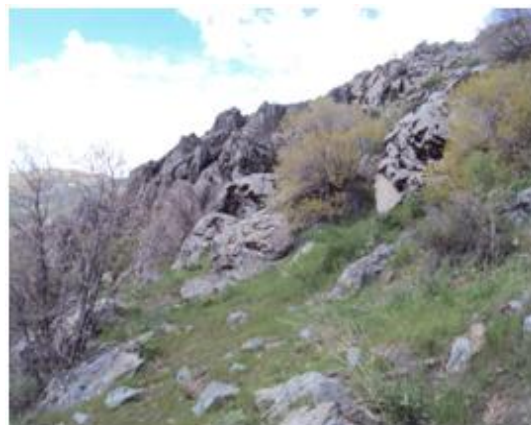
شکل ۴. زیستگاه A. c. urmiana با پوشش علفی و درختی