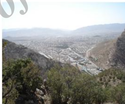
شکل ۳. زیستگاه A. c. urmiana در جنگل‌های بلوط منطقه حفاظت شده مانشت و قارنگ در استان ایلام

سطح دریا‌های آزاد را در بر می‌گیرند و واجد تخته‌سنگ‌ها و صخره‌هایی بزرگ با درزها و شکاف‌های عمیق، آمیخته با رویش و پوشش گیاهی، خصوصاً خانواده‌های گیاهی Rosaceae و Graminaceae، می‌باشند (شکل ۳ و ۴). این مکان‌ها و موقعیت‌ها شامل: 25^{\circ} N و 37^{\circ} E و 1500m (آذربایجان غربی، نواحی غربی دریاچه ارومیه (دریاچه رضائیه)، بر اساس Anderson, 1999)، 21^{\circ} N و 35^{\circ} E و 1200m (کردستان، روستای قلعه-جی)، 23^{\circ} N و 33^{\circ} E و 1400m (کرمانشاه، کوه‌های طاق بستان) و 25^{\circ} E و 41^{\circ} N و 33^{\circ} E و 1860m (ایلام، منطقه حفاظت شده مانشت و قارنگ) می‌باشد (شکل ۱). در مکان‌های ثبت شده فوق برای این زیرگونه، تاکسون‌های دیگری از قبیل Timon Asaccus kurdistanensis و Laudakia nupta princeps kurdistanica و nupta و Trachylepis aurata transcaucasia به صورت هم‌جا (سیمپاتریک) با زیرگونه مورد بررسی، زیست می‌کردند.