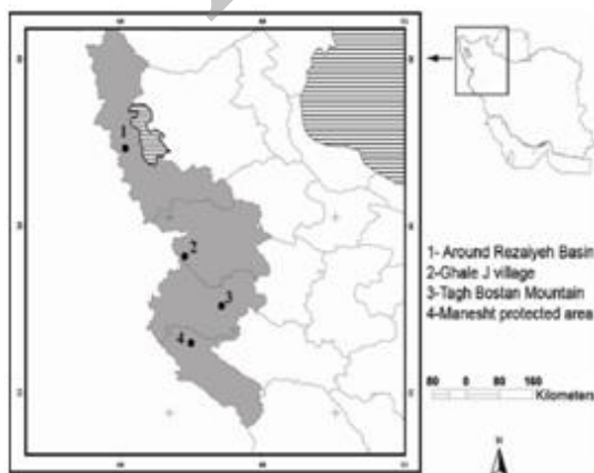
شکل ۱. نقشه پراکنش A.c. urmiana

در نمونه‌برداری‌های گسترده در طول سالهای ۲۰۱۰ تا ۲۰۱۳، نمونه‌ها توسط مؤلفین در استان‌های کردستان، کرمانشاه و ایلام گردآوری شدند (شکل ۱) و در موزه جانورشناسی دانشگاه رازی (RUZM) و موزه جانورشناسی مرکز بین‌المللی علوم و تکنولوژی پیشرفته و علوم محیطی کرمان (ICSTZM) تثبیت و نگهداری می‌شوند. بعد از بررسی الگوی رنگ، طرح بدنی و عکسبرداری از نمونه‌های زنده، نمونه‌ها در الکل ۷۵٪ نگهداری شدند. سپس از محیط زیست جاندار نیز عکسبرداری صورت گرفت و موقعیت مکانی زیستگاه یادداشت و گیاهان غالب منطقه جمع‌آوری گردید. در مجموع ۵ نمونه از چهار منطقه نمونه‌برداری از لحاظ مورفولوژیکی مورد بررسی قرار گرفتند. داده‌های مورفومتریک توسط استریومیکروسکوپ و کولیس دیجیتال با دقت یک صدم و صفات مورفومتریک زیر برای هر نمونه اندازه‌گیری شد: طول پوزه تا مخرج (SVL)، از نوک پوزه تا لبه خلفی فلس مخرجی؛ طول دم (TL)، از لبه خلفی فلس مخرجی تا انتهای دم؛ طول سر (HL)، از نوک پوزه تا لبه خلفی حفره گوشه؛ عرض سر (HW)، طول عریض‌ترین نقطه سر؛ تعداد ردیف‌های فلس‌های پشتی (NDS)، قابل اندازه‌گیری در سطح وسط پشتی بین اندام‌های عقبی و جلویی؛ نسبت اندام‌های جلویی و عقبی (FoL/HiL)، به ترتیب از ابتدای شانه تا انتهای انگشت چهارم دست و از ابتدای ران تا انتهای انگشت چهارم پا؛ ردیف فلس‌های شکمی (RVS)، در ردیف‌های طولی راست در سطح شکمی؛ تعداد فلس‌های یقه (CS)؛ تیغه‌های زیر انگشتی دست و پا (FTL & FFL)، قابل شمارش در سطح شکمی انگشت چهارم دست و پا؛ منافذ رانی (NFP)، تعداد منافذ رانی در سمت راست.