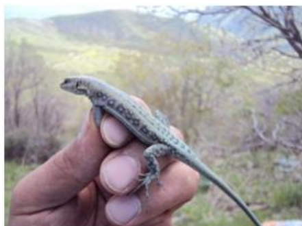
شکل ۲. نمای جانبی بدن A. c. urmiana

مایل به آبی، اولین و هشتمین ردیف‌های فلس‌های شکمی در سطح وسط شکمی دارای لکه‌های سیاه بر روی آنها، سطح شکمی اندام‌های عقبی مایل به آبی، دم در سطح پشتی خاکستری و یا سفید مایل به آبی و در سطح شکمی آبی روشن، نوارهای مورب سطح پشتی در روی دم تبدیل به لکه‌هایی شده و ایجاد سه نوار تیره بر روی دم در سطح پشتی و جانبی (شکل ۲). در زمان حیات و بلافاصله پس از مرگ رنگ زمینه سطح پشتی خاکستری براق و لکه‌های آبی پررنگ و براق بر روی پهلوها بعد از انداختن داخل محلول الکل ۹۶٪ به لکه‌های آبی تیره تغییر می‌یابند.