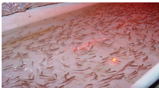
شکل ۲. مرحله شناور شدن بچه ماهی

پس از طی مراحل تکوین تخم‌ها و جذب کیسه زرده، بچه ماهی بر روی آب شناور می‌شد و در این مرحله جهت جلوگیری از کاهش تراکم، بچه ماهیان موجود در سینی به داخل تراف منتقل شدند و با غذای آغازی تجاری استاندارد-SFT00-تغذیه شدند (شکل ۲). لازم به ذکر است که بچه ماهیان تا پایان کارهای آزمایشگاهی تحت تیمارهای نور رنگی ذکر شده بودند و هر تیمار دو مرتبه مورد آزمایش و بررسی قرار گرفتند.