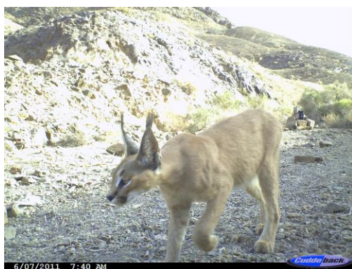
شکل ۲. کاراکال در پارک ملی سیاهکوه.

استان یزد به دست آمد. این تعداد رکورد شامل ۳۶ تصویر به دست آمده از دوربین‌گذاری تله‌ای در ۳ منطقه تحت مدیریت محیط زیست در استان یزد، ۵۴ مورد مشاهده مستقیم کاراکال در نقاط مختلف استان و ۶ مورد لاشه کاراکال تلف شده بود. بر اساس مشاهدات مستقیم ثبت شده انتشار کاراکال در پارک ملی و منطقه حفاظت شده سیاهکوه اردکان، منطقه حفاظت شده کالمنده-بهداران مهریز، منطقه شکارممنوع آریز بافق، منطقه شکارممنوع مرور میبد، پناهگاه حیات وحش نایبندان طبس، منطقه حفاظت شده باغ شادی خاتم، شهرستان تفت: جاده یزد-دهشیر (۵ کیلومتری قبل از دهشیر) و پشتکوه، شهرستان ابرکوه: کیلومتر ۴۵ جاده ابرکوه - مروست و شهرستان مهریز: کیلومتر ۵۸ جاده مهریز- خاتم قطعی است. خلاصه نتایج دوربین‌گذاری‌های تله‌ای در جدول ۱ آمده است. بر اساس جدول یادشده علیرغم اینکه در پناهگاه حیات وحش نایبندان تلاش دوربین‌گذاری بیشتر بوده اما بیشترین تصویر کاراکال از پارک ملی و منطقه حفاظت شده سیاهکوه به دست آمده است. در مجموع شاخص فراوانی نسبی کاراکال در ۳ منطقه دوربین‌گذاری شده با لحاظ میزان تلاش دوربین‌گذاری، در پارک ملی و منطقه حفاظت شده سیاهکوه بیشترین بود.