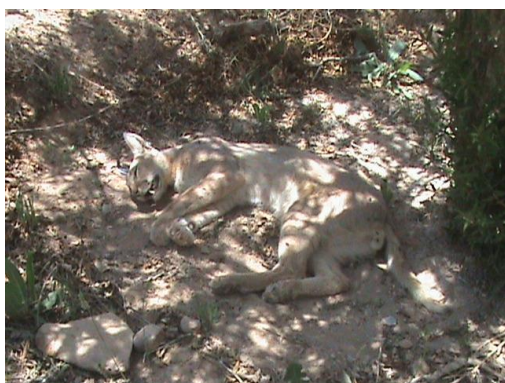
شکل ۱. کاراکال تلف شده در اثر جراحت ناشی از سیخ تشی

در این مطالعه جمعاً ۶ مورد تلفات کاراکال مستند شد که مهمترین علت تلفات، تصادفات جاده‌ای بود (۳ مورد از ۶ مورد). دلیل مرگ یک قلاده کاراکال نامشخص، یک مورد مصرف طعمه مسموم و مورد دیگر جراحت ناشی از برخورد سیخ‌های تشی بوده است.