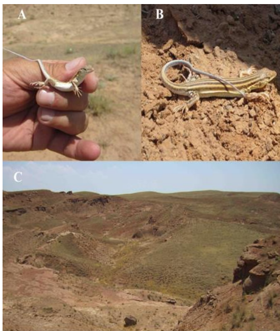
شکل ۲- تصویر A و B مربوط به E. pleski و C زیستگاه آن

از این جنس فقط دو گونه E. strauchi (شکل ۱) و E. pleski (شکل ۲) در این منطقه مشاهده شد.