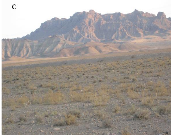
شکل ۱. تصویر A و B مربوط به E. strauchi و C زیستگاه آن

خانواده لاسرتیده Lacertidae Cope, 1864 از این خانواده جنس‌های Eremias , Darevskia , Ophisops و Lacerta Iranolacerta در استان آذربایجان شرقی مشاهده و جمع‌آوری شده‌است که در زیر به شرح آنها پرداخته می‌شود.