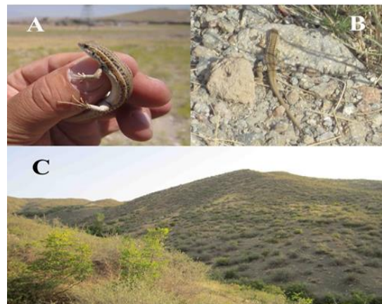
شکل ۴. تصویر A و B مربوط به O. eleganse و C زیستگاه آن

این گونه از گونه‌های فراوان در این منطقه بوده و از مشخصات بارز این گونه می‌توان به پوزه کوتاه‌تر از پهنای سر و تحلیل رفتن فلس‌های ناحیه یقه اشاره کرد. سطح فوقانی بدن مایل به قهوه‌ای با دو نوار جانبی پشتی روشن است که در قسمت فوقانی از حاشیه بالای مژه‌ای تا دم امتداد می‌یابد. در این گونه نوزادهای تازه از تخم بیرون آمده با نوارهای مشخص زرد روشن و قهوه‌ای شکلاتی است (شکل ۴).