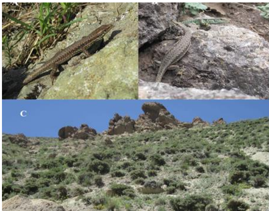
شکل ۳. تصویر A و B مربوط به D. raddei و C زیستگاه آن