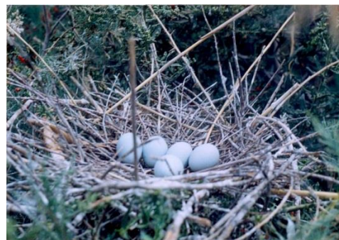
شکل ۱. تخم و آشیانه اگرت کوچک E. garzetta در جزیره علی سیاه