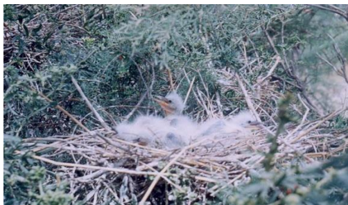
شکل ۲. جوجه‌های تازه تفریح‌شده اگرت کوچک E. garzetta در مرحله Nestling در جزیره علی سیاه- دوره‌ای که جوجه تازه تفریح شده و بدن آن کرکی است و قادر به حرکت در آشیانه نمی‌باشد- جوجه‌های کمتر از ۸ روزه