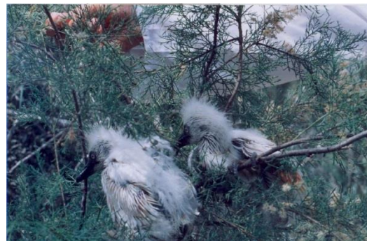
شکل ۳. جوجه‌های اگرت کوچک E. garzetta در مرحله Post-nestling - دوره‌ای که کرک‌های بدن از بین رفته و پرهای جدید شروع به رشد نموده و جوجه قادر به پرواز نیست ولی می‌تواند از آشیانه حرکت نموده و در محدوده‌های اطراف آشیانه جابه‌جا شود - جوجه‌های ۱۵-۲۵ روزه

تلفات در مراحل مختلف تولید مثل اگرت کوچک بیشترین تلفات در مرحله قبل از تفریح به میزان ۲۵٪ ( n=25 )، در مرحله Nestling ۱۰٪ ( n=10 ) و در مرحله Post-Nestling ۳٪ ( n=3 ) محاسبه گردید (نمودار ۱). بر اساس نتایج آزمون فریدمن، اختلاف معنی‌داری در میزان تلفات در مرحله قبل از تفریح، Nestling و Post-Nestling وجود داشت (هریک p=0.05 ). در اگرت کوچک E. garzetta و در ارتباط با دستجات مختلف تخم، بیشترین تلفات در مرحله قبل از تفریح تخم، Nestling و Post-nestling به ترتیب ۱۲ درصد در دستجات ۴ تخمی، ۷ درصد و ۲ درصد در دستجات ۳ تخمی بوده است. با توجه به موقعیت جغرافیایی جزیره بیشترین تلفات به دلیل عوامل طبیعی رخ داده است (جدول ۳).