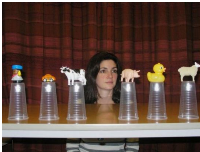
شکل 1. آزمون فرد مشاهده‌گر و محرک‌های هدف.

آزمودنی را دنبال کرده و میزان دقت آن 0/5 درجه زاویه چشم و نمونه‌گیری این دستگاه نیز 50 هرتز است. وضوح فضایی 0/2 درجه و میزان خطا 0/3 درجه است. دستگاه ردیاب چشم برای هر آزمودنی به‌طور جداگانه کالیبره می‌شود. محرک کالیبره‌کننده نقطه‌ای قرمز رنگ است که ابتدا در مرکز صفحه قرار دارد. به محض اینکه فرد به آن خیره شد با فشار دادن دکمه توسط آزمونگر در صفحه مانیتور جابه‌جا می‌شود و آزمودنی باید آن را با نگاهش دنبال کند، به محض اینکه نگاه وی روی نقطه قرمز خیره شد جای نقطه تغییر می‌کند. در مجموع، کالیبره کردن نیازمند نگاه با دقت فرد به مکان نقطه در پنج جای متفاوت روی صفحه‌نمایش است. به محض اتمام کالیبره شدن، آزمایش آغاز می‌شود.