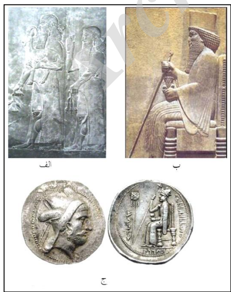
لوح ۲. نقش نیایشگر

جهانداری ساسانی به دنیا عرضه شود. در این راستا می‌توان ادعا نمود که نمادهای سیاسی و مذهبی به کار رفته در سکه‌های فرترکه به سان هم معنی و مفهوم می‌یابد.