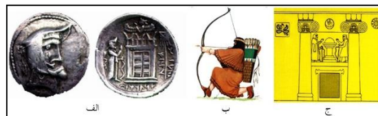
لوح ۳. کمان

لوح ۲- نقش نیایشگر : الف- گوردخمه اسحاق‌وند. ب- گوردخمه دکان داود. ج- گوردخمه قیزقاپان (سرفراز، ۱۳۸۰، ۶۹). د- مهر دوره هخامنشی (امیری نژاد، ۱۳۹۱، ۱۶۴). ی- سکه اردشیر اول (موزه بانک سپه شماره ۱۰۸۷۶)