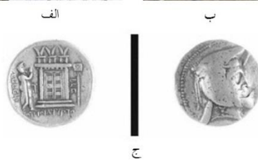
لوح ۴. سازه مقدس