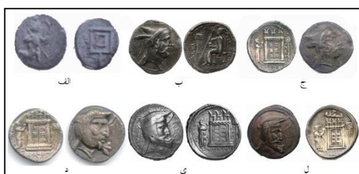
لوح ۶. پرچم

لوح ۱- شاه نشسته بر تخت با گل لوتوس در دست : الف- نقش برجسته خورش آباد (مجیدزاده، ۱۳۸۰). ب- داریوش