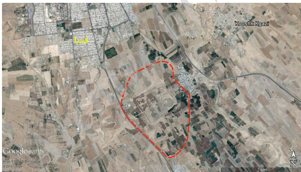
محدوده تقریبی شهر باستانی فسا