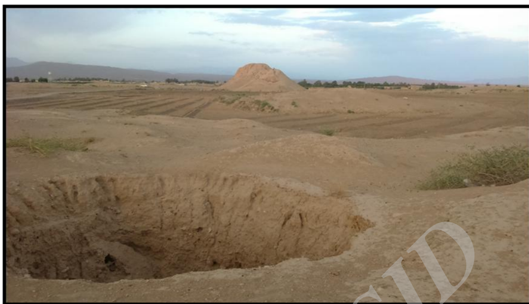
شکل ۲. محوطه تل ضحاک فسا، دید از غرب. (نگارندگان)