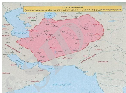
(اخباری؛ نامی، ۱۳۸۸: ۱۰۴)

و نقشه‌های آن بسیار واضح و گویاست. وضوح این نقشه‌ها به دلیل زمینه کدر و رنگ صورتی محدوده قلمرو حکومت‌هاست و به همین جهت مرجع مناسبی برای پژوهشگران جغرافیای تاریخی است. نقشه تاریخی حکومت طاهریان، که در ادامه می‌آید، برگرفته از این کتاب است.