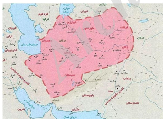
(نقشه پیشنهادی جدید برای مرزهای تصحیح شده حکومت طاهریان بر پایه نقشه موجود در کتاب جغرافیای مرز، تألیف محمد اخباری و محمدحسن نامی)

شناسایی شده‌اند (ابن‌خردادبه، ۱۸۸۹م: ۳۴-۳۷). در نقشه طاهریان در اطلس‌های ایرانی، شهرهای بست، قندهار و مولتان در شمار شهرهای تابع طاهریان قلمداد شده است؛ در حالی که بر اساس گزارش منابع مکتوب کهن و استدلال‌های ارائه شده در این مقاله، به ویژه در بخش سرحدات شرق و جنوب‌شرقی، شهرهای پیش‌گفته را نمی‌توان متعلق به جغرافیای سیاسی طاهریان دانست. همچنین در گزارش ابن‌خردادبه نام جزیره هرموزی در میان شهرهای باج‌گزار حکومت طاهریان وجود ندارد و نمی‌توان نقشه‌های موجود که مرزهای طاهریان را تا این بندر امتداد داده‌اند، مستند دانست. بر این اساس نقشه دیگری طراحی و پیشنهاد شده است که مرزهای شرقی و جنوب‌شرقی حکومت طاهریان در آن تصحیح و بازترسیم شده است. لازم به توضیح است که نقشه پیشنهادی، برگرفته از نقشه طاهریان موجود در کتاب جغرافیای مرزهاست که با اندکی اصلاحات در بخش جنوب‌شرقی آن، دوباره ترسیم شده است.