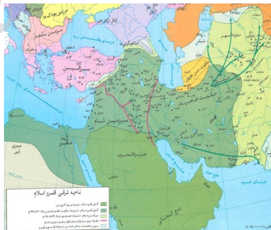
(مونس، ۱۳۸۵: ۲۶۲)

اطلس تاریخ اسلام، اثر حسین مونس، از مشهورترین و معتبرترین اطلس‌های عربی است که نقشه‌های آن بیانگر سیر گسترش اسلام در همه مناطق جهان است. بخشی از نقشه‌های این اطلس به دولت‌های اسلامی مستقر در ایران اختصاص یافته است. با اینکه مونس، در نخستین نقشه مربوط به ایران، به حکومت طاهریان توجه نشان داده اما وی سیر گسترش اسلام در طول ۲۰۰ سال نخست را با حوزه قلمرو طاهریان در یک نقشه ترسیم کرده است. همین مسئله سبب شده تا نقشه وی ترکیبی و کلی و فاقد دقت لازم شود.