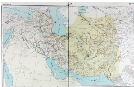
(اطلس تاریخی ایران، ۱۳۵۰: ۹)

اطلس تاریخی ایران، نخستین اطلس بزرگ ایرانی است که در سال ۱۳۵۰، با همکاری گروهی پرشمار از پژوهشگران معاصر، تدوین شد. یک نقشه از این مجموعه به جغرافیای تاریخی حکومت طاهری اختصاص یافته است. اطلس ملی ایران که در سال ۱۳۷۸ ش، توسط سازمان نقشه‌برداری کشور تهیه و منتشر شد نیز در بیشتر موارد مبتنی بر الگوی نقشه‌های اطلس یادشده است.