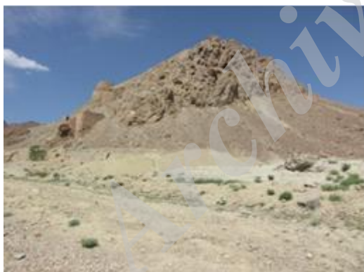
تصویر ۴- نمای عمومی دژ منصورکوه

خود را تقویت کردند و از سوی دیگر به اقتصاد سلجوقیان ضربه بزرگی وارد ساختند.