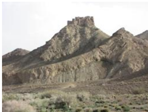
تصویر ۵- نمای عمومی دژ ساروی بزرگ

لمتون، آن (۱۳۹۶). تداوم و تحول در تاریخ میانه ایران. ترجمه یعقوب آژند. چاپ پنجم. تهران: نشر نی.