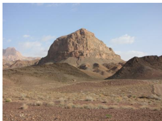
تصویر ۳- نمای عمومی دژ مهرین (مهرنگار)