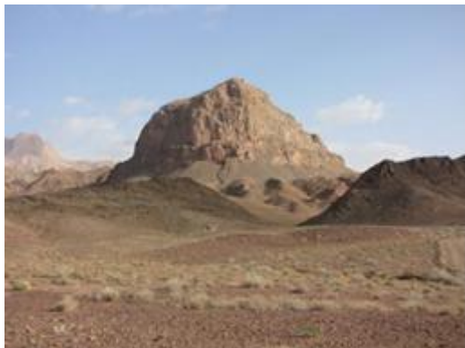
تصویر ۲- نمای عمومی دژ گردکوه