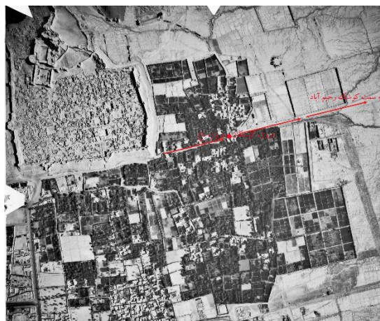
شکل ۴: موقعیت مجموعه ارگ بم نسبت به شهر و تراکم باغات در مجاورت شرق آن