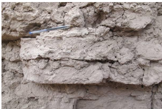
شکل ۱: بقایای خشت‌های بزرگ باروی شهر بست در محله امامزاده زید

یعقوبی، احمدین اسحاق (۱۳۵۶). البلدان. ترجمه محمدابراهیم آیتی. تهران: بنگاه ترجمه و نشر کتاب.