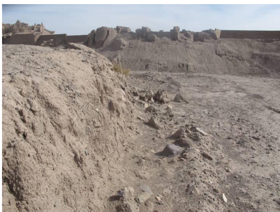
شکل ۲: بقایای سازه آبی نهر شهر در مجاورت غربی ارگ بم، برج ۴۶ که شترگلو در آن قرار دارد در پس‌زمینه تصویر دیده می‌شود، دید از غرب

عدل، شهریار (۱۳۸۶). قنات‌های بم از منظر باستان‌شناسی، سیستم آبیاری در بم و پیدایش و تکامل آن از عهد پیشاز تاریخ تا دوران مدرن، ترجمه علی‌رضا عامری. مجموعه مقالات سومین کنگره تاریخ معماری و شهرسازی در ایران. به کوشش باقر آیت‌الله زاده شیرازی و دیگران. ارگ بم. جلد ۵. تهران: سازمان میراث فرهنگی. ص ۴۷-۱۲۵.