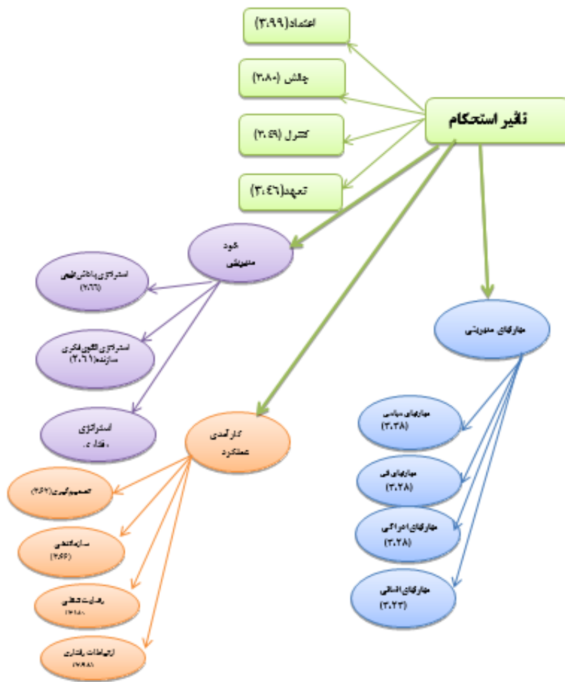
شکل ۲. مدل پیشنهادی پژوهش

مدیریتی در نظر گرفته شد. در بخش مهارت‌های مدیریتی به ترتیب مهارت فنی، ادراکی و انسانی دارای اولویت هستند. در حالیکه در این مطالعه اولویت مهارت‌های مدیریتی شامل ادراکی، انسانی، فنی و سیاسی بود. مهارت سیاسی به عنوان مهارت چهارم مدیران ورزشی در کنار سه مهارت دیگر بررسی شده است. از سوی دیگر گودرزی و همکاران (۲۰۱۲) اهمیت مهارت‌های ارتباطی را در تأثیرگذاری بر مهارت‌های فنی، ادراکی و انسانی مدیران ورزشی نشان دادند (۷)، همسو بود، از این رو نتایج مدل مهارت‌های چهارگانه مدیریتی سه مولفه مهارت‌های فنی، انسانی و ادراکی و مولفه چهارم مهارت‌های سیاسی به عنوان مولفه منحصر به فردی برای مدیران ورزشی در این مدل مورد بررسی قرار گرفته است.