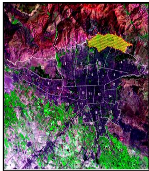
شکل ۱. سازمان فضایی تهران و منطقه یک

همچنین در حالی که از سال ۱۳۵۵ تا سال ۱۳۶۵ تنها ۱۳ نهاد زنان در ایران وجود داشت، تا سال ۱۳۷۹ این تعداد به ۱۵۸ سازمان ثبت شده و ۹۲ سازمان ثبت نشده رسید. در سال ۱۳۸۴ این تعداد سازمان‌ها به ۵۶۹ سازمان ثبت شده و ۵۲۴ ثبت نشده رسیده‌اند. این نهادها در سال ۱۳۸۵ به ۵۸۳ ثبت شده و ۵۷۱ ثبت نشده افزایش یافت (www.moi.ir: 22). اهمیت این نهادها تا به آن حد است که شهرداران این شهرها به هنگام تدوین برخی برنامه‌ها، امور اجرایی و یا افتتاح پروژه‌های شهری در سطح محلات، از آن‌ها به همکاری و یا حضور، دعوت به‌عمل می‌آورند، محله‌های منطقه یک شهر تهران نیز از این مقوله جدا نیستند و حامل این نهادهای فعال و خودجوش در سطح محله‌های مختلف می‌باشند.