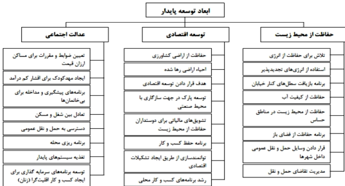
شکل ۱. ابعاد توسعه پایدار

منابع تجدید شونده، جذب ظرفیت‌های محلی و پاسخگویی به نیازهای بشر را مد نظر قرار می‌دهد (قدیری، ۱۳۹۵: ۷۲). کس ۷ معتقد است توسعه پایدار روندی است که بهبود شرایط اقتصادی، اجتماعی، فرهنگی و فن‌آوری به سوی عدالت اجتماعی را دنبال می‌کند و در جهت جلوگیری از آلودگی اکوسیستم و تخریب منابع طبیعی گام برمی‌دارد (تقوایی و صفربادی، ۱۳۹۲: ۶). ترنر ۸ نیز بر این باور است که توسعه پایدار شهری می‌کوشد تا