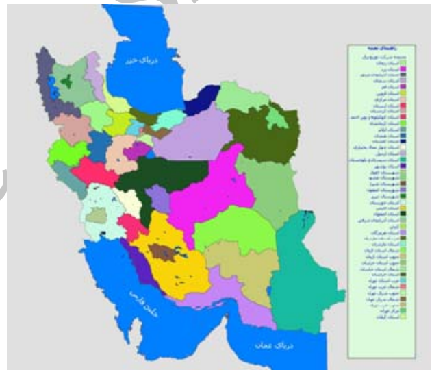
شکل ۳- محدوده شرکت‌های توزیع برق در استان‌های کشور

بعضاً دگرگون کرده و سیستم‌هایی را به مراتب با هزینه کمتر و کارایی بالاتر نوید داده است. سیستم اندازه گیری مشخصه‌های شبکه جزء اصلی ادوات اتوماسیون است که به کمک ریز پردازنده قابلیت اندازه گیری و ذخیره سازی ولتاژ، جریان، فرکانس، توان اکتیو و راکتیو و ضریب توان برای تک فاز و سه فاز، را دارا می‌باشد. این سیستم با قابلیت اتصال به رایانه و از طریق مودم و خط تلفن اطلاعات را به مراکز کنترل و تصمیم گیری ارسال نموده و اتوماسیون را برای پست‌های مختلف در محدوده‌ای گسترده فراهم می‌کند. اجرای فرامین کنترلی توسط کنترل کننده به صورت محلی و از طریق شبکه و PLC ۷ خط مودم در پست‌ها صورت می‌گیرد [۱۰]. برای بحث مفصل‌تری از زیرساخت‌های مخابراتی سیستم اتوماسیون توزیع به [۱۱] رجوع گردد. در شکل شماره ۳ محدوده شرکت‌های توزیع برق در ایران نشان داده شده است.