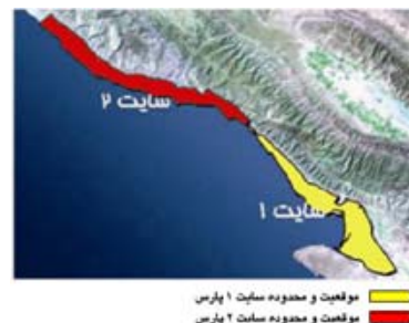
شکل ۱- نمایی از موقعیت‌های سایت ۱ و ۲

هدف اصلی یک سیستم قدرت، تولید، انتقال و توزیع انرژی الکتریکی به طور کافی و مطمئن است. عملکرد این سیستم‌ها تحت تأثیر عوامل زیادی چون تغییرات بار قرار دارند. در این میان وظیفه مراکز کنترل، حفظ یکپارچگی شبکه و تأمین بار به صورت مطمئن و با کیفیت مناسب همراه با بهره‌برداری اقتصادی می‌باشد [۳]. با توجه به گستردگی منطقه ویژه و عدم یکسان بودن سیستم برق رسانی سایت یک و دو نیاز به اندیشه-ای علمی در این باره کاملاً محسوس است. شکل شماره ۱ نمایی از گستردگی این دو ناحیه را نشان می‌دهد.