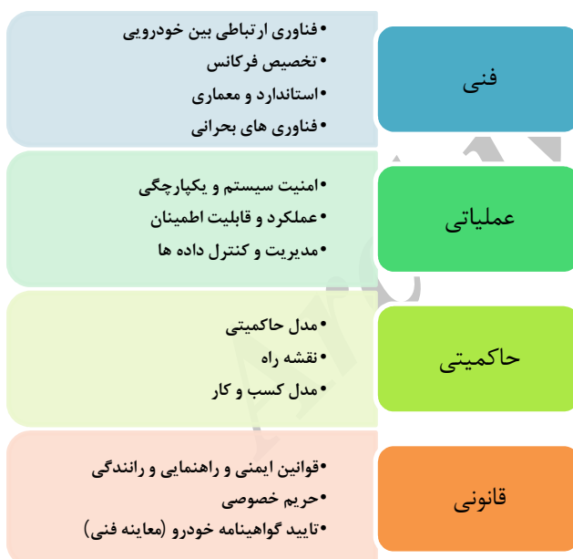
شکل 2: ابعاد چالش‌ها و الزامات فناوری ارتباطات هوشمند خودرویی

شکل شماره 2، ابعاد چالش‌ها و الزامات فناوری ارتباطات هوشمند خودرویی را نشان می‌دهد.