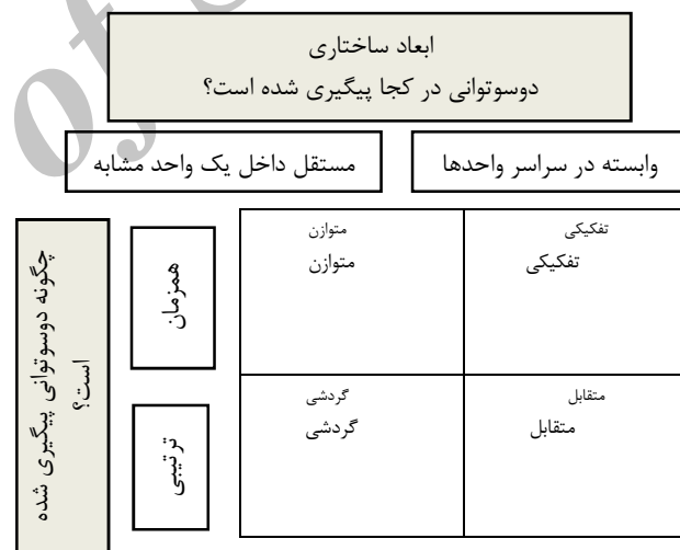
شکل 1: نوع شناسی دوستوانی سازمانی [6]

با کنار هم گذاشتن این ابعاد، چهار نوع توصیف دوستوانی هارمونیک، گردشی، تفکیکی و متقابل مشخص می‌شود که در شکل شماره 1 نشان داده شده‌اند.