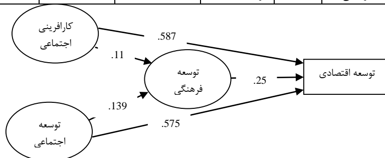
شکل ۲: مدل ساختاری پژوهش