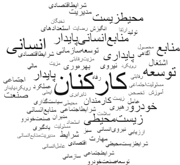
شکل ۱: ابر واژه مستخرج از ۱۵ مصاحبه در نرم‌افزار Nvivo

در این قسمت نتایج حاصل از کدگذاری اولیه یا کدگذاری