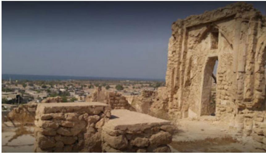
شکل شماره ۴: مسجد امام حسن بصری

واقع بر تپه‌ای کوچک مشرف به گورستان شهر و دارای چشم‌انداز زیبایی است و در قرن هفتم و هشتم هجری قمری ساخته شده است. ابعاد مسجد ۱۵×۱۶ متر است و تقریباً مربع‌شکل است. این بنا دارای زیرزمین، آب‌انبار، اصطبل و احتمالاً مدرسه علوم دینی بوده است.