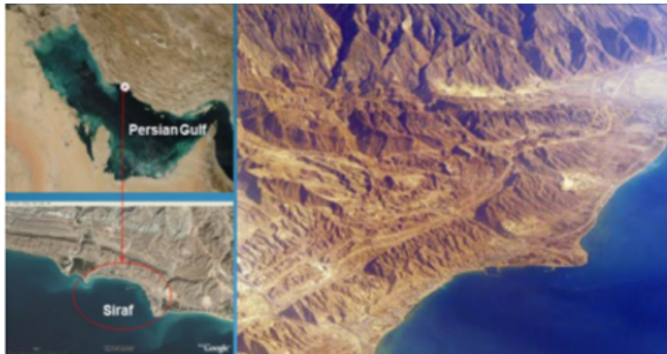
شکل شماره ۱: نقشه موقعیت مکانی بندر سیراف

سیراف مابین کوه و دریا قرار دارد و فاصله آن با کوه حدوداً ۳۰ متر است، به طوری که زندگی ساکنین آن با دریا عجین شده است. بلندی سیراف از سطح دریا حدود ۱۰ متر و آب و هوای آن گرمسیر و نمناک است و تنگ لیر در یک کیلومتری شمال آن قرار گرفته است (سیستانی، ۱۳۸۴:۴۲۲). درباره نام سیراف تحقیقات بسیاری صورت گرفته است. در بعضی کتب و پژوهش‌ها آن را «سیراو» یا «سیروآب» یا آب فروان و برخی نیز شیل آب یا «سیل آب» حرکت کردن آب گفته‌اند و شماری نیز «شیلو» یا شیلاب گفته‌اند؛ همچنین «شیلو» یا «شیلاب» صورت دیگری از سیراف است که در گویش محلی مردم جنوب ایران آب به «او» و یا «اف» تبدیل شده است؛ اما بیشتر پژوهشگران بر این باورند که این واژه در اصل «اردشیرآب» بوده و از نام اردشیر، پادشاه ساسانی (۲۴۱-۲۲۴ م) گرفته شده است که شهرهای بسیاری را در مجاورت خلیج فارس ساخته و به مرور زمان «شیراب» و سپس «سیراف» شده است (معصومی، ۱۳۸۳: ۶۵).