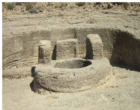
شکل شماره ۳: چاه‌های آب «استودان»