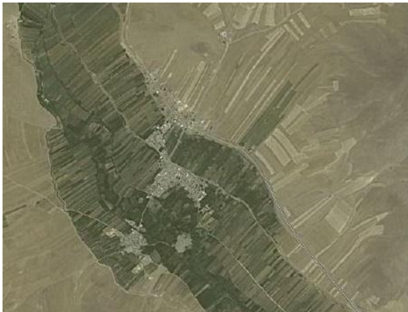
شکل ۱. نقشه هوایی روستای فش