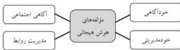
شکل ۱. مؤلفه‌های هوش هیجانی

(کاسچاب ۱ ، ۲۰۰۲؛ بویاتزیس ۲ ، ۲۰۰۲). هوش هیجانی بالا با برون‌گرایی، انعطاف‌پذیری، دلبذیربودن و توانایی هماهنگ نمودن احساس‌های مختلف، شناسایی این احساس‌ها و عمل آنها با مغز و رفتار، هم‌بستگی دارد (بویاتزیس، ۲۰۰۲). از ۱۹۹۰ تا اوایل هزاره جدید، محققان ابعاد گوناگونی را برای هوش هیجانی برشمرده‌اند. بیشتر این طبقه‌بندی‌ها مشابه یکدیگر است و تفاوت اندکی بین آنها مشاهده می‌شود. شکل ۱ بر اساس طبقه‌بندی لرد و هوگان به دست آمده و در آن به ابعاد اصلی و فرعی هوش هیجانی اشاره شده است (زاهدی و زندی، ۱۳۹۴: ۹).