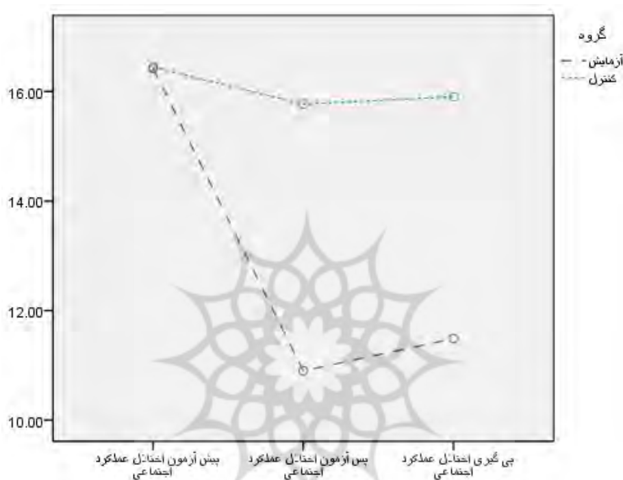
نمودار ۳: تفاوت میانگین اختلال عملکرد اجتماعی در گروه‌های آزمایشی و کنترل طی مراحل پیش‌آزمون، پس‌آزمون و پی‌گیری

و (Sig.=۰/۴۵۱) معنادار نبود. نمودار ۱ نیز تفاوت میانگین اختلال عملکرد اجتماعی را در گروه‌های آزمایشی در مقایسه با گروه‌های کنترل طی مراحل پیش‌آزمون، پس‌آزمون و پی‌گیری نشان می‌دهد.