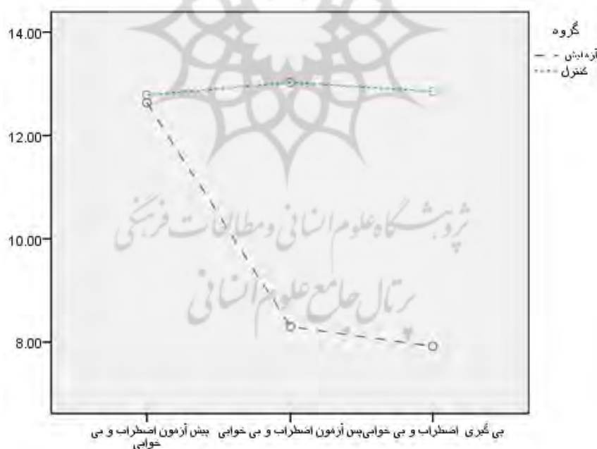
نمودار ۲: تفاوت میانگین اضطراب و بی‌خوابی در گروه‌های آزمایش و کنترل طی مراحل پیش‌آزمون، پس‌آزمون و پی‌گیری

بدنبال معنادار شدن تفاوت ۳ نمره پیش‌آزمون، پس‌آزمون و پی‌گیری در گروه‌های آزمایش ( P < 0/01 )، بررسی دو به دوی تفاوت معنادار نمرات اضطراب و بی‌خوابی بین سه نمره مرحله‌ی قبل از مداخله، بعد از مداخله و چهار ماه بعد، بین دو گروه آزمایش و دو گروه کنترل از طریق مقایسه‌های زوجی (تفاوت میانگین‌ها «I-J») با آزمون تعقیبی بونفونی نشان داد که در سطح P < 0/05 میانگین‌های گروه آزمایش مردان و گروه کنترل ( I-J = 7/234 و Sig. = 0/001 ) و میانگین‌های گروه آزمایش زنان و گروه کنترل ( I-J = 8/023 و Sig. = 0/001 ) به‌طور معناداری متفاوت بود. در واقع بین دو گروه آزمایشی با دو گروه کنترل تفاوت معنادار بود و در بقیه مقایسه‌ها تفاوت معناداری مشاهده نشد. تفاوت میانگین گروه آزمایش مردان با گروه آزمایش زنان ( I-J = 1/172 و Sig. = 0/783 ) معنادار نبود. نمودار ۱ نیز تفاوت میانگین اضطراب و بی‌خوابی را در گروه‌های آزمایشی در مقایسه با گروه‌های کنترل طی مراحل پیش‌آزمون، پس‌آزمون و پی‌گیری نشان می‌دهد.